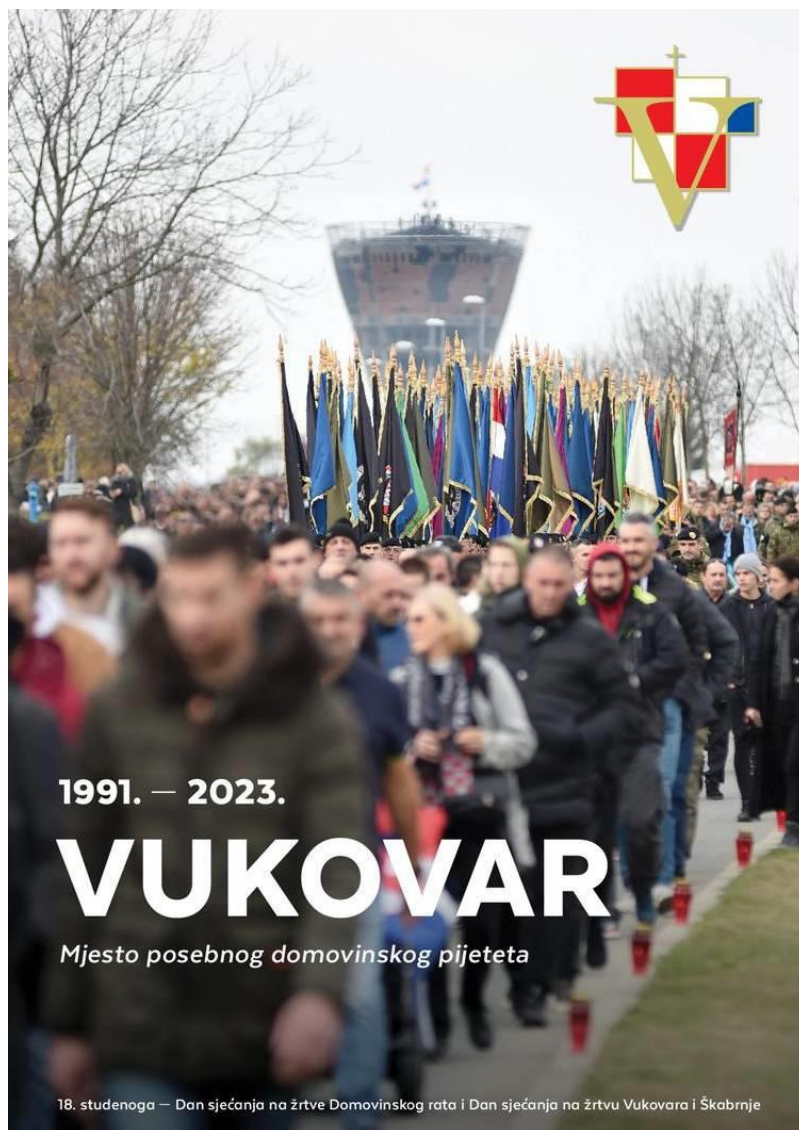
Slika 4 Drugi, prihvaćeni prijedlog službenog plakata

Vukovar je simbol stradanja i herojstva u Domovinskom ratu. Komemoracija se uobičajeno održava na mjestima posebnog značaja. Glavna spomen područja uključuju Vukovarsku bolnicu, Spomen-dom Ovčara i Vodotoranj – simbol hrvatskog otpora. Središnje mjesto obilježavanja održava se na Memorijalnom groblju. Specifično za obilježavanje ovog praznika jest što se ne održava samo na jednom mjestu i uključuje velik broj dionika koji će se detaljnije opisati u poglavlju 6.2.