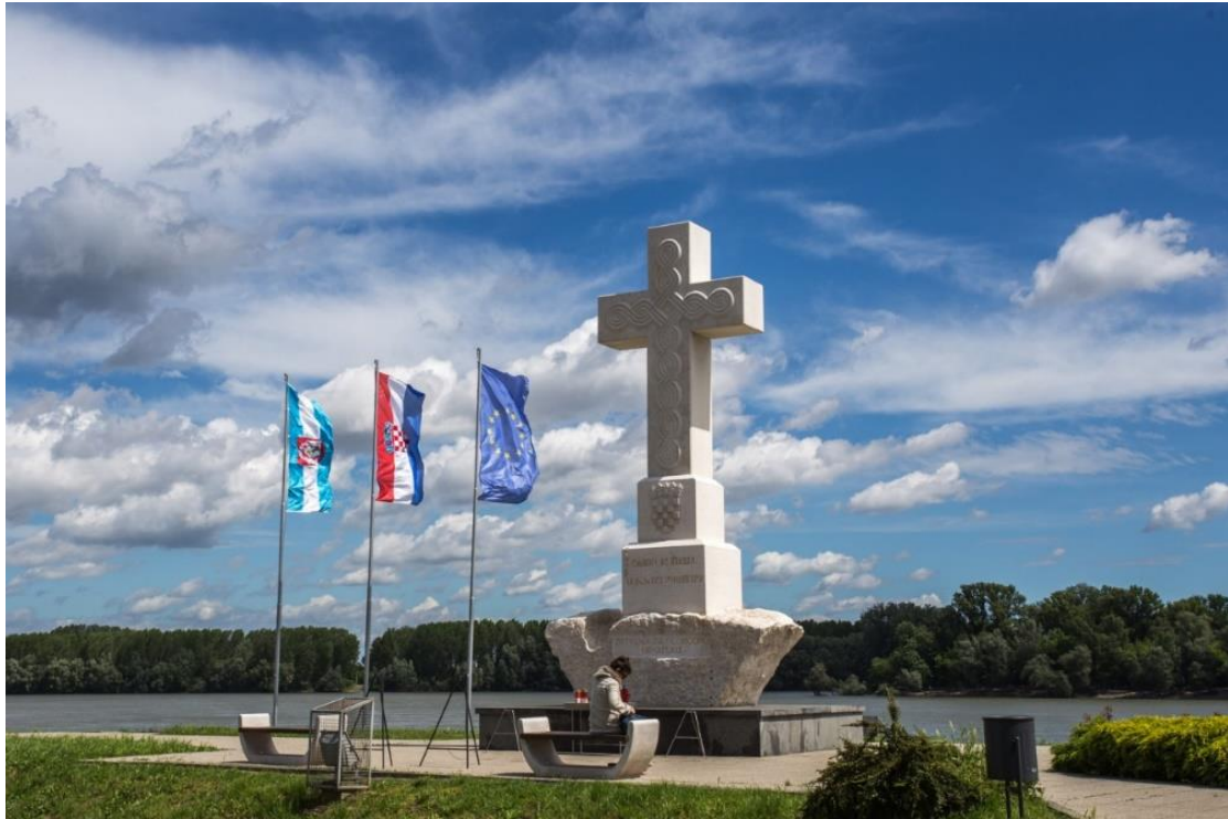
Slika 1 Mjesto sjećanja – križ na ušću rijeke Vuke u Dunav

obilježavanja značajnih događaja ne samo na mjestima sjećanja nego i u mjestima u kojima žive. Odgojno obrazovne institucije također imaju značajnu ulogu u prenošenju znanja i očuvanju tradicije o čemu će biti više riječi u poglavlju 6.5