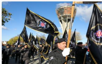
Slika 5 Primjer objava Večernjeg lista

Mjesec studeni za Vukovarce je već 32 godine traumatično razdoblje u kojem se s tugom i boli prisjećaju agresije na svoj grad, u kojoj je nakon najkrvavije bitke Domovinskog rata i tromjesečne opsade