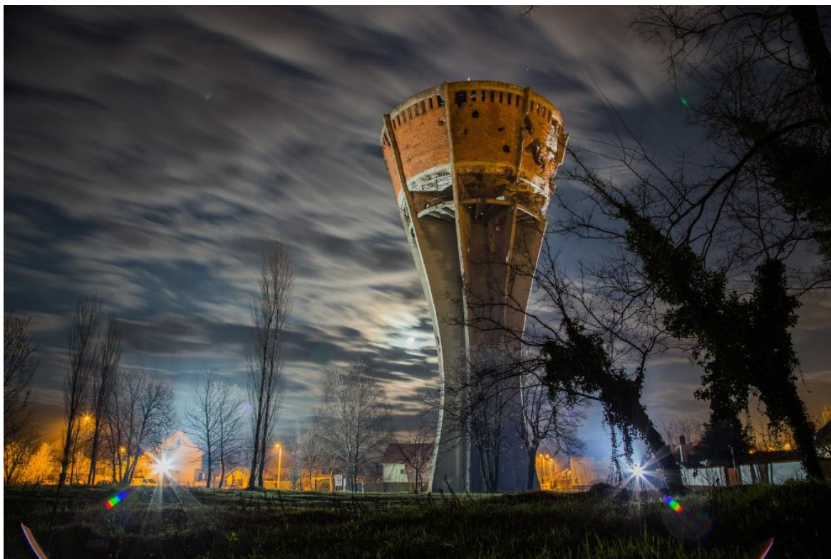
Slika 2 Mjesto sjećanja – Vukovarski vodotoranj

Mjesta sjećanja prate događaje koji su se u Vukovaru zbili za vrijeme okupacije. Pričaju potresnu priču i održavaju sjećanje živim.