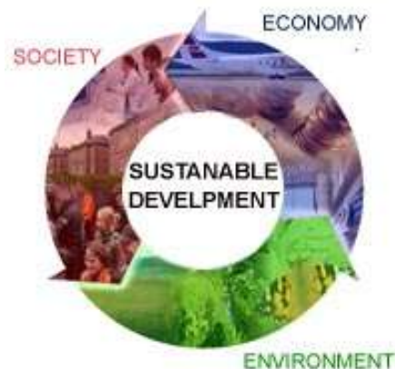
Slika 1.: Razine održivog razvoja

Održivi razvoj ima tri glavne razine , a to su: gospodarska, društvena i ekološka.