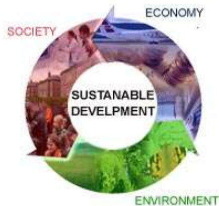
Slika 1.: Razine održivog razvoja

Održivi razvoj ima tri glavne razine , a to su: gospodarska, društvena i ekološka.