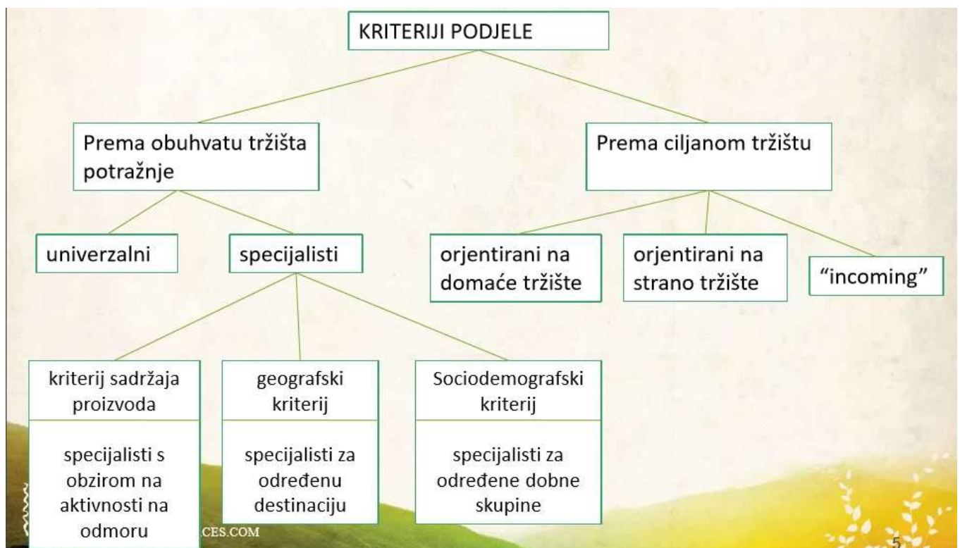
Slika 9.: Podjela turoperatora 42

Detaljan prikaz vrsti turoperatora grupiran prema skupinama nalazi se na sljedećoj slici: