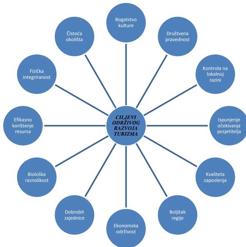
Slika 2.: 12 glavnih ciljeva održivog razvoja turizma