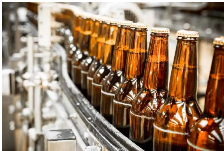
Slika 4.3 Punjenje ambalaže (ARZ: Kako je počela proizvodnja piva ) [5]

Osnovni princip punjenja ambalaže je punjenje pod povišenim tlakom. Izobarometrijski uređaji rade na načelu rastakanja piva u okruženju jednakog tlaka u stroju za punjenje i boci, pa se pivo puni na načelu razlike u visini. Diferencijalno-tlačni uređaji rastaču pivo na načelu razlike tlakova u stroju za punjenje i boci. Boce moraju biti jednako i čim više napunjene kako ne bi došlo do oksidacije. U pogonu za punjenje ambalaže najčešće se nalazi i sustav za zatvaranje boca kako bi se boca čim prije zatvorila i smanjila mogućnost mikrobiološke kontaminacije. Za zatvaranje boca koriste se krunski zatvarači s 21 zubom koji se mehanički utiskuju na grlo boce. Na zatvorenu ambalažu se lijepi etiketa s podacima o proizvodu, a zatim se na nju otiskuje podatak o roku trajnosti [1].