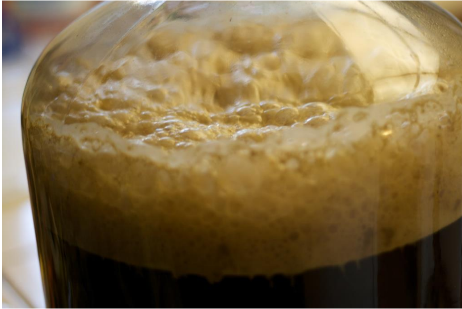
Slika 4.2 Fermentacija piva visokog intenziteta (Hoću pivo: Fermentacija) [4]

Vrenje piva se prekida hlađenjem na temperaturi između 2 – 4 °C prije nego što svi fermentabilni šećeri pređu u etanol i ugljikov-dioksid te kako bi se istaložila većina kvasca i neželjenih komponenti u pivu.