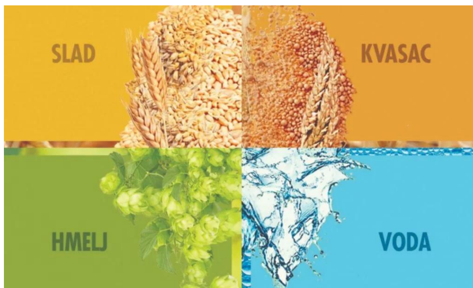
Slika 3.1 Četiri osnovna sastojka za proizvodnju piva (Gospodarski list: Proizvodnja piva: Kako proizvesti pivo?) [2]

Za proizvodnju piva potrebne su četiri osnovne sirovine, to su voda, ječmeni slad, hmelj i kvasac, a još se može koristiti 600 dodatnih sastojaka.