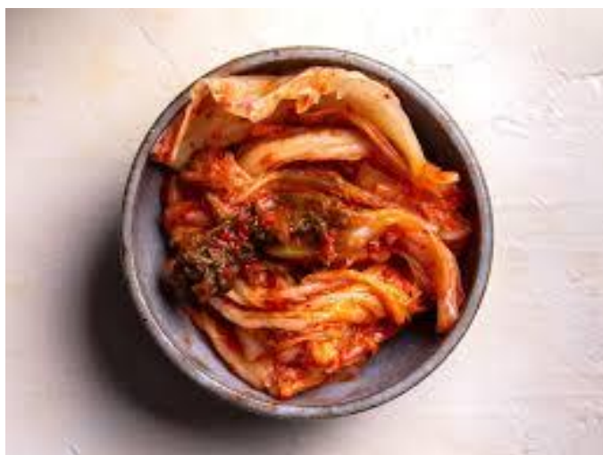
Slika 2- Kimchi

Iako fermentacija pomaže u očuvanju hrane, postoji rizik od kontaminacije patogenim bakterijama, osobito ako proces fermentacije nije pravilno kontroliran. To može dovesti do trovanja hranom i drugih zdravstvenih problema [4].