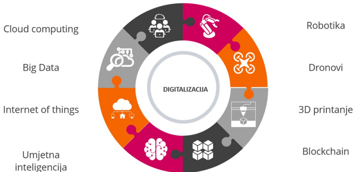
Slika 1. Prikaz digitalizacije