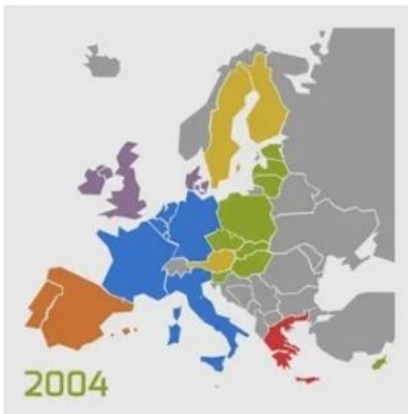
Slika 6: Peto proširenje Europske unije

Estonija, Litva, Latvija, Rumunjska i Slovačka. U 1996. godine Slovenija i Češka potpisuju sporazume o pridruživanju te podnose zahtjeve za punopravno članstvo u Uniji. Mađarska, Cipar, Češka, Poljska, Slovenija i Estonija 31. ožujka 1998. godine započinju pregovore o ulasku u EU. Rumunjska, Slovačka, Litva, Latvija i Bugarska te Malta tek 1999. stječu status kandidatkinja za članstvo, dok pregovori započinju 15. veljače 2000. godine. Pregovori sa svih deset kandidatkinja završeni su u Kopenhagenu 13. prosinca 2002. godine. 1. svibnja 2004. godine Europska unija i službeno proširila se za deset novih članica (Mintas Hodak i sur., 2010).