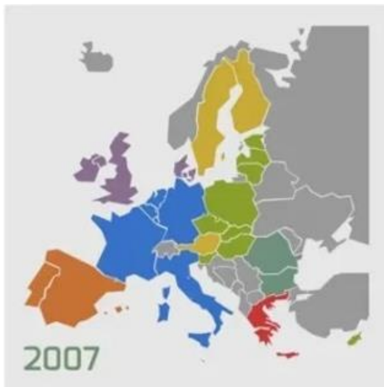
Slika 7: Šesto proširenje Europske unije