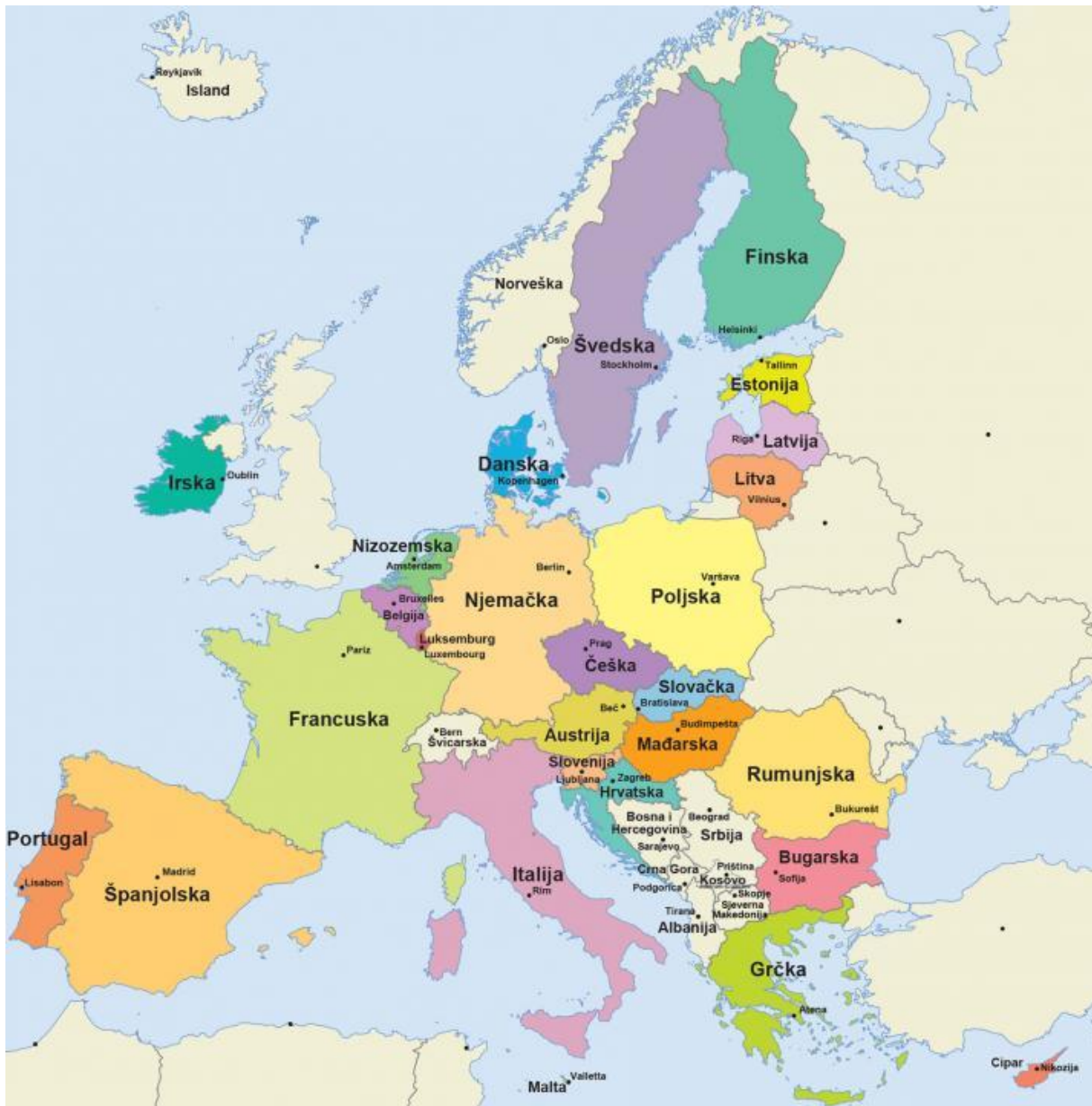
Slika 1: Politička karta Europske unije