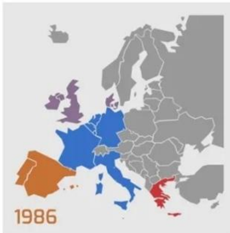
Slika 4: Treće proširenje EEZ-a

također postala članicom vijeća Europe. Sami pregovori su trajali šest godina, od 1979. do 1985. godine je te u Madridu potpisan Ugovor o pristupanju u EEZ-u, da bi 1. siječnja 1986. godine postala članicom EEZ-e“ (Bijažić, 2020). Stupanjem Španjolske u EEZ, prvobitna Zajednica šest zemalja osnivača proširila je svoje članice za 100% te je postala Zajednicom dvanaestorice (Mintas Hodak i sur., 2010).