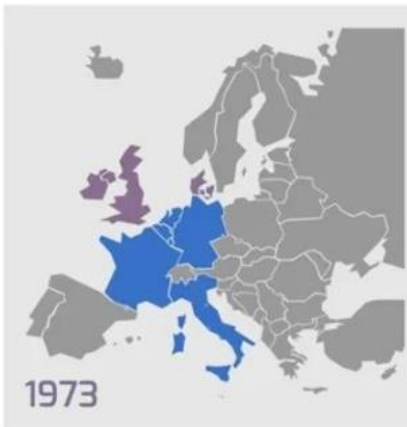
Slika 2: Prvo proširenje EEZ-a

Zajednici podnijele su 1961. godine isto kada iz Velika Britanija Početak samih pregovora o članstvu VB označio je i početak pregovora s Irskom i Danskom. Danska i Irska prvenstveno su bile agrarne zemlje koje su se bavila ribarstvom i poljoprivredom koje su izvozile u Veliku Britaniju te je logično da su aplicirale za članstvo u Zajednici isto kada i Velika Britanija. Referendum o ulasku Irske u EZ, EURATOM te Europsku zajednicu za ugljen i čelik održao se 10. svibnja 1972. godine. Na referendum je izašlo oko 70% birača od čega je čak 81% podržavalo odluku vlade o ulasku Irske u EZ. Danska je očekivala da će joj članstvo u Zajednici omogućiti promptno širenje na zajedničko tržište, no vrlo razvijena poljoprivreda Danske predstavljala je moguću opasnost poljodjelicima na području šest zemalja članica Zajednice. S obzirom da su „stare“ članice očekivale konkurentski pritisak Danske, nisu bile spremne prihvatiti ju u Zajednicu ukoliko ona ne pristane određene prijelazne rokove u kojima bi polako povećala izvoz svojih poljoprivrednih proizvoda na zajedničko tržište EZ. Danska je svoj referendum o ulasku u EEZ slavila, naime, na referendum je izašlo čak 89,5% birača, od kojih je 63% bilo za ulazak Danske u EEZ (Mintas Hodak i sur., 2010).