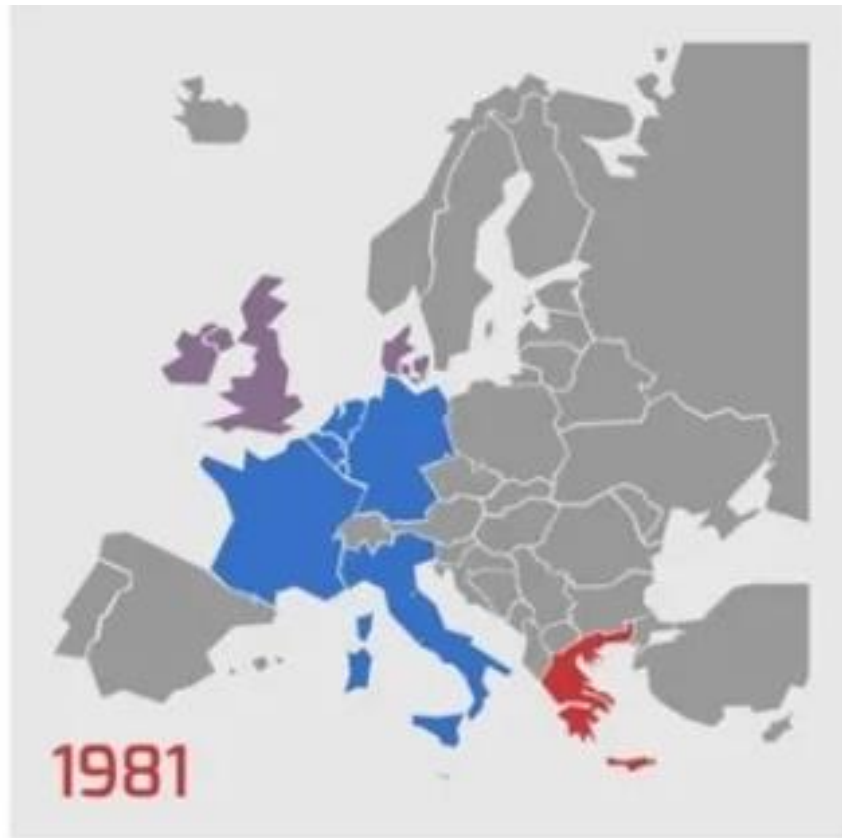
Slika 3: Drugo proširenje EEZ-a

se izostaviti niti činjenica da je Libija najveći dobavljač nafte za Grčku i da ta zemlja ima daleko najveći uvoz nafte od svih zemalja članica EZ-a (Vukadinović, Čehulić, 2005).