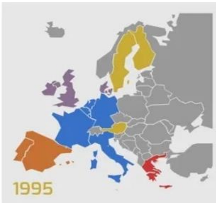
Slika 5: Četvrto proširenje Europske unije

Norveška, Danska, Portugal, Austrija i Švicarska. Island postaje članicom 1970., Finska 1986., a Lihtenštajn 1991. godine. Sporazumom koji je potpisan 1991. godine između tadašnjih 12 članica EU i tadašnjih 7 zemalja EFTA-e osnovan je „europski ekonomski prostor“ (engl. European Economic Area – EEA ) koji je bio znatno širi od samog tržišta Europske unije. EEA je svojim članicama, koje nisu bile članice EU, omogućio slobodan nastup na unutarnjem tržištu Unije. Navedeni sporazum na snazi je od 1. siječnja 1994. godine i vrijedi još i danas (Bijažić,2020). Četvrtim valom proširenja Europska unije brojala je 15 članica.