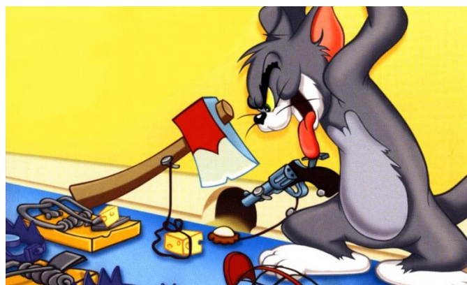
Slika 5.1.3. Korištenje oružja u animiranom filmu Tom i Jerry

U podlozi humora bili su određeni oštri aspekti života poput usamljenosti, tuge, depresije, nesigurnosti i očaja – pitanja koja su zrela i djeci često komplicirana za razumijevanje. Primjer nasilja vrlo se dobro može primijetiti kroz scene kao što su udaranja, šutiranja, hvatanja, gnječenja, ugrizi, šamaranja, bacanja, razbijanja bejzbol palicama itd. Likovi ponekad koriste oružje poput maljeva, motornih pila i sjekira (slika 5.1.3.). Scena u kojoj Tom i Jerry uništavaju hotelsku sobu, a kasnije pomažu uništiti hotelsko predvorje, uključujući kulturni stakleni strop, djeci daje dojam da je uredu uništavati imovinu i pritom proći nekažnjeno [26].