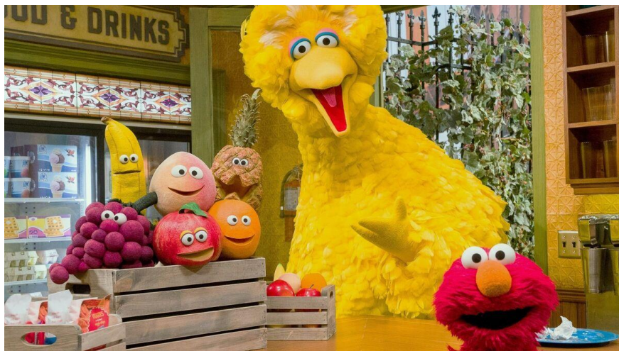
Slika 4.1.1. Promocija zdrave prehrane kroz emisiju „Ulica Sezam“

Razina razvoja pojedinog djeteta ključni je čimbenik u određivanju hoće li medij imati pozitivne ili negativne učinke. Televizija može biti moćan učitelj. Ulica Sezam primjer je kako mala djeca mogu naučiti vrijedne ideje o rasnoj harmoniji, suradnji, ljubaznosti, jednostavnoj aritmetici, zdravoj prehrani i abecedi putem obrazovnog televizijskog formata (slika 4.1.1). Neki programi javne televizije stimuliraju posjete zoološkom vrtu, knjižnici, knjižarama, muzejima i drugim okruženjima za aktivnu rekreaciju, a obrazovni vide-i svakako mogu poslužiti kao moćna sredstva za prosocijalno podučavanje. U nekim nepovoljnim okruženjima, zdrave televizijske navike zapravo mogu biti koristan alat za podučavanje. Susjedstvo gospodina Rogersa još je jedan primjer obrazovne televizije koja uči o razlici između lažnog i stvarnog svijeta, kao i dobrim vrijednostima kao što su poštenje, briga, ljubav i strpljenje.