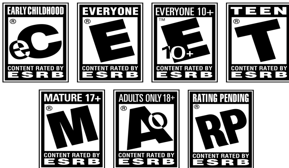
Slika 4.2.2. Oznake kojima se koristi sustav ESRB