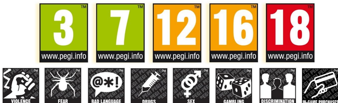
Slika 4.2.1. Oznake kojima se koristi sustav PEGI