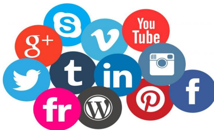
Slika 2.1.3. Primjer digitalnih medija

Digitalni mediji (slika 2.1.3.) odnose se na medije koji koriste digitalnu tehnologiju i mreže za stvaranje, pohranu, pristup i dijeljenje informacija ili sadržaja. Neki primjeri digitalnih medija su internet, društveni mediji, mobilni telefoni itd. Jedan su od najnovijih i naprednih oblika medija i imaju prednosti povezivanja, personalizacije i sudjelovanja. Važni su za pružanje informacija, obrazovanja i zabave korisnicima te za njihovo osnaživanje kao proizvođača i potrošača medija [3].