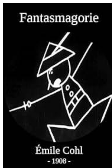
Slika 5.1. Naslovnica prvog crtanim filmom „Fantasmagorie“

Crtani filmovi dio su povijesti kinematografije od vremena kada su prvi filmovi snimljeni. Nastali su korištenjem animacije umjesto živih glumaca. Mogu se također opisati kao stvaranje filmova snimanjem slijeda malo varirajućih crteža ili modela tako da se čini kao da se likovi kreću i mijenjaju. Osamdesetih i devedesetih godina Walt Disney produkcije i nekoliko drugih istaknutih crtanih emisija kao što su Tom & Jerry, Popeye, Bugs Bunny itd. imali su izvanredan utjecaj na tržište. Prvim animiranim filmom smatra se Fantasmagorie Émilea Cohla (slika 5.1.). Kratki film od 1 minute i 45 sekundi koji počinje s parom ljudskih ruku koje crtaju figuru čovjeka. Crtež štapića tada oživljava i odlazi u kino, susreće klauna i slona. Elvis Cohl bio je inspiriran tehnikama stop-motiona koje su bile prikazane u filmu britansko-američkog redatelja J. Stuarta Blacktona iz 1900. The Enchanted Drawing i filmu iz 1906. Humorous Phases of Funny Faces. Obojica su koristili rani oblik animacije, koristeći stop-motion tehnike za postavljanje uzastopnih rukom crtanih slika zajedno kako bi stvorili kratke filmove [22].