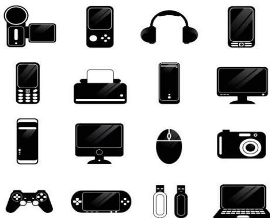
Slika 2.1.2. Primjer elektroničkih medija

Elektronički mediji (slika 2.1.2.) odnose se na medije koji koriste elektroničke uređaje i signale za prijenos i primanje informacija ili sadržaja. Neki primjeri elektroničkih medija su radio, televizija, kino, itd. Jedan su od najpopularnijih i najraširenijih oblika medija i imaju prednosti brzine, raznolikosti i interaktivnosti. Važni su za informiranje, obrazovanje i zabavu slušatelja i gledatelja te za stvaranje globalne medijske kulture [3].