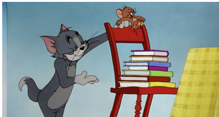
Slika 5.1.1 Tom pomaže Jerry-u jesti za istim stolom

Tom i Jerry prvi puta je proizveden 1940. godine i malo po malo dominira ljubiteljima crtića iz cijelog svijeta zadržavši se kao jedan od najpopularnijih crtića. Nije samo beskrajno rivalstvo između mačke i miša povezano s komedijom ono što pomaže crtiću da bude jedna od tema o kojoj se priča u industriji zabave i medija, već se stvorilo i neke kontroverze u pogledu njegovog sadržaja. Tom pokušava uhvati Jerryja, ali je Jerry doista pametan. Obično se na kraju svake epizode Jerry pojavljuje kao pobjednik, a Tom je prikazan kao gubitnik. Unatoč njihovom komičnom rivalstvu, oni ponekad pokazuju iskreno prijateljstvo i osjećaj za dobrobit jedni drugih. Jerry je bio vrlo malo stvorenje pred Tomom, ali je također bio neporaženi prvak i uvijek je igrao protiv Toma svojom inteligencijom, odlučnošću i potencijalom. Nikada se ne smije podejnjivati protivnika ili bilo koga gledajući njihovu veličinu ili pretpostavljajući da su mali ili nemoćni. Jerry na kraju pobjeđuje i puni samopouzdanja. Vrlo dobro zna kako se otrgnuti svim preprekama bez obzira na to koliko se puta na njih spotakne. Na taj način Jerry uči da je samopouzdanje najprivlačnija kvaliteta koju osoba može imati. Ako se pažljivo pogleda, Tom nikada ne koristi iste tehnike da uhvati Jerryja. I prije je bio neuspješan, ali je tek saznao da ti trikovi neće uspjeti. Time uči djecu da nastave učiti, truditi se i rasti[26].