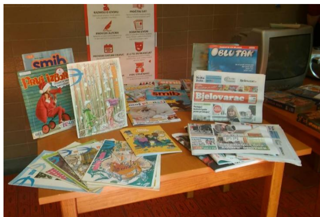
Slika 2.1.1. Primjer medija za ispis

Mediji za ispis (slika 2.1.1.) odnose se na medije koji koriste papir ili druge materijale za prikazivanje informacija ili sadržaja. Neki primjeri tiskanih medija su novine, časopisi, knjige, letci, brošure itd. Tiskani mediji jedan su od najstarijih i najtradicionalnijih oblika medija i imaju prednosti trajnosti, vjerodostojnosti i pristupačnosti. Tiskani mediji važni su za informiranje, obrazovanje i zabavu čitateljima te za utjecaj na njihova mišljenja i ponašanja [3].