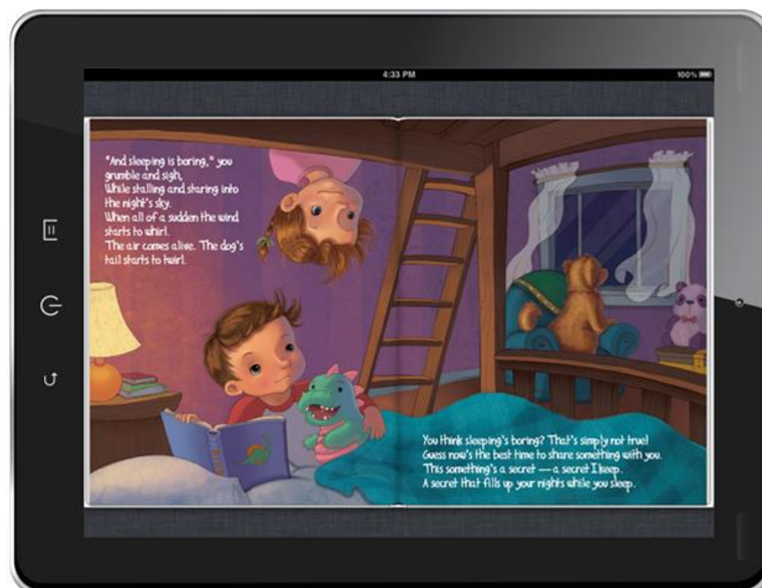
Slika 4.1.2. Čitanje slikovnice na elektroničkom čitaču

Korištenje tehnologija videochat-a (npr. Skype, Facetime) koje omogućuju interaktivnu, dvosmjernu razmjenu između djece i odraslih može olakšati učenje. Osim toga, korištenje tehnologija videochat-a može potaknuti društvene koristi pomažući u održavanju obiteljskih veza s roditeljima koji su fizički odsutni. Nedavno istraživanje provedeno tijekom pandemije otkrilo je da je videochat omogućio osjetljivu interakciju između djece i baka i djedova te pogodovao dječjem angažmanu i pozitivnom učinku (Roche et al., 2022). Također, korištenje elektroničkih knjiga (e-knjiga) za dojenčad i malu djecu čini se obećavajućom strategijom za pružanje pristupa širokom rasponu dječje literature na više jezika putem široko dostupnih tableta i elektroničkih čitača (slika 4.1.2) [15].