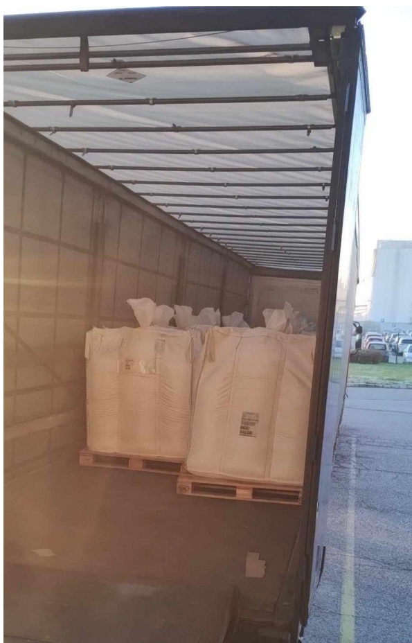
Slika 7: Istovar robe

Na kraju, primatelj potpisuje CMR dokument ili teretni list kao potvrdu da je roba isporučena. Vozač također potpisuje i uzima kopiju kao dokaz o izvršenoj isporuci. Vozač obavještava svoju bazu ili transportnu kompaniju o završetku isporuke i vraća se ili preuzima novu pošiljku, ovisno o planu rute.