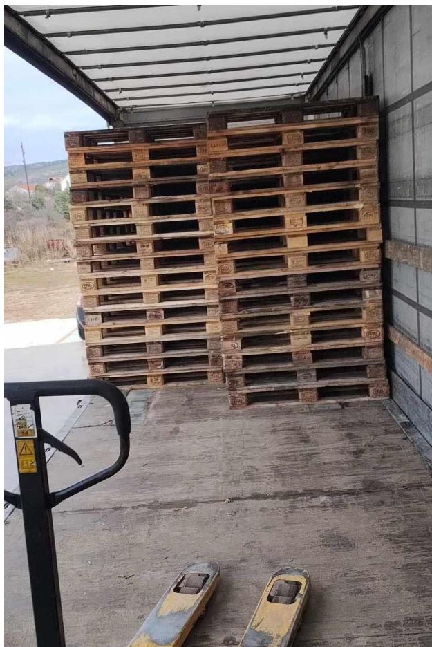
Slika 5: Utovar zaštitnih paleta na kamion