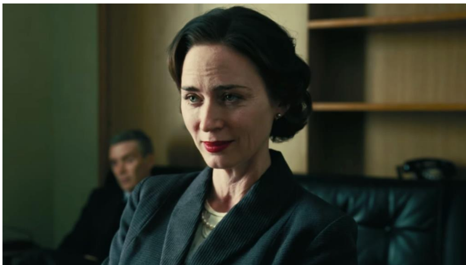
Slika 7.1.9. Emily Blunt kao Katherine Kitty Puening

U javnost izlazi sa suprugom, u tamnim kostimima te midi 33 suknjama, uglavnom kao njegova potpora. Njezina „običnost“ zapravo je povezana s vremenom i profesionalnošću koja je čini takvom kakva jest. S obzirom na to da se radnja filma događa za vrijeme Drugoga svjetskog rata, razumljivo je da je moda drugačija nego u filmu Barbie , no to ne odbacuje stereotip koji prikazuje Kitty – onaj prema kojemu se znanstvenice odijevaju drugačije od „lutkica“. Također, njezino pravilno držanje znak je pristojnosti dok je kod Barbie znak savršenosti, popraćeno izraženom mimikom.