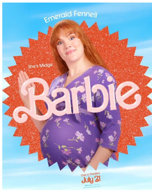
Slika 7.1.13. Trudna Barbie Midge

Potrebno je spomenuti i trudnu Barbie Midge. Njezina uloga u filmu nema nikakvu svrhu osim izazivanja čuđenja i gađenja od strane šefa Mattela. Proizvodnja ove lutke do 2013. godine iz istog je razloga očito i ukinuta. CNN style objašnjava to kroz prizmu ne-promoviranja tinejdžerskog majčinstva. Također crvenokosa, uz to i pjegava, ova je kontroverzna lutkica povratkom u prodaju ponovno suzbila netradicionalna mišljenja roditelja o pitanju ranog majčinstva. 35 Njezina mimika i geste, način odijevanja kao i fizički izgled nisu u skladu s ostalim lutkicama. Konačno, prikazana je dva puta unutar vlastita dvorišta, sama i izolirana.