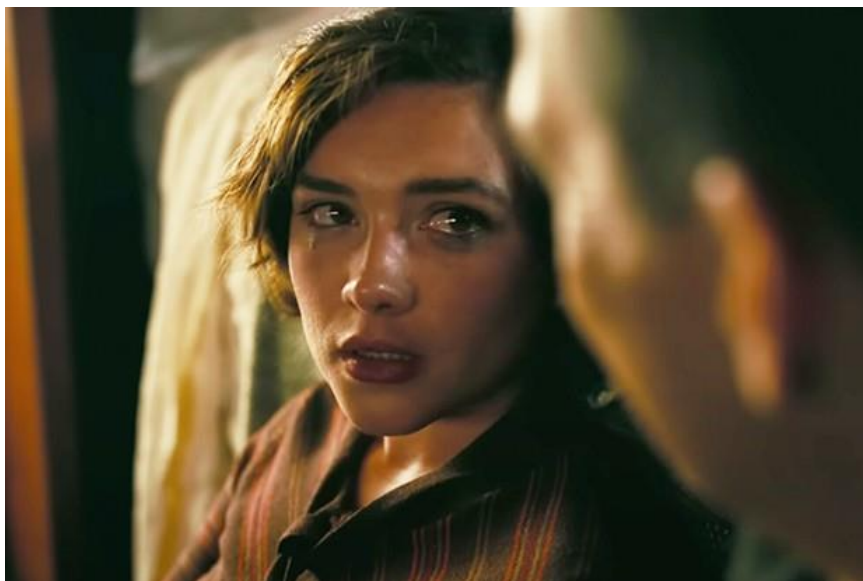
Slika 7.1.12. Jean Tatlock

Kitty i Robert u filmu Oppenheimer slobodno vrijeme provode jašući konje, a uz to važan detalj bila je i njegova ljubavna afera s Jean Tatlock – zaljubljenom, emocionalno turbulentnom komunističkom psihijatricom, koju Kitty tolerira. Ovaj čin dodatno pokazuje nepoštovanje prema ženama dok Kitty čini nedovoljno snažnom da to predbaci svojem muškarcu.