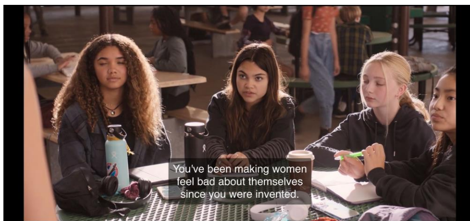
Slika 7.1.10. Primjer izravne komunikacije Sashe i Barbie

Autorica Naomi Wolf u svom djelu Mit o ljepoti žensku samoobjektivizaciju objašnjava kroz „opijenost“ ljepotom modela iz časopisa. Novije doba, drugačiji mediji i razvoj feminizma otada, poboljšao je svijest žena o nerealnim idealima ljepote koji se kroz medije prikazuju. Sasha u tom kontekstu napada Barbie. O tom buntovništvu progovara i Brian McNair u svom djelu Striptiz kultura . Uzimajući u obzir feminizam i medijsku pismenost publike, primjećujemo da buntovništvo Sashe prema Barbie bolje prolazi nego njezina sladunjavost i prihvaćanje.