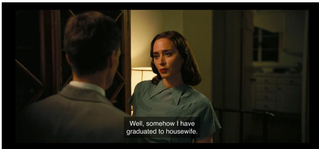
Slika 7.1.3. Primjer karakterizacije Kitty

To, ali i brojni detalji poput zanemarivanja ljubavne afere s drugom ženom, ostavljaju potpuno drugačiji dojam nego što je to u stvarnosti bilo, a za što je isključivo zaslužan Christopher Nolan. Kao što je ranije u radu spomenuto, žene i muškarci imali su drugačiju povijest, stoga njihova različita promišljanja potaknuta drugačijim načinom života, uvelike imaju utjecaj na njihovo stvaralaštvo.