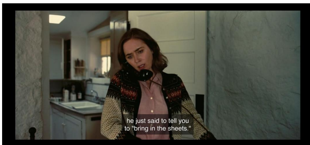
Slika 7.1.11. Primjer dogovorena izraza „uzmi plahte“

U Oppenheimeru je drugačije. Radi se o stvarnom svijetu koji sažima intelektualnu autonomiju i etičku odgovornost, stoga se otvorena komunikacija ponekad morala izbjeći. Takav je primjer dogovorena komunikacija između Kitty i Roberta. Zbog sigurnosnih razloga koristili su se izrazom „uzmi plahte“ – što znači njegov uspjeh. Uz to, niska čujnost dijaloga, njihov tempo i dramatični izrazi lica Nolanov su umjetnički izbor zbog čega se dodatno stvara napetost.