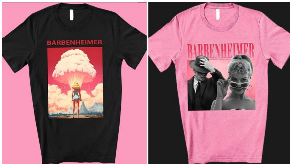
Slika 7.1.177. Barbenheimer odjeća

Dakle, osim što su filmovi sami po sebi postali senzacija, također su dodatno komercijalizirali filmsku umjetnost što je dovelo do procvata marketinga. Antonijević objašnjava da „marketinški pristup filmu narušava strukturu filma koristeći proizvode van funkcije u okviru scenarija (...) i dovodi do samog preovladavanja narativom“ (Antonijević 2016: 1477). Prema tome, iako postoji osnova za film koji bi u budućnosti mogao stvoriti razumljivu priču o lutki znanstvenici ili o znanstveniku odjevenom u ružičasto odijelo, taj film gubi na vjerodostojnosti upravo zbog