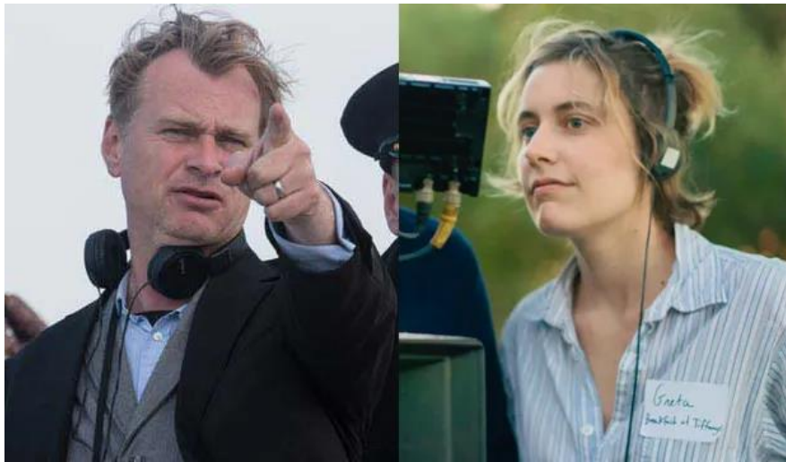
Slika 7.1.1. Redatelji filmova – Christopher Nolan ( Oppenheimer ) i Greta Gerwing ( Barbie )

Takva situacija u kinematografiji donosi dodatan značaj filmovima. Svaki redatelj iz vlastite perspektive doprinosi njihovom sadržaju. Greta Gerwing kao žena, bez obzira na (ne)sklonost feminističkim promišljanjima, sugerira pretpostavku da suosjeća s pojedinim prikazanim situacijama. Kroz film govori ono što možda ne govori javno, no to ipak ostaje zabilježeno javno – kroz medij.