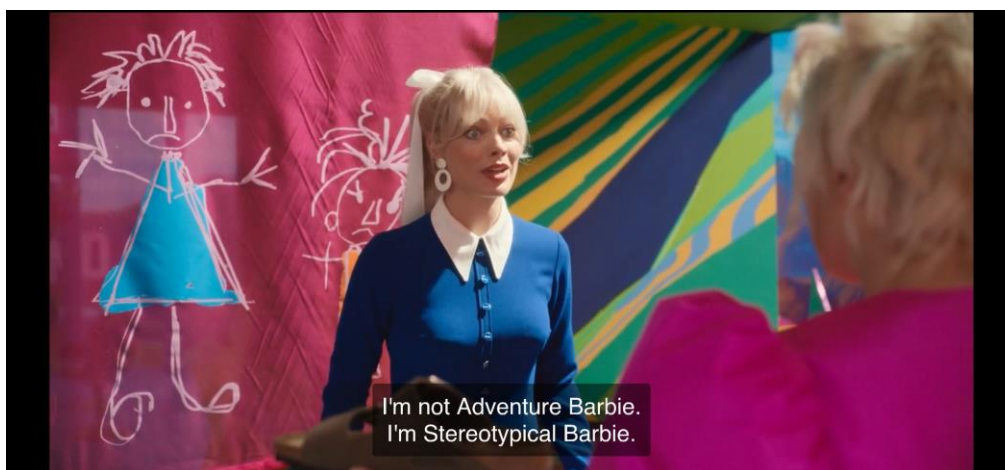
Slika 7.1.14. Barbie naglašava stereotipnost

Kenova neočekivana primjedba da je stvarni svijet – muški svijet, iz kojeg izlazi prepun patrijarhalnog elana, pomalo bezobziran i sebičan, mnogo govori o stanju društva danas. Taj muški (stvarni) svijet, osim što nije prožet bojama i razigranom glazbom te dobrim raspoloženjem kao što je to u Barbielandu, prepun je osude, pesimizma, negativnosti, seksualiziranja žena i „vlasti muškaraca“. Ovakav veliki kontrast stvarnosti od savršene fikcije prikazuje negativnosti koje iz tih razlika proizlaze, a generaliziranje stvarnosti kao „muške“ događa se upravo na temelju primjera seksualiziranja i ismijavanja Barbie. Osim toga, Mattelovi zaposlenici uglavnom su muškarci, osobito oni na čelu poslovanja, a žene poput Glorije i Ruth Handler (njezine kreatorice) stjerane su u kut svojom sporednom ulogom, koja je zapravo vrlo značajna, što se kasnije pokaže u Barbielandu u kojemu vladaju žene.