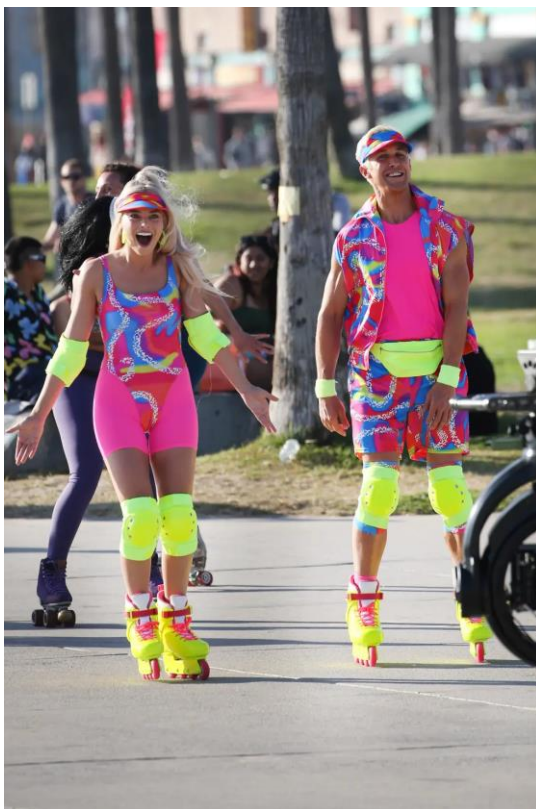
Slika 7.1.7. Barbie i Ken u kostimima za rolanje

Nadalje, njihova odjeća u skladu je s temom, kao i pojedinim scenama u filmu, što ih dodatno karakterizira kao savršene i uvijek spremne za svaku prigodu. Primjerice, Slika 7.1.7. prikazuje to prenaplašeno šarenilo koje vlada filmom i odlikuje ga vrckavošću i ženstvenim žargonom; samim time, na humorističan način stvara neozbiljan pristup temi kojom se bavi.