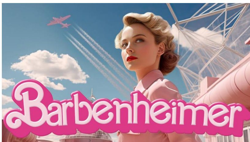
Slika 7.1.15. Isječak filma stvorenog umjetnom inteligencijom na temelju fenomena Barbenheimer

Medijski proizvod vrijedan spomena proizašao iz oba filma jest Barbenheimer ; kulturološki fenomen nastao istovremenim prikazivanjem ovih filmova. Riječ je o spajanju dijelova naslova filmova koji su potaknuli korisnici medija stvarajući različite vrste medijskih sadržaja zbog njihova snažnog kontrasta. 36 Izraz je prvi upotrijebio Matt Neglia, glavni urednik Next Best Picture 37 dok se u javnosti počeo širiti nakon prikazivanja filmova. Počevši od memova, međusobnog poticanja, stvaranja rivalstva kod publike, proizvodnje odjeće na tu temu pa sve do razvijanja ideje za novi film. Slika 7.1.15. prikazuje isječak iz najave filma kreirane uz pomoć umjetne inteligencije. Osmišljavanjem novog sadržaja na ovaj način suprotstavljaju se rodni entiteti. Teško je ipak pretpostaviti znači li to da je suvremeni svijet zasićen razlikama i suprotstavljanjima među rodovima ili je Barbenheimer samo marketinška propaganda i stvaranje medijske senzacije radi privlačenja publike.