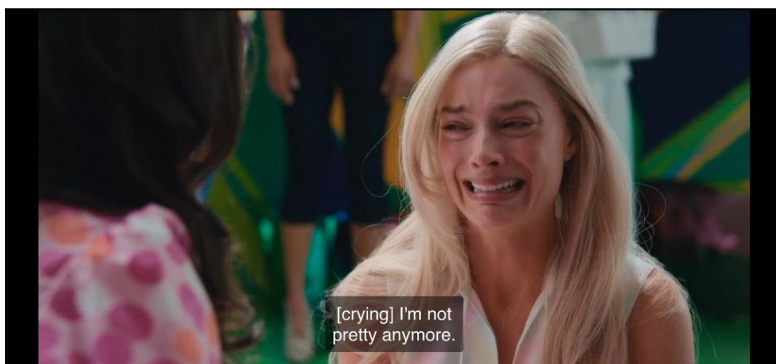
Slika 7.1.6. Primjer iznošenja emocija

Svaku fizičku karakteristiku ovog lika umanjuje ona psihološka, osobito što se tiče Kena. Barbie je okarakterizirana kao strastvena djevojka koja se bori za svoje stavove. Često u promišljanjima otkriva emocije i ne zna se s njima nositi.