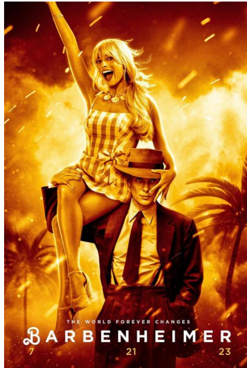
Slika 7.1.166. Barbenheimer meme