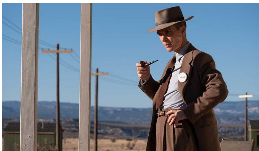
Slika 7.1.8. Fizički prikaz Oppenheimera

Drugačije okolnosti, od onih koje čine Kena nesretnim, u ovom se filmu čine mnogo ozbiljnije. Rat i pitanje moralnosti društvena su tema dok se problemi egzistencijalne krize s kojima se Ken suočavao tiču pojedinca i kao takve ih umanjuju. Lik Oppenheimera i njegovu ozbiljnost dodatno upotpunjuju tamna odijela i modni dodaci poput šešira i kravate, a konstantno mahanje rukama, hod i korištenje cigarete ili lule dokaz su nervoze koje ga čine likom kakav jest, kao i držanje za bokove dok razmišlja.