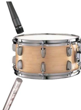
Slika 3.8: Pozicija mikrofona za snare