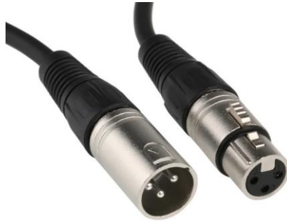
Slika 3.6: XLR kabel

- Spojite XLR kabele na svoj audio interface ili predpojačala. Ako koristite interface s ograničenim brojem ulaza, možda ćete morati odlučiti koji su mikrofoni najvažniji. Uobičajeni pristup je dati prednost kick, snare i overhead mikrofona za osnovnu postavu.