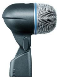
Slika 3.1.: Shure Beta 52A