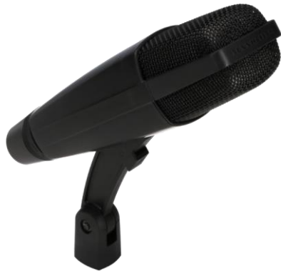
Slika 3.3: Sennheiser MD421

- Vrsta mikrofona: Dinamički (npr. Sennheiser MD421, Audix D2/D4)