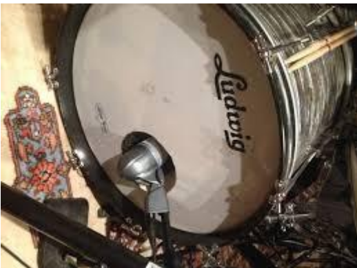
Slika 3.7: Pozicija mikrofona za kick