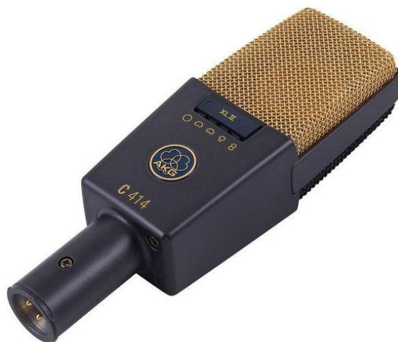
Slika 3.4: AKG C414

- Vrsta mikrofona: Kondenzatorski (npr. AKG C414, Neumann KM184)