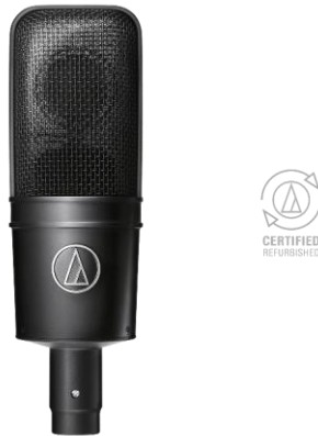
Slika 3.5: Audio-Technica

- Vrsta mikrofona: Kondenzatorski s velikom membranom ili vrpca (npr. Audio-Technica AT4040, Royer R121)