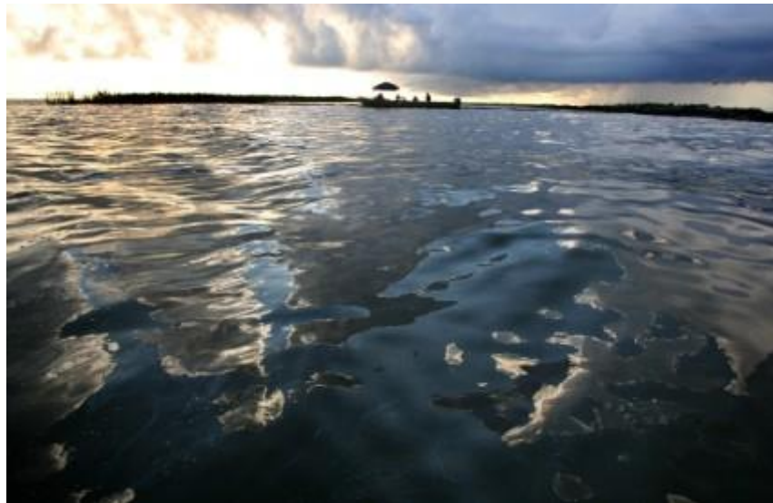
Slika 4. Onečišćenje mora naftom