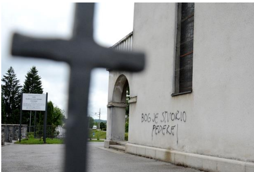
Slika 8. Devastacija nepokretnog spomenika kulture- crkve

Nepokretni spomenici kulture, koji su uglavnom grupirani u gradovima, selima ili manjim mjestima u unutrašnjosti Hrvatske ili pak na otocima, ugrožen su zbog izmijenjenih uvjeta i načina života, kao i gospodarskih i socijalnih prilika. Jedan od razloga propadanja objekata je zapuštenost, a s druge strane izrazita dinamika građenja ugrožava mnoge spomenike, osobito u starim gradskim jezgrama jer ih vlasnici prilagođavaju stambenim potrebama ne vodeći računa o zaštiti spomeničke baštine. Naime, ti se objekti adaptiraju, pregrađuju ili dograđuju ali na način koji ne odgovara povijesti tog objekta i njegovom karakteru.