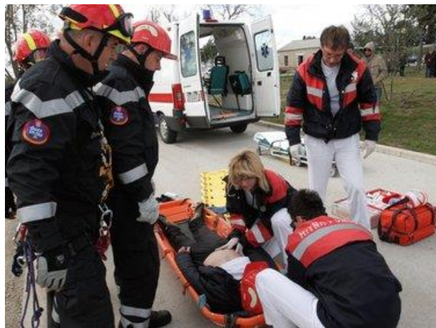
Slika 2. Proces spašavanja Državne uprave za zaštitu i spašavanje