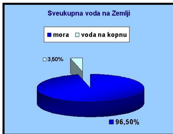
Slika 5. Ukupnost vode na Zemlji

Voda za piće, tj. „slatka voda“, samo je mali dio Zemljinih pričuva vode, jer gotovo 97% sve vode na Zemlji je slano. Strah od nedostatka vode za piće je opravdan, osobito danas kada su podzemne vode često zagađene organskim i kemijskim zagađivačima, koji su nastali kao rezultat čovjekovih aktivnosti (industrijski i gradski otpad). Većina tih zagađivača štetna je za ljudsko zdravlje. Kloriranje je najčešća metoda za dezinfekciju vode za piće, ali pri izboru metode dezinfekcije potrebno je voditi računa o učinkovitosti metode u eliminaciji patogena koji prenose bolesti preko vode, kao što su tifus, kolera, salmonela i druge crijevne bolesti. Biološko ugrožavanje najčešće potječe od živih mikroorganizama (bakterija i virusa).