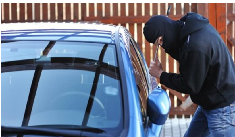
Slika 6. Prikaz krađe stvari iz automobila

Ono što pogoduje činjenju krađa iz i sa vozila je svakako nemarnost ili lakomislenost gostiju jer svoja vozila ne zaključavaju i na taj način predmeti iz vozila postaju laki plijen počinitelja. Također parkiranje vozila izvan naselja, na neosiguranim parkiralištima, ali i na mjestima kao što su: ilegalni kampovi, uzduž prometnica i neosiguranih parkirališta, može biti pogodnost za kradljivce [25, http://visitlosinj.hr/Resources/attachmentsUpload/sigurnost-u-turizmu-prirucnik.pdf , 05.02.2016.].