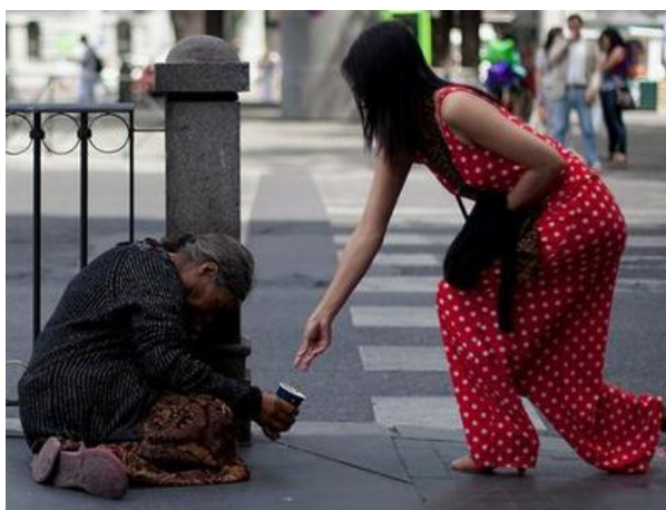
Slika 7. Prosjačenje na ulici

Prosjačenje je česta pojava u turističkoj sezoni i narušava ukupan ugled turističkog odredišta, naselja, objekta, kupališta i slično. Turisti se osjećaju nelagodno i nesigurno s jedne strane, dok s druge strane turisti rado slikaju prosjake te slike objavljuju u medijima uz razne priče koje ne priliče ni jednom turističkom mjestu [33, Matika Dario, Gugić Ante, 2007., 140].