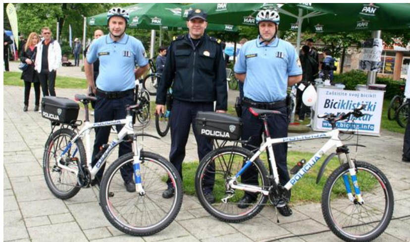
Slika 1. Policijski službenici na biciklima