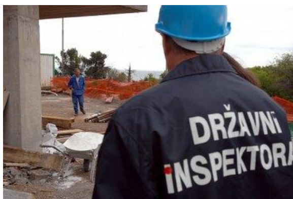
Slika 3. Kontrola državnog inspektorata na gradnji turističkog objekta