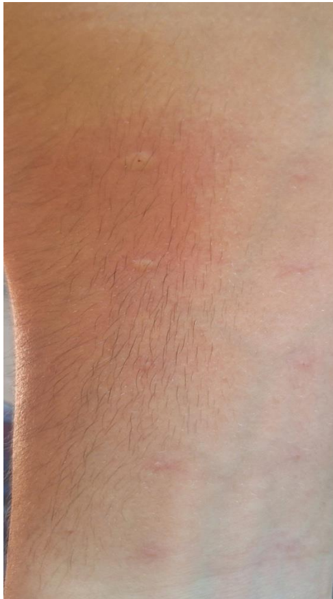
Slika 2.8.1 – Rezultati prik testa