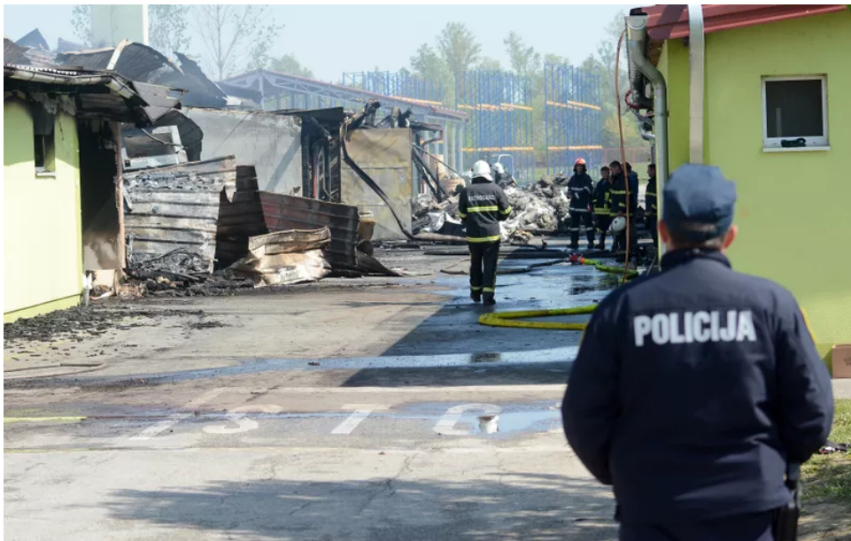
Slika 2 Tvrtka Eko papir nakon požara