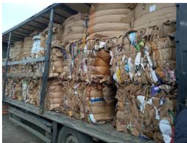
Slika 3 Prešani papir u balama

Budući da su svi proizvodi tvrtke Eko papir sačinjeni od papira ili kombinacije papira i folije, jasno je da se prilikom proizvodnje stvara proizvodni otpad. Kako bi se smanjio negativni utjecaj na okoliš i osiguralo odgovorno gospodarenje otpadom, otpadni papir i folija odvajaju se u preše koje komprimiraju otpadni papir ili foliju u čvrste povezane bale. Te bale se privremeno skladište u skladišnim prostorima tvrtke.