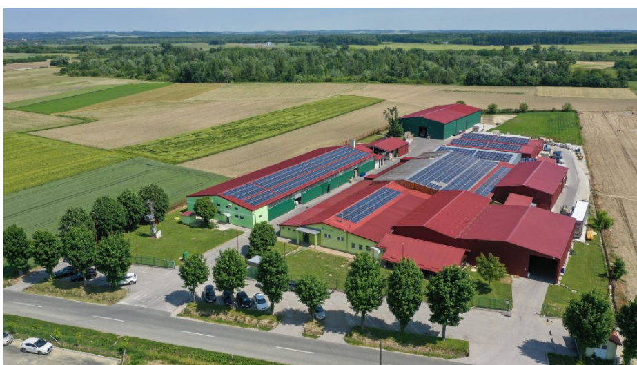
Slika 4 Tvrtka Eko papir prije druge faze postavljanja solarnih panela

U prvoj fazi na krovove tadašnjih proizvodnih hala i skladišta postavljeno je solarnih panela ukupnog kapaciteta od 175 kWh. Ova investicija je u značajnoj mjeri smanjila trošak struje za tvrtku uzeći u obzir da je tada bilo mnogo manje velikih potrošača električne energije. Međutim, stalnim širenjem proizvodnih kapaciteta, gradnjom proizvodnih pogona i kupnjom strojeva, ubrzo je postalo jasno da su potrebni dodatni kapaciteti kako bi se zadovoljile rastuće energetske potrebe.