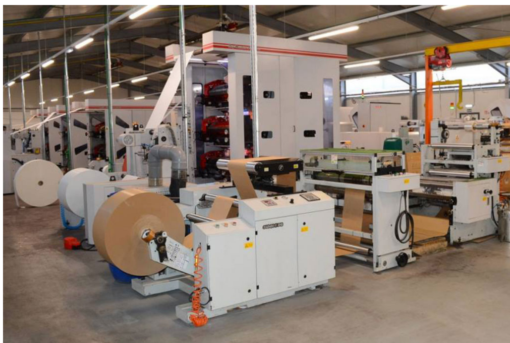
Slika 1 Proizvodni pogon tvrtke Eko papir