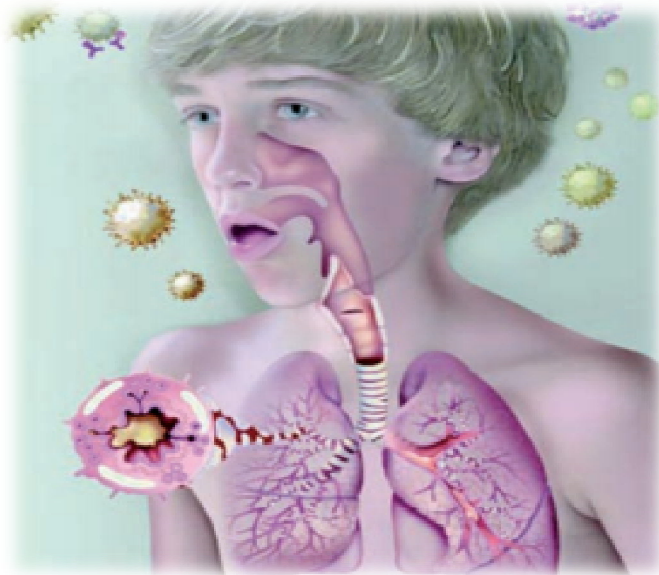
Slika 3.1.1 Osnovni patomehanizam egzacerbacije alergijske astme u djece