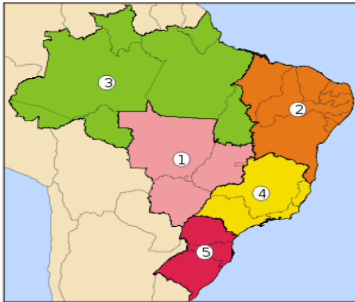
Slika 1: Administrativna podjela Brazila

Ova podjela ima pravni karakter i u svom izvornom obliku predložio ju je 1969. godine Brazilski Institut za geografiju i statistiku ( IBGE ). Osim teritorijalne podjele, IBGE je uzeo u obzir samo prirodne značajke, kao što su klima, topografija, vegetacija i hidrografija, te su regije ponekad poznate kao "Prirodne regije Brazila". Premda određene zakonom, brazilske regije isključivo su zemljopisna podjela, nemaju političko ili administrativno značenje niti bilo kakav posebni oblik vlade. Korisne su uglavnom za statističke svrhe i određivanje primjene saveznih sredstava za razvojne projekte.