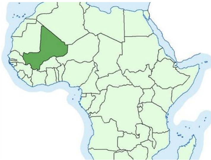
Slika 5 Karta položaja Mali 5

Veći dio zemlje nalazi se na području pustinje Sahare, a manji u Podsaharskoj Africi. Mali je jedna od najsiromašnijih zemalja s BDP-om od oko 900 $ po stanovniku. Gospodarstvo je ovisno o kretanju cijena pamuka i zlata na svjetskom tržištu jer poljoprivreda čini oko 40 % prihoda, a očekuje se da će ga zlato uskoro prestići. Mali je kao i većina država Afrike visoko zadužena, preko 110 % BDP-a. Zlatne rezerve mogle bi biti glavni pokretač novčanih tokova u duljem razdoblju. Izvoz zlata čini oko trećinu ukupnog izvoza. Volumen proizvodnje zlata u zadnjem desetljeću dramatično se povećao te se na taj način servisira vanjski dug. Kako bi se gospodarstvo transformiralo, upravo novčana sredstva dobivena od zlata pomažu u gospodarskim reformama. Ulaže se u razvoj infrastrukture, obrazovanje i daljnji razvoj uvelike ovisi o zlatu.