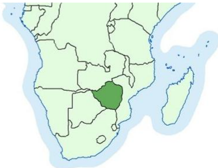
Slika 4 Karta položaja Zimbabve 4

Prema podacima iz 2000. godine Zimbabve je jedna od najsiromašnijih zemalja svijeta. U 2008. godini ostvario je BDP od oko 200 $ po stanovniku, ima stopu nezaposlenosti oko 65 % i 15 % stanovništva oboljelo je od HIV bolesti. Udio poljoprivrede u BDP-u 1990. godine iznosi oko 14 %, a za poljoprivredu je direktno vezano 27 % radno sposobnog stanovništva. U ukupnom izvozu oko 40 % su gotovi proizvodi kao što su tkanine, čelik i drugi metali. Najvažnija izvozna roba je duhan, koji čini više od 20 % ukupnog izvoza. Zlato je na drugom mjestu roba važnih