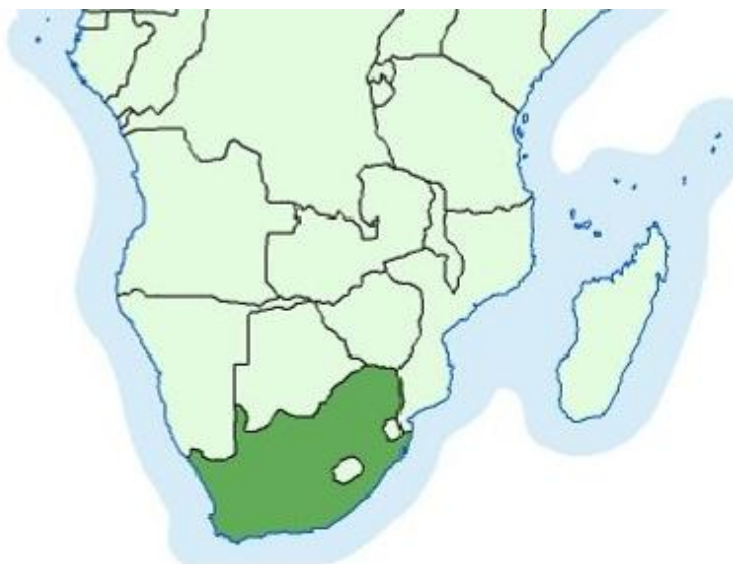
Slika 2 Karta položaja Južnoafričke Republike 2

Iskorištavanje rudnog bogatstva bio je izvor razvoja države i još uvijek ima ključnu ulogu u gospodarstvu. Rudarstvo donosi 8 % BDP-a, od čega je pola direktno od rudarenja zlata i osigurava 37 % ukupnog robnog izvoza u 1998. godini. Osim direktnog doprinosa BDP-u, rudarenje zlata donosi i mnoge neizravne efekte na gospodarstvo.