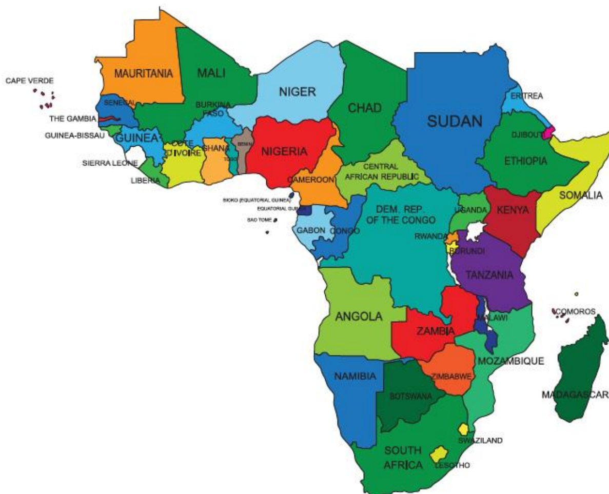
Slika 1. Politička karta Podsaharske Afrike 1

područja, osobito glavni gradovi, su uglavnom bogatiji od ruralnih područja. Nejednakost je izražena u većini afričkih zemalja.