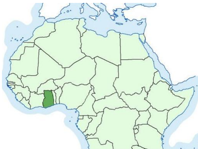
Slika 3 Karta položaja Gane 3

Republika Gana smještena je na sjevernoj obali Gvinejskog zaljeva. Ima oko 25 milijuna stanovnika uz godišnji rast broja stanovništva oko 2 %. Gana je u 2001 godini ostvarila BDP oko 37 milijardi $ te godišnje raste od 3 % do 5 %. U strukturi BDP-a poljoprivreda čini 40 % , uslužni sektor oko 30 % i industrija oko 30 %. Izvoz prirodnih bogatstva je ključna točka gospodarstva. U ukupnim prihodima od izvoza čak 75 % čini izvoz kakaovca, po čemu je vodeća država u svijetu.