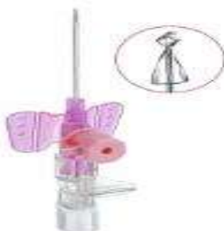
Slika 4.1.3. ( B.Braun Melsungen AG)

Tehničko rješenje nudi bolju zaštitu od uboda iglom i zaštitu od curenja sadržaja iz šuplje igle. Isto tako upotrebljava se samo za aplikaciju terapije, te zbog same izvedbe u proizvodnji cjenovno poskupljuje proizvod.