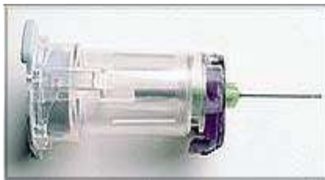
Slika 4.1.4. (Punctur-Guard sistem)

Ova tehnička izvedba na tragu je poboljšanja već postojećeg proizvoda, te je jedno od boljih rješenja za uspostavu perifernog venskog puta. Manipulativno prilikom rada sa takvim iglama nema novih zahtjeva za promjenu same procedure izvođenja medicinsko tehničkog zahvata. Međutim i dalje postoji potreba za neprobojnim kontejnerom, koji se mora nalaziti kod pacijenta u koji se odlažu oštri predmeti – igle. Dostupno odnedavno i u OB Varaždin (sprečava se ubodni incident, ali ne i kapanje zaostale krvi iz šuplje igle).