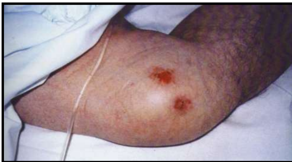
Slika 3.1. Stadij 1. Dekubitalnoga vrijeda na koljenu

Karakteriziran je povećanom temperaturom kože, pojavom svrbeža ili boli na mjestu patofizioloških promjena te crvenilom. [5] (slika 3.1.)