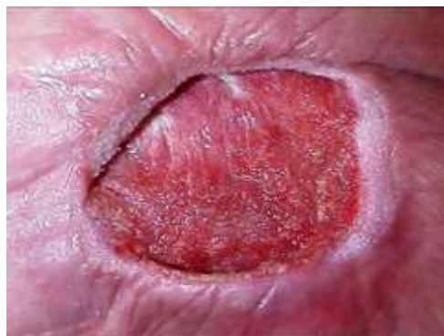
b) izgled rane 15 dana nakon V.A.C.

http://www.vasezdravlje.com/izdanje/clanak/987/1/ pristupljeno 25.4.2015