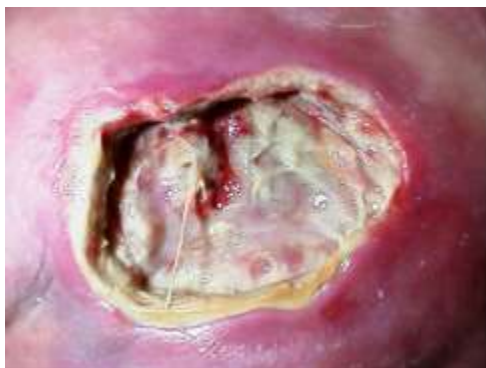
a) izgled rane prije V.A.C. terapije, terapije