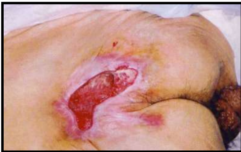
Slika 3.2. Stadij 2. Dekubitusa s torpidnim rubovima i granulacija

Dolazi do stanjenja kože koje zahvaća sve slojeve. U ovom stadiju nastaje površna rana. Karakteriziran je pojavom abrazije, mjehura ili plitkog katetera. Kada dođe do očitih promjena na koži, tada se očekuju i mogo opsežnije promjene na muskulaturi i ovojnicama mišića. [1] (slika 3.2.)