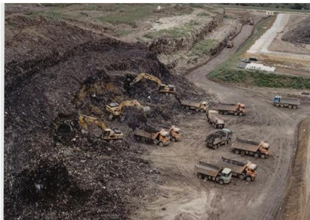
Slika 2.1 Uklanjanje postojećeg otpada

Gradsko poglavarstvo je početkom 1991.g. pokrenulo izradu idejnog rješenja uređenja i zatvaranja smetlišta Jakuševac-Prudinec. Nakon analiza različitih varijantnih rješenja, odabrana je varijanta sanacije na način da se postojeći otpad uklanja (Slika 2.1) i privremeno odlaže na drugom mjestu (na postojećoj lokaciji) dok se nije uredilo slabo propusno dno (temeljni brtveni sustav) na koje će se kasnije ugrađivati prethodno uklonjen otpad. Radi jednostavnosti i što lakšeg usklađivanja spomenutih operacija, odlagalište podijeljeno je u plohe (1 - 6) (vidi prilog), te se po plohama i provodila sanacija.