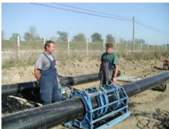
Slika 2.5 Radovi na izvedbi sustava odvodnje procjednih voda

Ploha 6 je u cijelosti izvedena s cijevima promjera 200/175 mm. Ukupna dužina drenažnih cijevi (uključivo i pune cijevi kroz nasip) na plohama 1 do 6 iznosi 6.531 m.