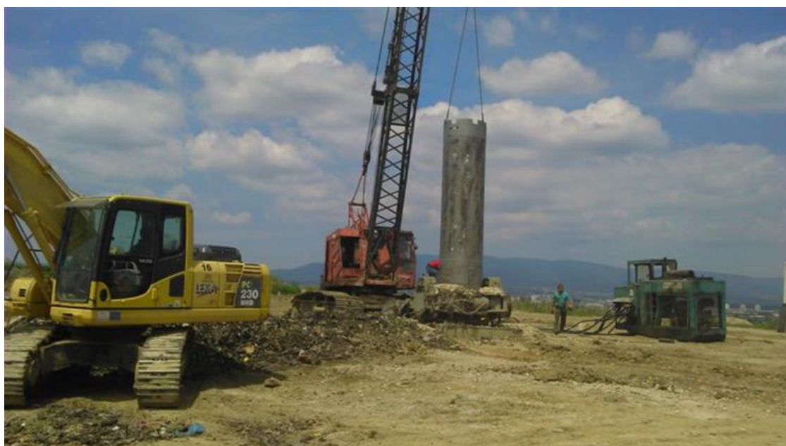
Slika 2.6 Bušenje plinskih zdenaca (Videc, Z. 2015.)

Filteri plinskih zdenaca: slotirane PVC cijevi promjera 160 mm postavljene u filtarske ispune uglavnom od šljunka, minimalnog promjera bušotine od 1200 mm. Vertikalne cijevi plinskih zdenaca: PVC cijevi čvrstih stijenki bez ispupčenja, promjera 160 mm koje se od slotirane cijevi filtra pružaju do gornjeg nivoa (spoja s plinskom glavom, završne kape cijevi).