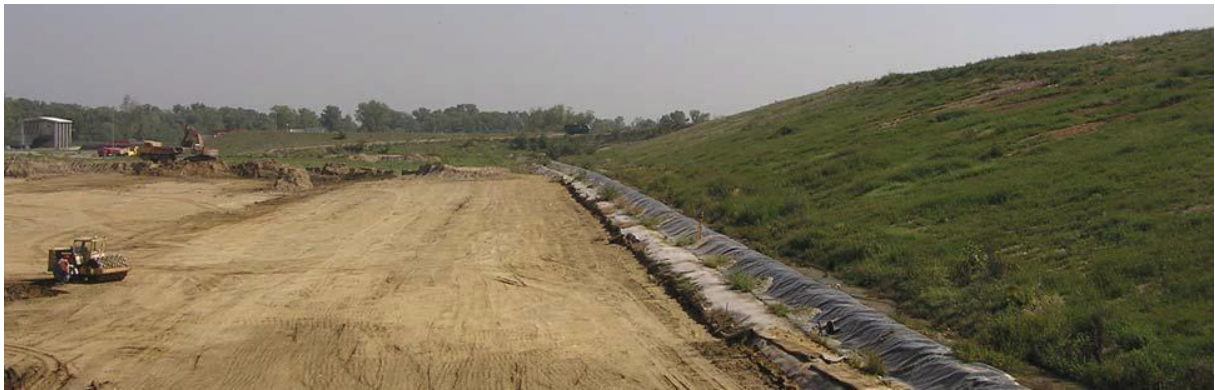
Slika 2.2 Postavljanje temeljnog brtvenog sustava na odlagalištu Jakuševac ( http://www.mzoip.hr/doc/tehnicko-tehnolosko_rjesenje_55.pdf , 2016.)