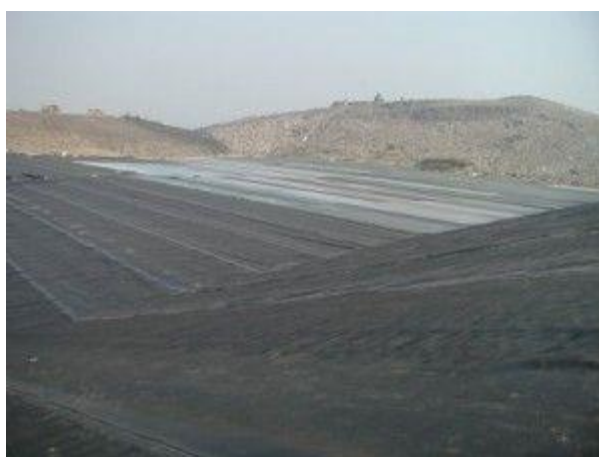
Slika 2.4 Postavljanje geomembrane

Za postavljanje geomembrane (Slika 2.3) korištena je 2,5 mm debela hrapava geomembrana od polietilena visoke gustoće. Ona je postavljena iznad brtvenog sloja od gline na dno radne plohe i uz pokose na dnu plohe. Na geomembranu je postavljen netkan zaštitni geotekstil veće mase po m 2 radi zaštite tijekom postavljanja slojeva za sustav za sakupljanje procjednih voda.