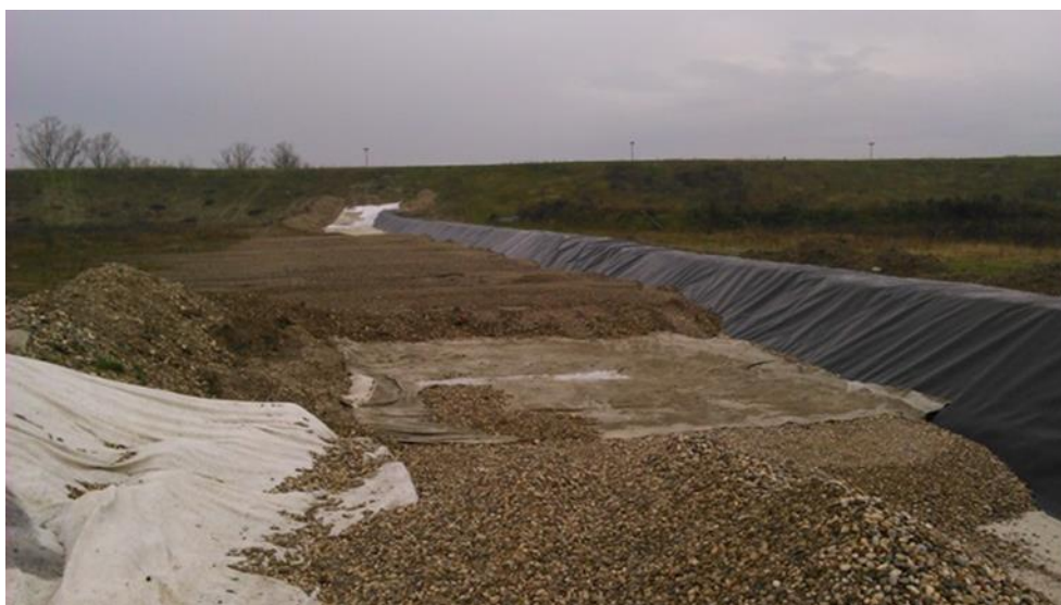
Slika 2.7 Izgradnja međunasipa (Videc,Z. 2015.)

Plohe na kojima se ne odlaže otpad moraju imati odvojenu odvodnju oborinskih voda od ploha na kojima se odlaže otpad, kod kojih se procjedne vode odводе u sustav procjednih voda. Međunasipi (zečji nasipi) su izvedeni između ploha odlagališta određenih projektom. Nožica pokosa tijela otpada mora biti udaljena minimalno 10 m od osi krune međunasipa.