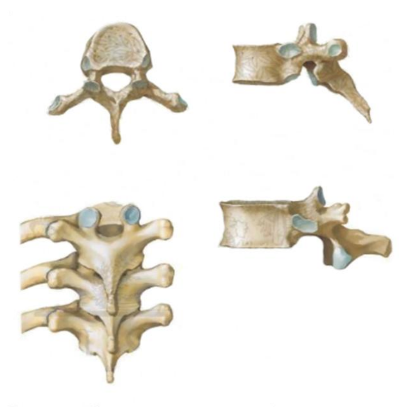
Slika 2.1.1 Torakalni kralješci

Metamerna raščlanjenost organizma u najvećoj je mjeri održana u grudnom dijelu pa je tu i diferencijacija koštanih segmenata najbolje izražena. Na prsnom kralješku ( vertebra thoracica ) razlikujemo trup ( corpus vertebrae ) i luk ( arcus vertebralis ). Trup se nalazi sprijeda, predstavlja najmasivniji i ujedno najvoluminozniji dio kosti, a građen je pretežno od spongiozne koštane tvari. Gornja i donja terminalna ploha ravne su i imaju donekle trokutast oblik, što je prikazano na slici 2.1.1. Prednja je strana u poprečnom smjeru konveksna, a u vertikalnom konkavna. Slična su izgleda i lateralne površine. Na njima se ističu po dvije male udubljene zglobne plohe za artikulaciju s rebrima: uz gornji rub leži fovea costalis superior , a uz donji fovea costalis inferior . Stražnja strana trupa poprečno je konkavna.