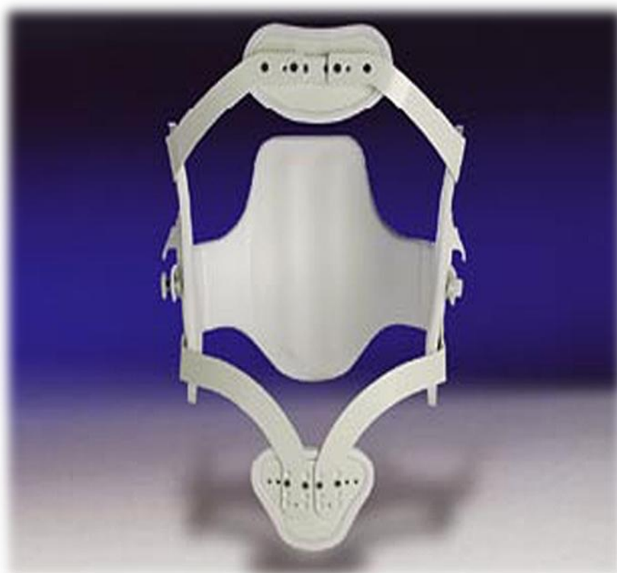
Slika 6.3.2.1 Hiperekstenzijska ortoza s okvirom

Drugi postoperativni dan pacijenti se mobiliziraju uz vanjsku rasterećujuću ortožu. Pacijenta treba upozoriti na mogućnost vrtočlavlave prilikom ustajanja iz kreveta. Samostalno obavlja osobnu higijenu i fiziološke funkcije. Prsno-slabinske ortože konstruirane su tako da budu što ugodnije i da omogućavaju održavanje osobne higijene.