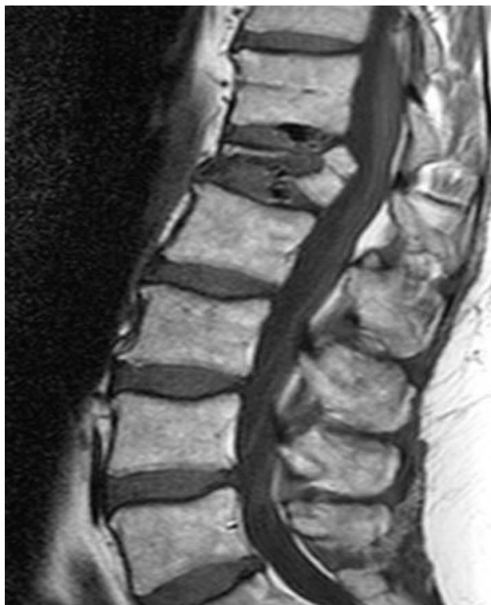
Slika 4.1.1 Magnetna rezonancija prijeloma dvanaestog torakalnog kralješka