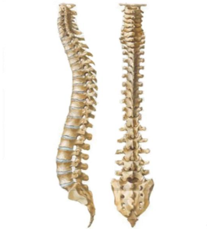
Slika 2.1. Kralježnica

Kralježnicu tvore 33 ili 34 kralješka i to: 7 vratnih ( vertebrae cervicales ), 12 prsnih ( vertebrae thoracicae ), 5 slabinskih ( vertebrae lumbales ), 5 križnih i na donjem kraju 4-5 trtičnih kralježaka ( vertebrae coccygeae ). Sastav je izražen formulom 7C-12Th-5L-5S-4(5)Co. Prema tome se u kralježnici može razlikovati pet odsječaka: vratni, prsni, slabinski, križni i trtični.