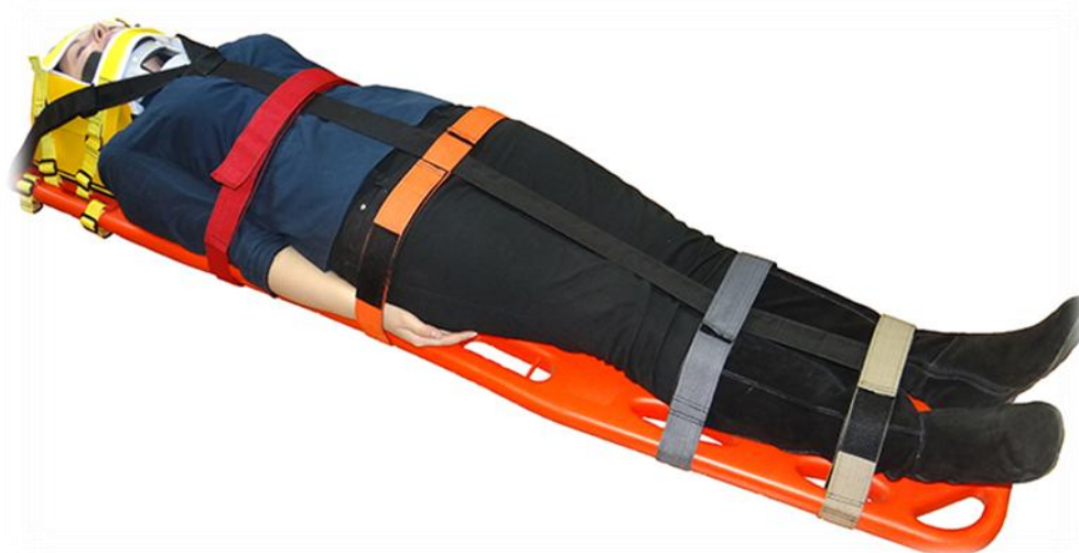
Slika 3.1.1 Imobilizacija kralježnice

Imobilizacija kralježnice započinje ručnom stabilizacijom vratne kralježnice, a nastavlja se postavljanjem ovratnika za imobilizaciju i drugih sredstva za imobilizaciju. Prije postavljanja ovratnika treba pogledati cijeli vrat jer je nakon postavljanja otežana inspekcija i palpacija tog područja. Ovratnik za imobilizaciju vratne kralježnice podupire glavu i vrat te održava neutralan položaj vratne kralježnice i podsjeća pacijenta da ne miče glavu i vrat. Imobilizacija kralježnice nije potpuna dok pacijent nije učvršćen na dugoj dasci. Prije postavljanja pacijenta na dugu dasku potrebno ga je okrenuti na bok, a dugu dasku postaviti paralelno uz ozlijeđenog. Dok je ozlijeđenik na boku i licem prema medicinskom osoblju, pregledava se stražnji dio leđa i stražnjica kako bi se uočile moguće ozljede. Ozlijeđenog je potrebno učvrstiti na dasci za imobilizaciju pomoću traka, pojasa ili zavoja postavljajući iste preko koštanih izbočenja ramena, zdjelice i gležnjeva. Ovakav način imobilizacije indiciran je najčešće kod ozlijeđenika u ležećem položaju ili prilikom brzog izvlačenja pacijenta, što je prikazano na slici 3.1.1.