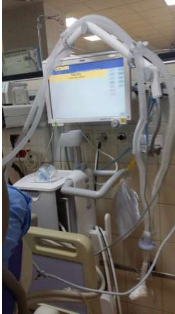
slika 2.1. Prikaz aparata za mehaničku ventilaciju; Autor: S.N]

Mehanička ventilacija je važna i neophodna u liječenju kritičnih pacijenata. Ona može u potpunosti ili djelomično zamijeniti prirodnu funkciju pluća. Prvi aparati su napravljeni 1928.godine, ali veliki napredak se vidi tek zadnjih desetljeća. U početku nisu imali mogućnosti puno funkcija, a danas su to prava računala koja se mogu podesiti prema svakom pacijentu ovisno o dobi, spolu, patogenezi. Cilj im je osigurati optimalne respiracijske parametre i što bolju oksigenaciju i eliminaciju CO 2 . Prvi ventilatori su radili na principu nastanka negativnog tlaka u plućima i usisavanja zraka u dišne puteve, a danas rade na principu upuhivanja plinova u dišne putove pozitivnog tlaka.