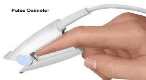
Slika 4.3.2.1 Prikaz pulsno oksimetra

Senzor se postavlja na vrhove prstiju kao što prikazuje slika 4.3.2.1 rijetko na uški ili nosu. Stavljajući se na golu kožu te je potrebno ukloniti lak za nokte, umjetne nokte, šminku i naušnice. Potrebno je provjeriti stanje kože i cirkulaciju te promijeniti mjesto na kojem se senzor nalazi svaka četiri sata za prst te svakih sat za uho. [5]