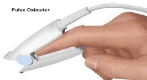
Slika 4.3.2.1 Prikaz pulsno oksimetra

Senzor se postavlja na vrhove prstiju kao što prikazuje slika 4.3.2.1 rijetko na uški ili nosu. Stavljajući se na golu kožu te je potrebno ukloniti lak za nokte, umjetne nokte, šminku i naušnice. Potrebno je provjeriti stanje kože i cirkulaciju te promijeniti mjesto na kojem se senzor nalazi svaka četiri sata za prst te svakih sat za uho. [5]