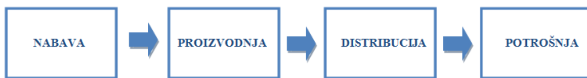
Slika 1.: Faze opskrbnog lanca

Svaka od navedenih faza uključuje različite subjekte odnosno nositelje funkcija pojedine faze na čijim se interakcijama zasniva opskrbeni lanac: 3