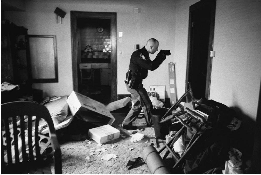
Slika 10.7. Anthony Seau, World press photo 2009.

Detektiv Robert Kole iz Clevelanda u Ohio-u provjerava kuću u procesu deložacije. Mora biti siguran da su vlasnici napustili prostorije i da u njoj ne postoji nikakvo oružje. Policija ulazi s usmjerenim pištoljima kako bi poštivali mjere sigurnosti jer su mnoge takve kuće uništenje i u njima se sakupljaju narkomani. Krajem 2007. godine, zbog propadanja američkih banaka, rate hipotekarnih kredita počele su naglo rasti. U prvim mjesecima 2008. godine, rast kamatnih stopa, zajedno s povećanjem nezaposlenosti i usporavanja na tržištu nekretnina, značilo je da mnogi više nisu mogli priuštiti plaćanje kredita na vlastite kuće. U sljedećim mjesecima, financijska kriza proširila se diljem svijeta.