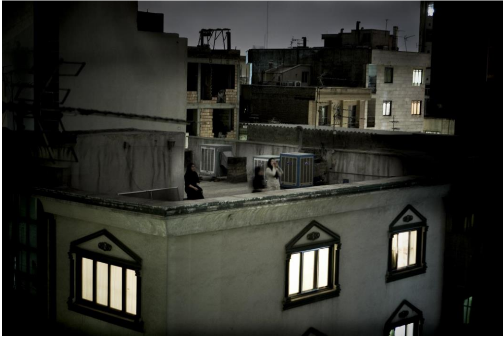
Slika 10.6. Pietro Masturzo, World press photo 2010.

Skupina žena, u gradu Theran, viču s krova u znak neslaganja nakon spornih iranskih predsjedničkih izbora u kojima je pobijedio Mahmud Ahmadinežad. Tjednima nakon izbora, na ulicama su se održavali nasilni prosvjedi. Noćima su se pobornici drugog predsjedničkog kandidata, Musavija, penjali na krovove i izražavali svoje nezadovoljstvo. Nakon dnevnih demonstracija, tišinu su kvarili su uzvici poput „Allahu Akbar!“ i „Smrt diktatoru!“. Takvi prosvjedi podsjećali su na proteste tokom islamske revolucije 1979. godine.