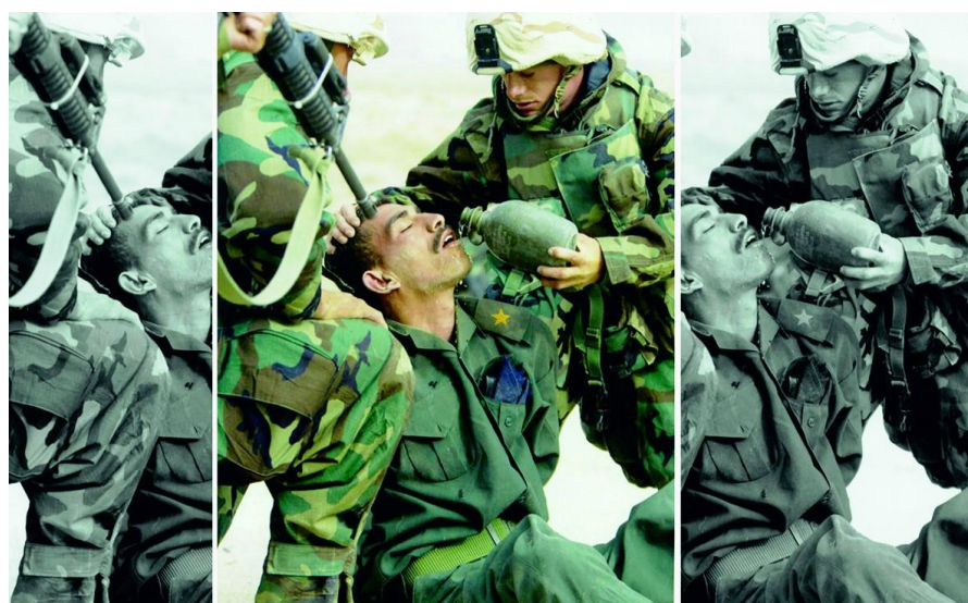
Slika 7.3. Različiti prikazi istog događaja

Gotovo da ne postoje ograničenja što se može primijeniti ili promijeniti na slici. Pitanje je samo, kada potraga za estetikom i originalnošću krši etiku?