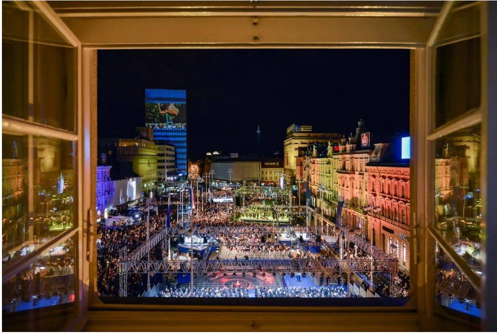
Slika 9.2.2. Neja Markičević, Hrvatska novinska fotografija 2013.

U Zagrebu, na Trgu Bana Jelačića, održana je središnja proslava povodom priključivanja Republike Hrvatske Europskoj uniji. Fotografija snimljena iz zgrade Zagrebačke banke, autorice Neje Markičević, proglašena je najboljom novinskom fotografijom 2013. godine.