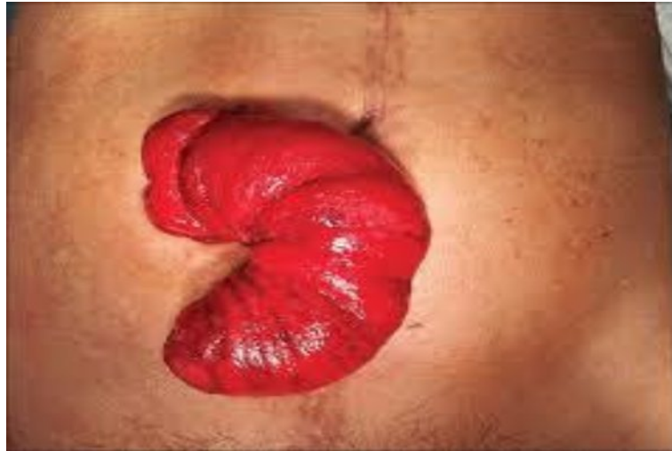
Slika 7.2. Prikaz prolapsa stome

Prolaps kolostome je predstavlja ispadanje svih slojeva crijeva kroz otvor stome što se vidi na slici 7.2. Nastaje zbog povećanja intraabdominalnog tlaka ili samog otvora stome. Uloga medicinske sestre je da prepozna stanje i obavijesti liječnika. Stanje najčešće zahtjeva korekcijski operativni zahvat. Svaka intervencija oko samog crijeva treba biti osobito pažljiva kako se crijevo ne bi ozljedilo.[6]