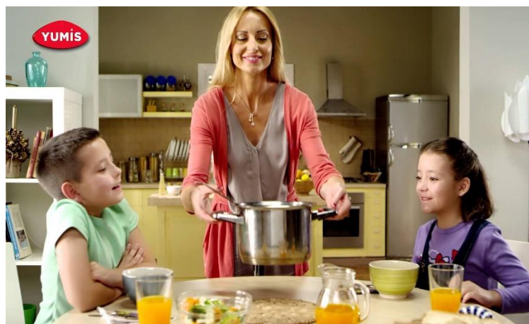
Slika 4.3.5 Žena u ulozi domaćice i majke

Ako nije prikazana kao seks simbol, žena koja poziva na seks i želi udovoljiti muškarcu, onda je prikazana kao kućanica i majka. U toj ulozi nema ništa lošeg, dapače, svi znaju kako je ta uloga žene vrlo zahtjevna. No, ukoliko je to jedini prikaz žene, umanjuju se njene ostale kvalitete i sposobnosti jer je ustaljeno mišljenje kako dobra majka i kućanica ne može biti i uspješna u poslovnoj karijeri. S druge pak strane, sjetimo se reklama prikaza uspješnog poslovnog muškarca koji nakon napornog dana svoje vrijeme posvećuje obitelji. Muškarac može biti dobar radnik i obiteljski čovjek, a žena ne može.