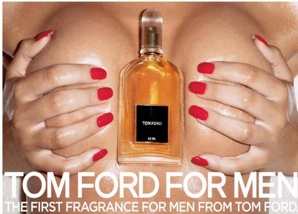
Slika 4.3.2 Privlačenje muških potrošača izazovnom slikom ženskog tijela

Reklame koje služe isključivo za muške potrošače gotovo uvijek koriste eksplicitan ženski lik. Neke reklame idu toliko daleko da ne prikazuju cijelu žensku osobu, već samo određeni dio tijela. Često je puta riječ o ženskim grudima, stražnjici i sl.