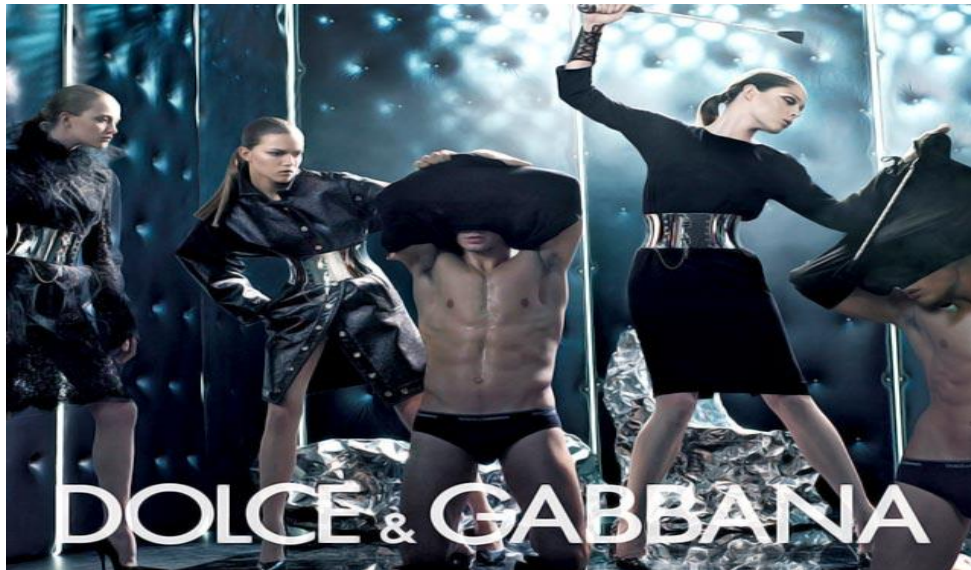
Slika 4.3.4 Ženska dominacija nad muškarcima ( www.mandatory.com )

Ista modna kuća napravila je kampanju u kojoj je zamijenila uloge koje su nam stereotipi dodijelili i to onda izgleda ovako: