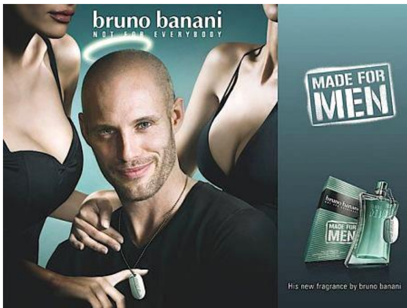
Slika 4.3.1 Ženski lik i dio tijela u odnosu na muški

Podređenost ženskog lika u odnosu na muški, odnosno muška dominacija, kao i korištenje ženskog tijela s ciljem što veće prodaje, vidi se jasno, a možda i najbolje u reklamama.