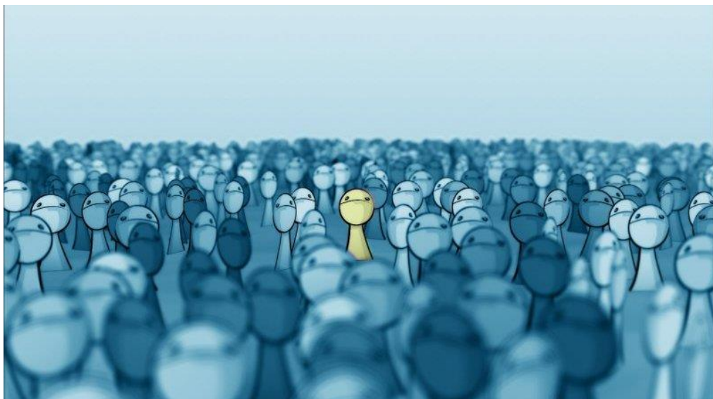
Slika 3.1 Konformiranje – želja da budemo dio mase

Konformiranje ne mora biti stalno već može zavisti o potrebama, ciljevima ili željama. Npr.: osoba može prihvatiti tuđe mišljenje i prezentirati ga kao da vlastito (iako se u suštini ne slaže s njim) samo u određenom trenutku ili situaciji, odnosno kada joj to najbolje odgovara.