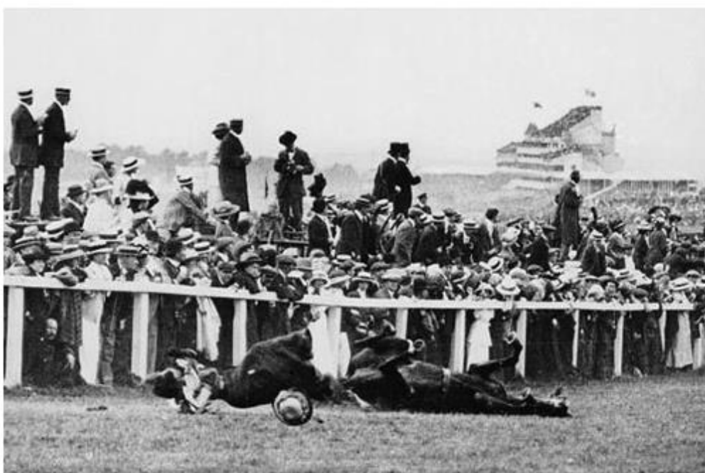
Slika 4.1. Pogibija Emily Davison

Sufražetkinje su poznate po svom nasilnom i radikalnom djelovanju, a u njihovom pokretu zabilježen je niz incidenata. Kao najradikalniji primjer ističe se onaj Emily Davison iz Velike Britanije koja je na konjskoj utrci iskočila ispred kraljevih kola te bila nasmrt pregažena, kao što prikazuje Slika 4.1.