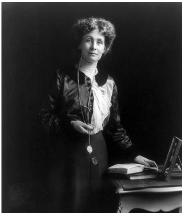
Slika 4.4. Emmeline Pankhurst

od najistaknutijih lica i vođa britanskog pokreta sufražetkinja bila je Emmeline Pankhursts. Poznata britanska sufražetkinja prikazana je na Slici 4.4.