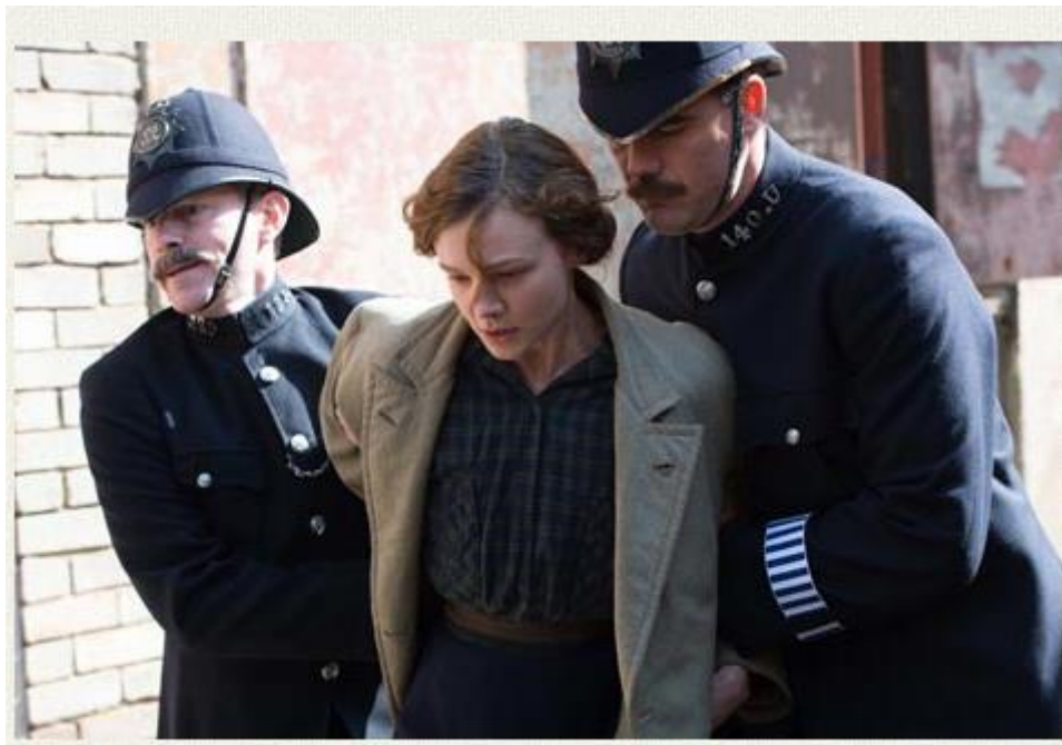
Slika 4.5. Film Suffragette

Ne samo da misli da ga supruga na poslu i u susjedstvu sramoti, nego i smatra da je Maud kao žena njegovo vlasništvo te mora izvršavati njegove želje. 59 Slika 4.5. prikazuje isječak iz filma.