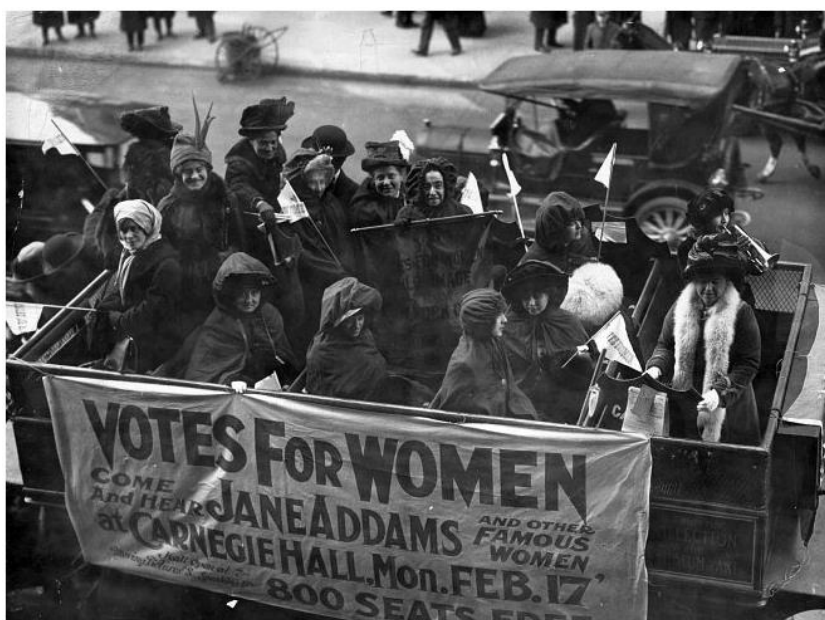
Slika 4.3. Prosvjed sufražetkinja

čak i prije nego što je sufražetski pokret bio obilježen vandalizmom. U jednom od svojih članaka The Times navodi kako su sufražetkinje žalosni nusprodukt naše civilizacije, sa svojim čekićima i torbama punim kamenja, a zbog svojih sumornih i praznih života prekomjerno su razdražljive prirode. Nisu ipak sve novine zastupale takav stav prema sufražetkinjama i sufražetskom pokretu. Kada njihove aktivnosti nisu uključivale nasilne metode, bilo je slučajeva i da su ih podržavali u nekim novinama. U situacijama kada su se reakcije policije činile nepotrebno nasilne ili neprimjerene (kao na „Crni petak“), novine poput Daily Mirrora, izvijestile su o incidentima i objavile nekoliko fotografija. Časopis Punch općenito je podupirao pravo glasa za žene te su isticali da je liberalna vlada učinila loš posao u rješavanju problema. Iako su bile kritične prema nasilnim metodama, novine su ipak sufražetkinjama pružile ono što su željele – publicitet! Slika 4.3. prikazuje prosvjed sufražetkinja.