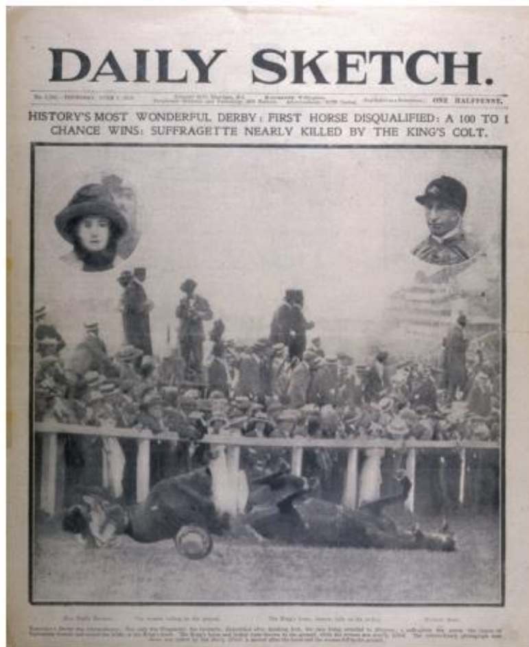
Slika 4.2. Naslovnica novina Daily Sketch o smrti Emily Davison

žene dobiju pravo glasa. Na Slici 4.2. prikazana je naslovnica novina Daily Sketch od 8. lipnja 1913. godine.