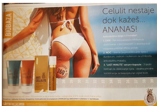
Slika 4.7. Primjer oglasa u časopisima, časopis Story

istraživanju koje su proveli 71% žena potvrdilo je da je koža čvršća i zategnutija, a 67% da je celulit manje vidljiv. 35