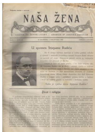
Slika 3.3. Tjednik Naša žena

Godine 1953. pokrenuta je modna revija, novi list namijenjen prvenstveno ženskom čitateljstvu, nazvan Svijet. Časopis se bavio praćenjem mode, kozmetike, kazališta, filma i romana. Prvih desetak godina izlazio je kao mjesečnik, a 1963. godine pod uredništvom Mire Gumhalter postaje dvotjednik. Pokrenut je u okviru izdavačkog poduzeća Vjesnik. Sedamdesetih godina Svijet je bio jedina ženska revija u Hrvatskoj. Usprkos pokušajima moderniziranja i prilagođavanja novim okolnostima, godine 1992. prekinut je kontinuitet izlaženja, a revija izlazi pod istim naslovom kao povremeni nedjeljni dodatak Jutarnjem listu. 20