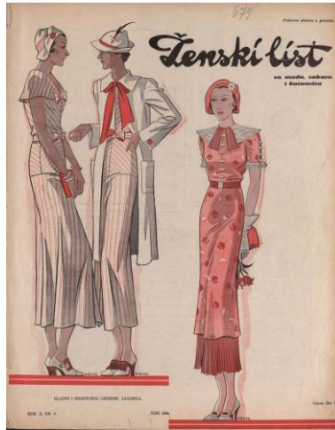
Slika 3.2. Časopis Ženski list , dnc.nsk.hr

Nakon odlaska Marije Jurić Zagorka i dolaska novog uredništva, Ženski list mijenja ime u Hrvatski ženski list. Zagorka je listu dala snažan osobni biljeg uspostavljajući brižan odnos s publikom – čitajući i odgovarajući na pisma. 18