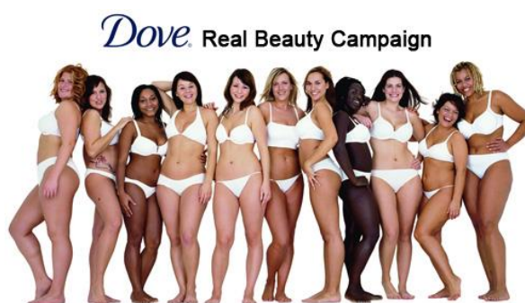
Slika 4.1. Dove kampanja prirodne ljepote, marketingmreza.rs

produkcijske manevre. Prema podacima tamošnjeg Ministarstva zdravlja do 40.000 Francuza boluje od anoreksije, s tim da je u 90% slučajeva riječ o ženama. Novčana kazna koju će modne agencije dobiti ukoliko se ne budu pridržavale zakona iznosit će 75.000 eura, koja može biti zamijenjena kaznom zatvora do šest mjeseci. Istodobno, sasvim suprotan primjer nalazimo u Dove kampanji. Oni su se među prvima u svijetu počeli baviti plus size modelima, a svojom kampanjom nastoje „srušiti“ predrasude o tome kako modeli moraju biti mršavi ili u najgorem slučaju anoreksični. Svaka „punija“ osoba mogla je prošetati pistom na isti način kao i „mršava“ i osjećati se jednako vrijednom. Najveći razlog pokretanja takve kampanje bio je smanjenje bulimije i anoreksije kod žena. Dove je ujedno i promovirao reklamu i oglašavao se u ženskim časopisima u kojima su djevojke svih rasa, visina i težina jednako prezentirane svijetu, dajući veoma jaku poruku o tome kako treba stati na kraj predrasudama.