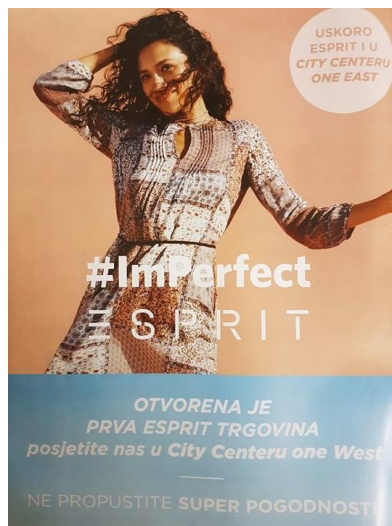
Slika 4.4. Espritova kampanja #ImPerfect, časopis Story

Časopis Story u ovom broju najviše pažnje posvećuje osobama s javne društvene scene, pišući o njihovim aferama i životnim navikama. Rubrika „party“ prikazuje slike slavnih s raznih događanja koja su se odvijala u Zagrebu. Na tim stranicama prevladavaju fotografije dok je u tekstu navedeno samo ime i prezime osobe koja se nalazi na slici. Nezaobilazni atributi koji stoje uz fotografije poznatih osoba su: „Najbolje društvo“, „Prave Cosmo cure“, „Šarmantne dame“, „Bezvremenska elegancija“. Ovog mjeseca Story i rubrika „moda“ darovali su kupone od 30% popusta u odabranim prodavaonicama. Odjeća za koju se mogao iskoristiti popust zapravo je preskupa za „obične građane“ jer si rijetko tko može priuštiti Hilfiger denim baloner u iznosu od 1.509,00 kuna ili Guess Marciano košulju u iznosu od 1.240,00 kuna. Primjetno je da se u časopisu najčešće prikazuju ženska odjeća, obuća i modni dodatci dok je muškarcima posvećena tek stranica ili dvije.