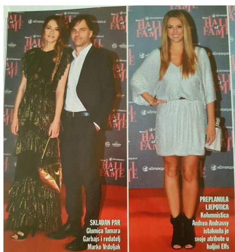
Slika 4.10. Primjer atributa dodanih poznatima, časopis Story