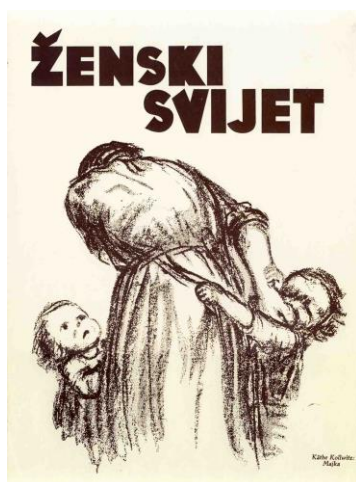
Slika 3.1. Časopis Ženski svijet

Godine 1917. u Zagrebu je pokrenut Ženski svijet , koji je u studenom 1918. godine promijenio ime u Jugoslavenska žena , čime je iskazao podršku uredništva ujedinjenju Južnih Slavena i nastanku nove države. Autori(ce) priloga objavljivanih u listu potjecali su iz raznih dijelova nove države, a u tekstovima je prevladavao esejistički stil posvećen angažiranim raspravama o ženskim političkim pitanjima. Majčinstvo, obitelj i ženska svakodnevnica prisutne su u listu, a budući da su ciljane publika bile intelektualke, upravo se „nova žena“ – obrazovana, jugoslavenski orijentirana i osviještena – prikazuje kao idealna žena. 17