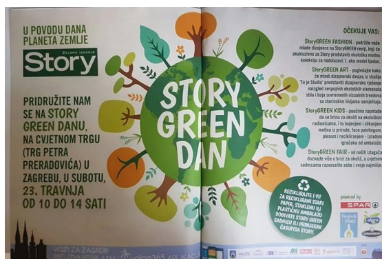
Slika 4.5. Story Green dan na 100% recikliranom papiru, časopis Story

špinatom Jamiea Olivera), a nezaobilazni su i proteinski napitci koji se mogu kupiti u bilo kojoj trgovini.