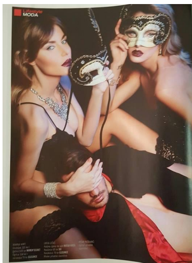
Slika 4.9. Uvodna stranica u Story Hall of Fame party, časopis Story