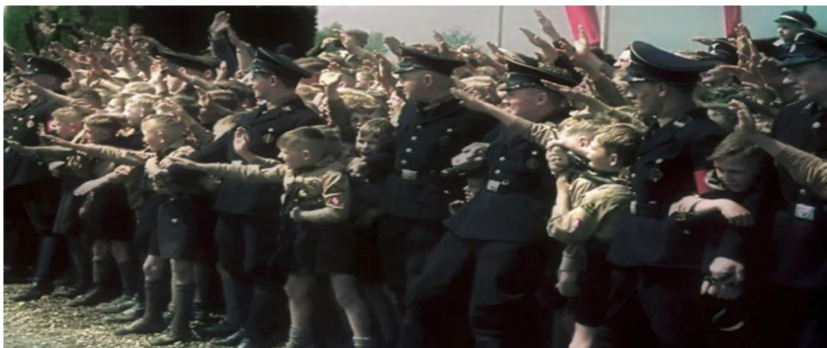
Slika 4. Vojnici pokušavaju zadržati svjetinu da ne preriječi put Hitlerovom automobilu.

Efekt kompozicije vlaka , kako ga naziva Šaran, sličan je instinktu krda. Ovdje nije samo riječ o ponašanju, već dolazi i do promijene vjerovanja, dakle mogli bi smo reći da su ti ljudi jednostavno bili indoktrinirani, te su prihvatili nacističke ciljeve kao svoje, u tolikoj mjeri da neki (živi) Nijemci još i danas vjeruju da je Hitlerovo „učenje“ bilo sasvim opravdano. (Šaran, www.matrixworldhr.com , 2016b).