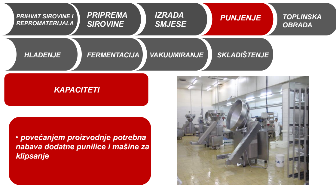
Slika 3.3 Opis proizvodnog procesa - punjenje [7]