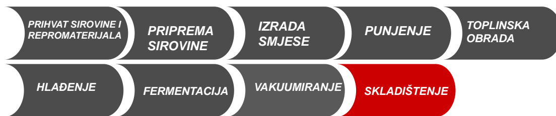
Hladnjača i skladištenje