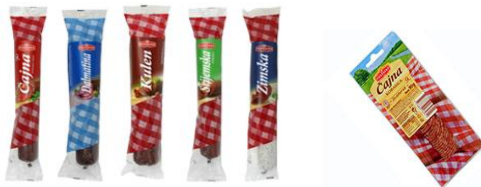
Slika 4.1 „Flow pack“ pakiranje i „Slice“ pakiranje [7]

Terminom „novi proizvod“ podrazumijevamo nove proizvode, poboljšanja proizvoda, modifikacije proizvoda i nove marke proizvoda koje neko poduzeće razvija za određeno tržište. Razvoj proizvoda može se odvijati u dva osnovna oblika: poduzeće može provoditi vlastiti razvoj novog proizvoda, djelovanjem vlastitog odjela za istraživanje i razvoj ili poduzeće može kroz outsourcing/ugovorom kojim se unajmljuju instituti, samostalni istraživači, agencije. Firma je spremna razviti nove proizvode nakon što je pažljivo segmentirala tržište, odabrala ciljne kupce, identificirala njihove potrebe i odredila željenu tržišnu poziciju. Trendovi na tržištu odnose se na promjene pakiranja gdje je sve veća tendencija „slice“ pakiranih proizvoda i proizvoda u „flow pack“ pakiranju (Slika 7.1) kao i darfresh pakiranje.