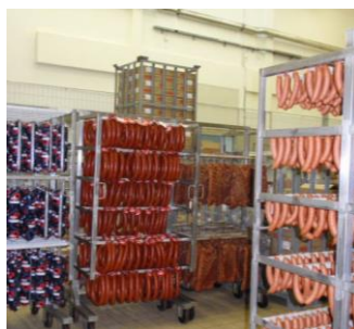
Ekspedit i skladištenje