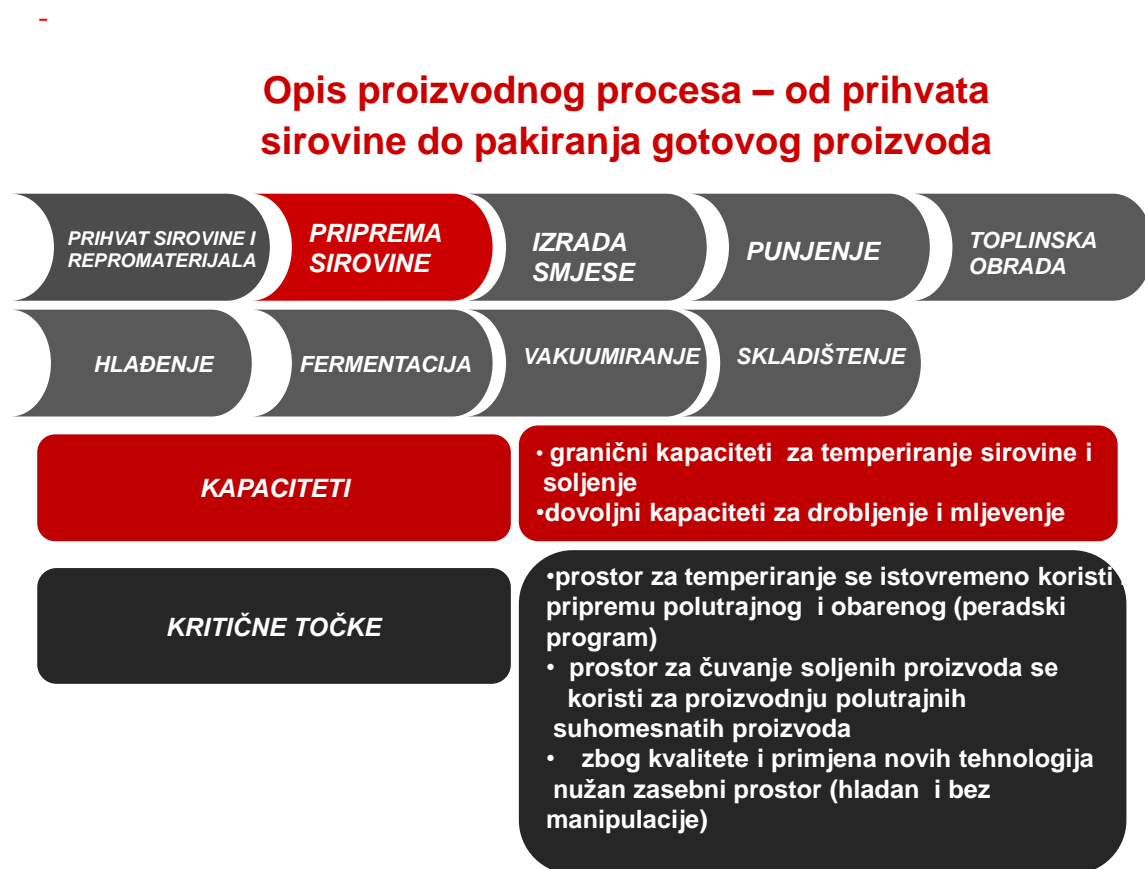
Slika 3.1 Opis proizvodnog procesa - priprema sirovine [7]

U fazi pripreme sirovine, mesni sastojci se usitnjavaju i važu prema radnoj recepturi, nemesni sastojci se važu prema radnoj recepturi za začine i aditive. U skladu s radnim uputama odvaguje se nadjev i priprema za izradu zamjesa. Prilikom odvage popunjava se lista kontrole odvage aditiva. Slika 3.1 prikazuje fazu proizvodnog procesa pripreme sirovine sa kapacitetima i kritičnim točkama u toj fazi.