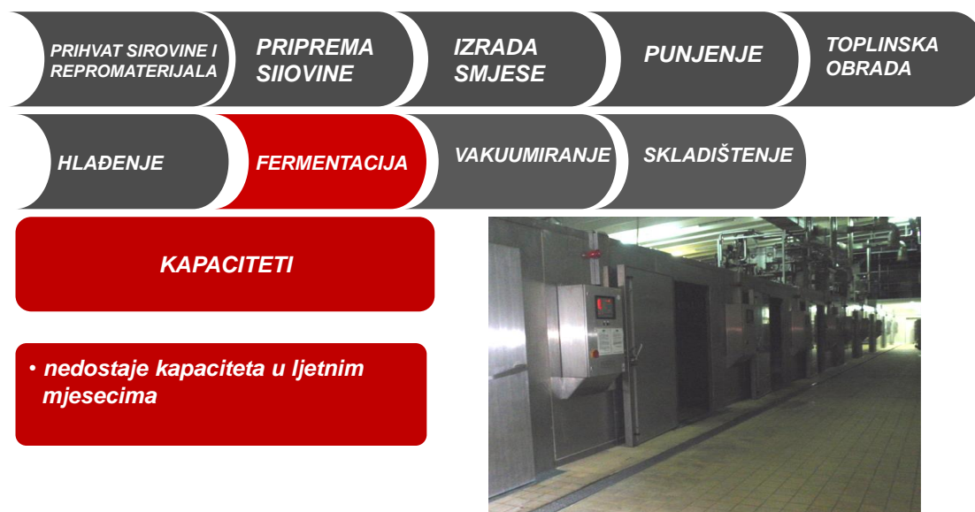
Slika 3.5 Opis proizvodnog procesa - fermentacija [7]