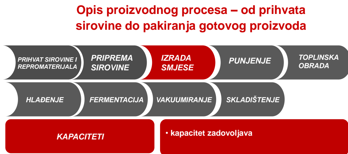
Slika 3.2 Opis proizvodnog procesa - izrada smjese [7]

U kuteru se izrađuje smjesa sa svim odvaženim komponentama prema radnoj uputi. Prema planu samokontrole uzorkuje se i mikrobiološki analizira zamjes, ali se proces proizvodnje ne zaustavlja. To je naknadni pokazatelj za slučaj da gotov proizvod nije ispravan, u kojoj fazi proizvodnje je došlo do neispravnosti proizvoda. U fazi izrade zamjesa nema problema. Slika 3.2 prikazuje fazu izrade smjese u proizvodnom procesu.