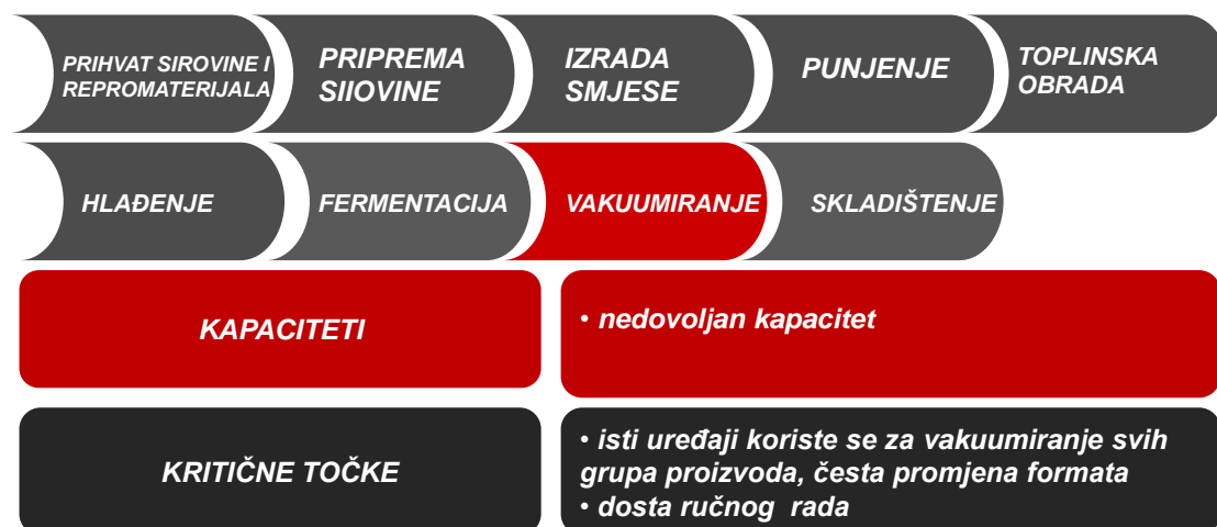
Slika 3.6 Opis proizvodnog procesa - vakuumiranje [7]

Ocjena postojećeg stanja prema kriteriju iskoristivosti kapaciteta proizvodnje u završnoj fazi mjereno u postocima (%).