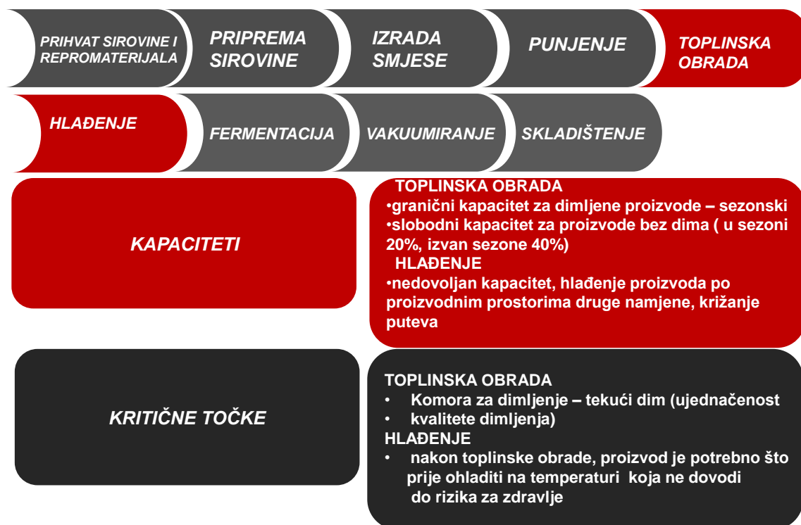
Slika 3.4 Opis proizvodnog procesa - toplinska obrada i hlađenje [7]