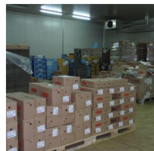
Slika 3.7 Opis proizvodnog procesa - skladištenje [7]

Ocjena postojećeg stanja prema kriteriju učešća adekvatnog skladišnog prostora u odnosu na ukupno korišteni skladišni prostor mjereno u postocima (%).