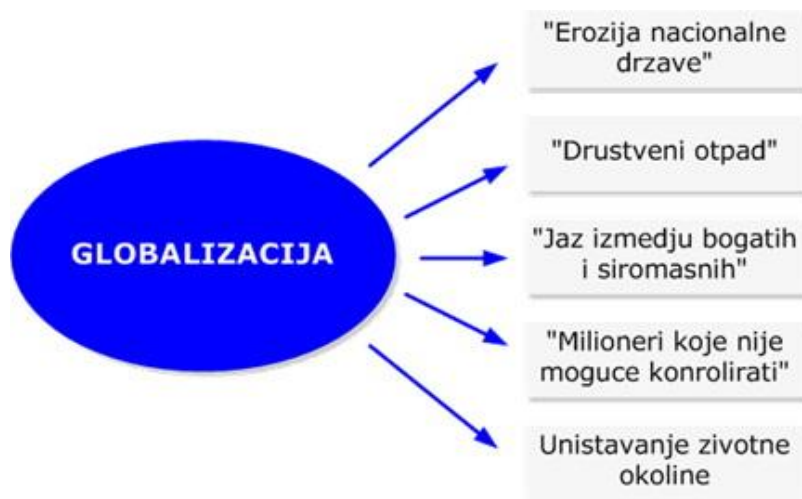
Slika 2 : Negativni učinci globalizacije