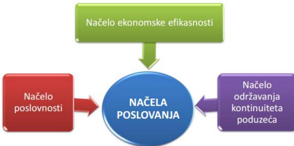
Slika 4: Prikaz osnovnih načela poslovanja