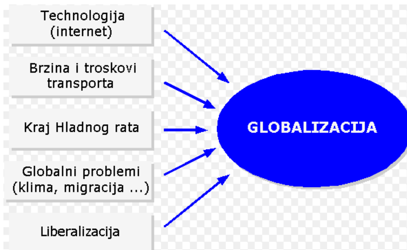
Slika 1 : Uzroci globalizacije