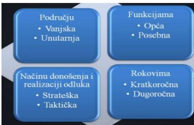
Slika 5: Podjela poslovne politike