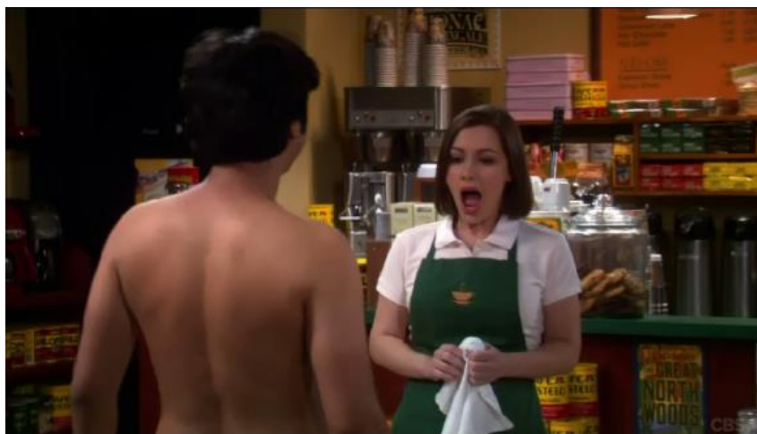
Slika 2. „The Wildebeest Implementation“/„Provedba divlje zvijeri“

U prvih šest sezona, njegova glavna osobina bila je socijalno anksiozni poremećaj zbog kojeg nije mogao komunicirati sa ženama osim ako nije imao alkohola u krvi. To se ne odnosi na ženske članove njegove obitelji ili gluhe žene, kao što je prikazano u epizodi „The Wiggly Finger Catalyst“/„Ispušni ventil vijugavog prsta“ u kojoj je imao djevojku koja je bila gluha te je s njom mogao razgovarati. Također, uz alkohol otkrio je i neke lijekove za koje je mislio da mu mogu pomoći, no ispostavilo se da ti lijekovi imaju čudne nuspojave, kao što su nekontrolirani pokreti ruku ili skidanje odjeće u javnosti što je prikazano u epizodi „The Wildebeest Implementation“/„Provedba divlje zvijeri“.