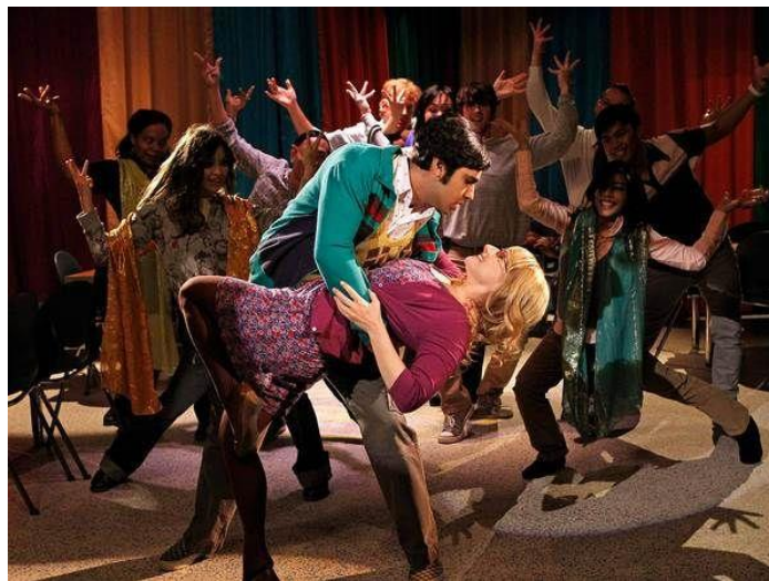
Slika 1. „The Thespian Catalyst“/„Glumački ispušni ventil“

Već u prvoj epizodi serije možemo svjedočiti rasističkim elementima kada se pojavi Penny, lijepa i mlada susjeda Leonarda i Sheldona, koja se obrati Raju, on joj ne odgovori, a njezina reakcija je: „Oprosti, govoriš li engleski?“ Ovu problematičnu pretpostavku pogoršava i činjenica da je njegov najbolji prijatelj Howard odmah uskočio objasnivši Penny kako joj Raj ne može odgovoriti iz razloga što je „štreber“. Čak i s djevojkama koje se u seriji smatraju „manje privlačnima“ kao što je Howardova djevojka Bernadette, Raj ne može komunicirati bez pomoći alkohola osim ako nije u snu kao što je prikazano u epizodi „The Thespian Catalyst“/„Glumački ispušni ventil“, u kojoj Raj sanja ljubavni mjuzikl u kojemu izvodi ples i pjesmu za Bernadette.