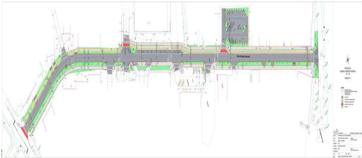
Slika br. 8: Dio trase koji se rekonstruira

Ulica Hrvatske državnosti će nakon rekonstrukcije imati i manje parkirnih mjesta. Rekonstruirat će se i parkirališta kod Doma mladih i ispred Porezne. Doći će do smanjenja parkirnih mjesta, ono je neznatno, nekih pet parkirnih mjesta manje u odnosu na postojeće stanje. No, ulica obiluje parkirališnim površinama pa se to neće ni osjetiti.