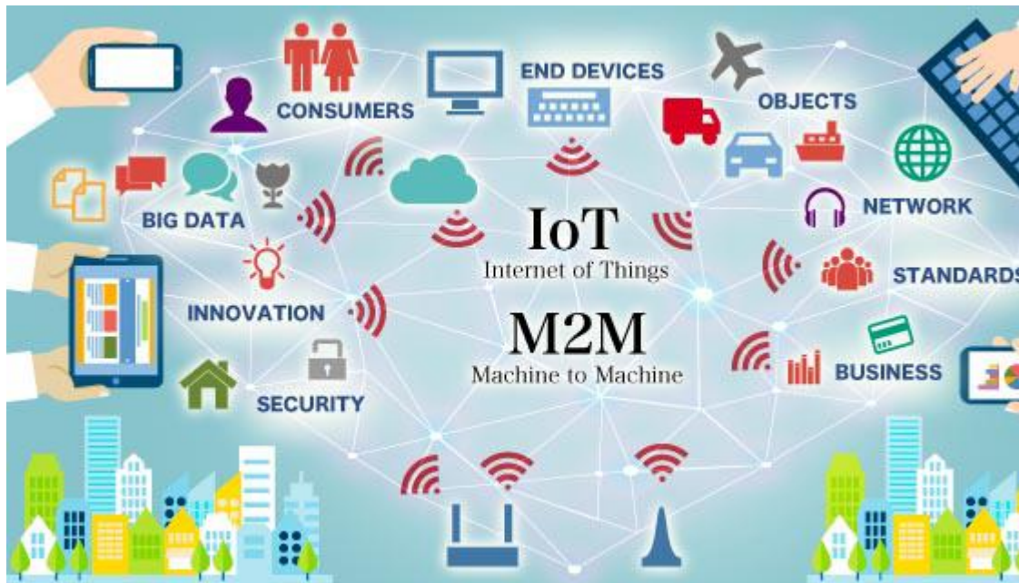
Slika br.4: Pametni sustavi za bolju učinkovitost i uštede

M2M tehnologija (Machine-to-machine) riječ je o automatskom prijenosu i razmjeni podataka između uređaja, strojeva ili aplikacija raznih namjena: npr. vozila, alarmnih sustava, bankomata, automata za prodaju robe ili naplatu usluga, nadzor udaljenih uređaja i postrojenja i dr. Isto tako, znate da sve te sustave jednostavno možete kontrolirati iz udaljenosti, koristeći samo mobilnu mrežu. Tu tehnologiju koriste operateri npr. T-com i dr.