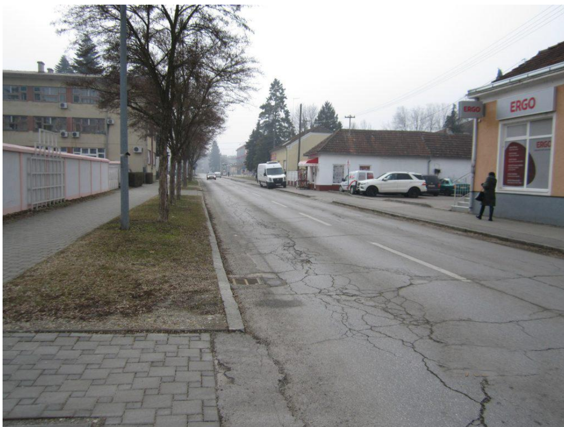
Slika br.9: Stanje prometnice prije rekonstrukcije

Prva pametna ulica u Koprivnici, kako je najavljuju iz gradske uprave- Svi pješački prijelazi ostaju, senzori će upozoravati na nailazak pješaka, bit će postavljene LED bljeskalice da se može zamijetiti da dolaze. Sensorima za stvaranje poledice na tlu podizat ćemo sigurnost svima onima koji prometuju tom ulicom.