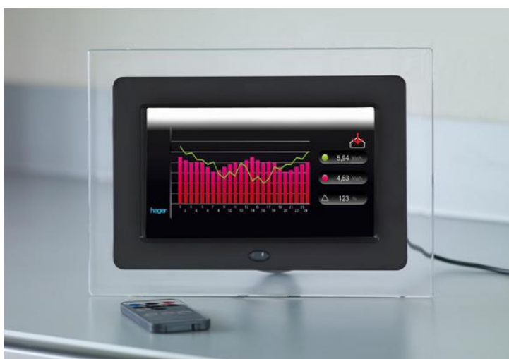
Slika br.2: Pametno brojilo

HEP je najavio nabavu 6.000 pametnih brojila koja bi trebala uskoro krenuti u upotrebu u najvećim hrvatskim gradovima. Trošak ovog projekta mogao bi dosegnuti iznos od 10 milijuna kuna, a trošak čeka i na odobrenje HERA-e. Jedna od prednosti koje donose pametna brojila jest i novi obračun potrošnje energije koji će se temeljiti na stvarnoj, a ne procijenjenoj polugodišnjoj potrošnji. Cilj je projekt provesti do 2020. u čitavoj EU, a zasad je masovno postavljanje zaživjelo samo u Švedskoj, Italiji, Danskoj i Finskoj. (14)