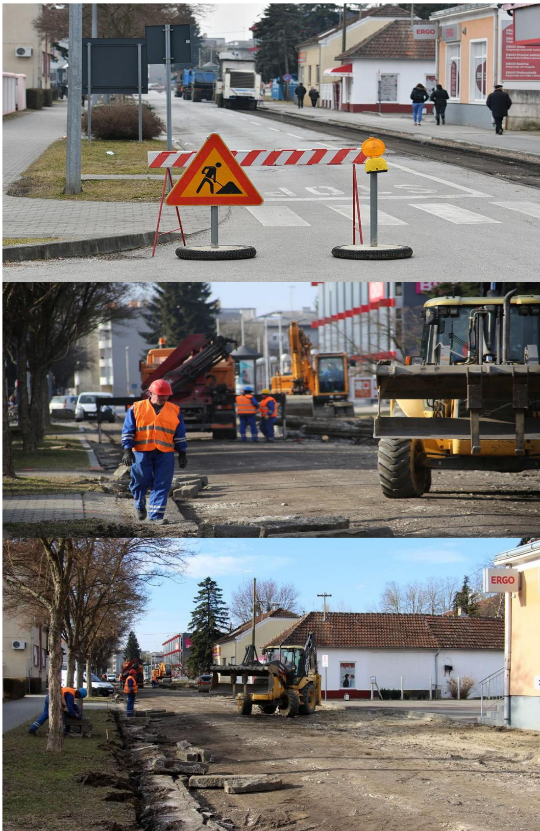
Slika br.10 : Radovi u tijeku

Radovi na pametnoj ulici u Koprivnici (započeti su 20.veljače 2017.)