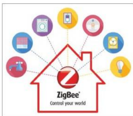
Slika br.1 : Shema ZigBee uređaja (13)

ZigBee je bežični komunikacijski protokol koji omogućuje da uređaji, bilo oni za kućnu ili poslovnu upotrebu, međusobno funkcioniraju i razmjenjuju podatke. ZigBee je osmišljen i ratificiran od strane tvrtki članica grupacije ZigBee Alliance u kojoj članstvo imaju više od 300 tehnoloških tvrtki i raznih proizvođača. Kao takav, ZigBee protokol je dizajniran i planiran da omogući bežične prijenose podataka između uređaja karakteriziranim sigurnošću i pouzdanošću. Osmišljen je još 1998. godine, zatim je standardiziran 2003. godine, a revidiran 2006. godine. (13)