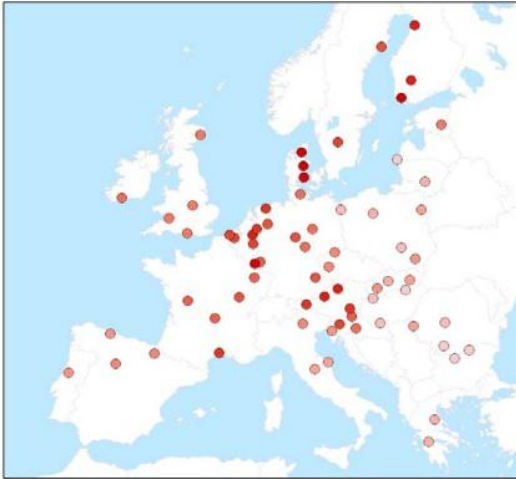
Slika br.6: Uzorak grada i grupna ocjena gradova

Na temelju tih definicija i metoda „smart city“ je rangirana prema prosjeku vrijednost svih pokazatelja. Empirijski rezultati proizvedeni su i ilustrirani pomoću tablica, grafova i karte.