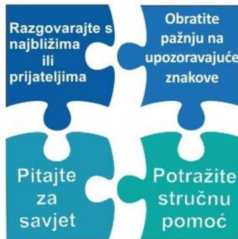
Slika 22.1. Mjere prevencije suicida

Često puta je medicinska sestra prva osoba s kojom suicidalna osoba dođe u kontakt bilo da se radi o medicinskoj sestri u ordinaciji liječnika opće medicine, hitne medicinske službe ili medicinskoj sestri u Objedinjenom hitnom bolničkom prijemu. Ako se medicinskoj sestri obrati suicidalna osoba, svakako je treba shvatiti ozbiljno, pokazati empatiju i pokušati saznati uzrok problema i sugerirati pacijentu ( pratnji) da se potraži stručna pomoć. Važno je dobro procijeniti pacijentovo psihičko stanje i nikako osobu sa izraženim suicidalnim mislima ne ostavljati samu. Ukoliko je moguće potrebno je provjeriti da li su pacijentu dostupni opasni predmeti, lijekovi ili neka druga sredstva te iste odstraniti.