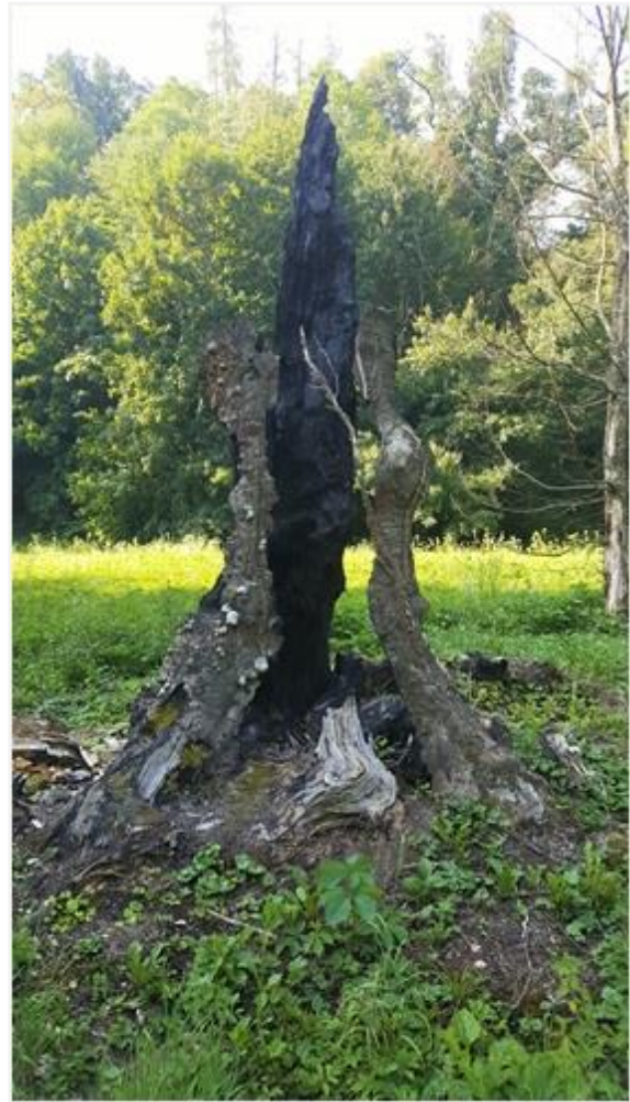
Slika 4.2. Spomenik munji