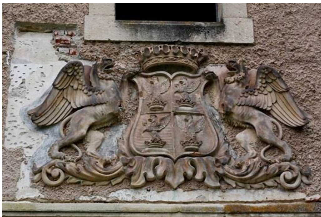
Slika 6.1. Grb obitelji Drašković iznad ulaza u dvorac