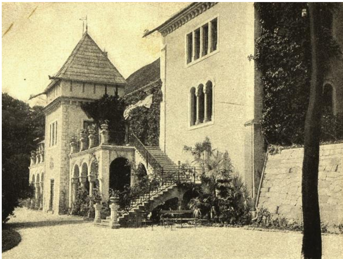
Slika 2.4. Detalj istočnog pročelja dvorca krajem 19. stoljeća

Nastupilo je višegodišnje učestalo devastiranje dvorca od strane lokalne mladeži, provale, razbijanje i palež, koji se nastavljaju do današnjih dana. [3]