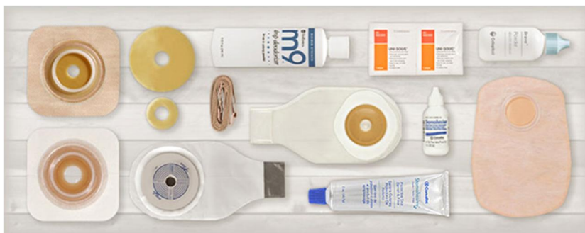
Slika 7.1.1. Prikaz pribora za izmjenu sustava na crijevnoj stomi

za crijevnu stomu, stoma puder i jednokratna špatula. Prema potrebi mogu se pripremiti i zrcalo, modelirajući prsten, stoma pojas i razna druga dodatna pomagala, ovisno o bolesnikom stanju i potrebama. Kod pripreme materijala poželjno je da na kolicima bude više materijala potrebnog za izmjenu u slučaju da dođe do prolijevanja stolice, neuspjeha tijekom postavljanja sustava itd. Na slici 7.1.1. prikazuje se osnovni pribor potreban za izmjenu sustava na crijevnoj stomi.