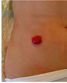
Slika 3.1.1. Ileostomija