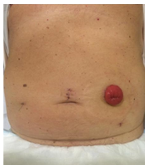
Slika 3.2.1. Kolostomija

Kolostomija (lat anus praeternaturalis) se izvodi na debelom crijevu i ona je najčešći oblik ugradnje stome. Također je ovalnog ili okruglog oblika, može biti privremena ili trajna, a izbočena je 0,5 do 1 cm iznad razine kože. Slika 3.2.1. prikazuje izgled kolostomije. Indikacije za kolostomiju su najčešće niski karcinomi anorektuma, hitna stanja lijevog kolona te upalne bolesti analnog kanala i perinealne regije. Sadržaj je drugačije konzistencije u odnosu na onaj koji izlazi iz ileostomije; ovisno o mjestu na debelom crijevu gdje se izvodi kolostomija, stoga je vrlo dobra metabolička tolerancija pa obično nema potrebe za većom nadoknadom elektrolita, tekućine, nutrijenata. Sadržaj koji izlazi na kolostomiju je poput normalne stolice ili proljevast. Ne postoji kontrola nad defekacijom, ali je proces prilagodbe puno brži i lakši jer je učestalost defekacija puno manja i sadržaj nije toliko agresivan za kožu. [5]