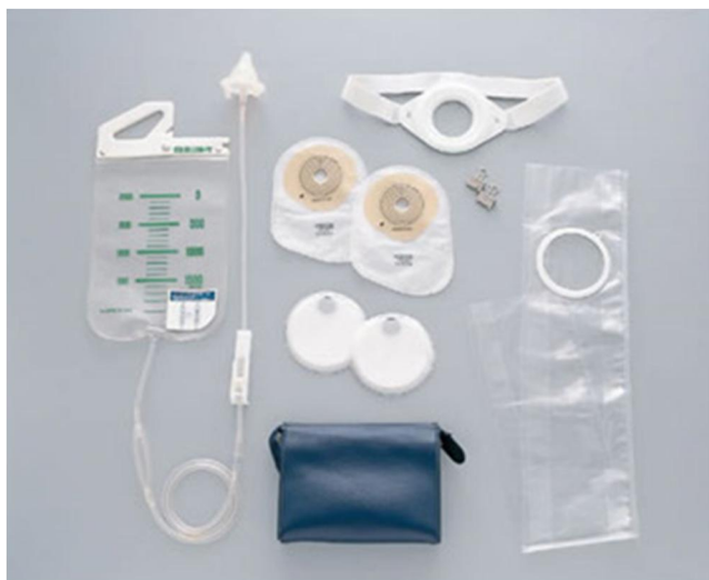
Slika 7.2.1. Prikaz seta za irigaciju stome