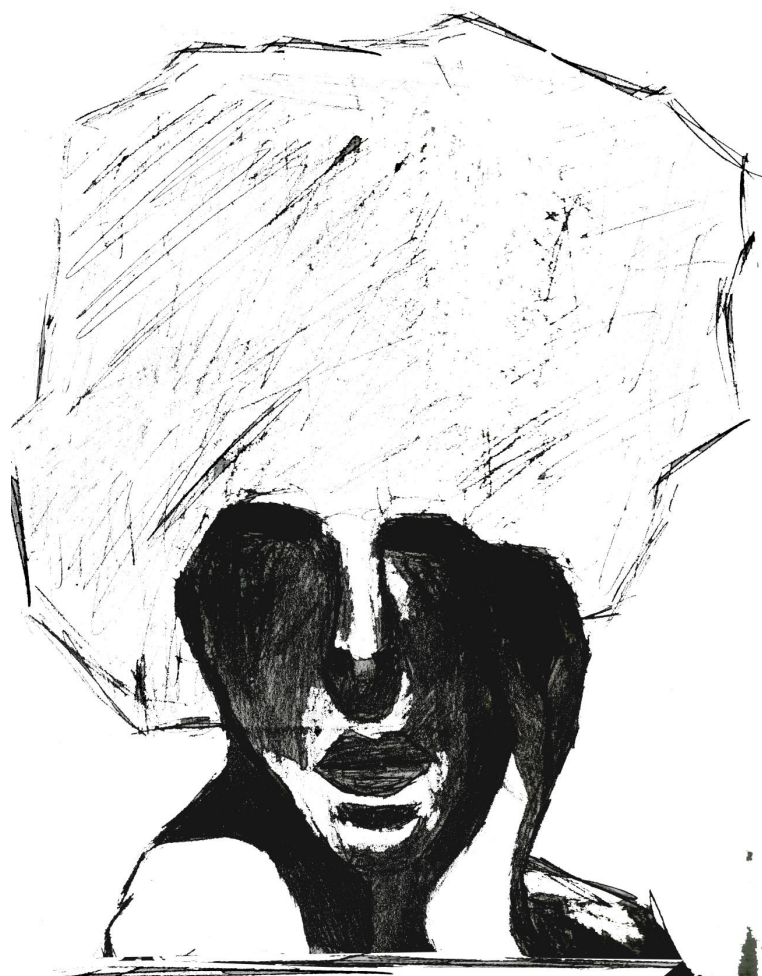
Slika 4.7. Digitalizirani crtež