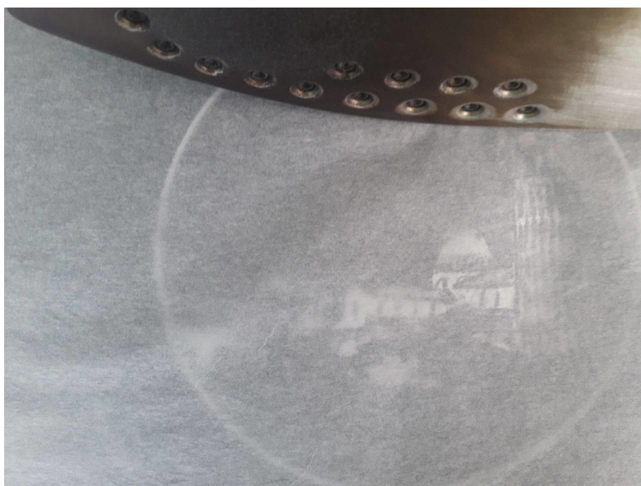
Slika 5.4. Prikaz slim papira i pegle kojom se otisnuo crtež

Veliku ulogu u ostvarivanju krajnjeg proizvoda je bilo istraživanje koje se najviše temeljilo na literaturi nađenoj na web stranicama. Može se reći da je termotisak vrlo isplativ i pogodan za personalizirane otiske, a kvaliteta krajnjeg proizvoda je vrlo zadovoljavajuća. Boje kod ispisa i