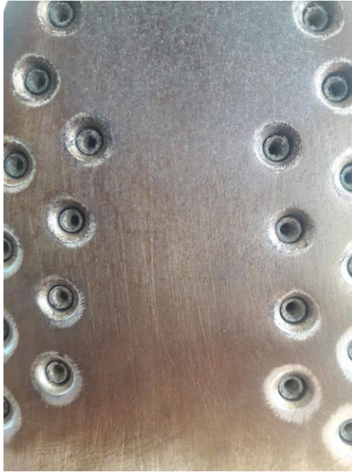
Slika 5.1. Površina preše- pegle

Veliki problem kod izrade je bio nedostatak tehničko- tehnološke opreme za izrezivanje i otiskivanje. Prilikom otiskivanja prešom, zbog velike temperature i nemogućnosti regulacije iste, dolazilo je do lijepljenja termo-papira- otiska za površinu preše (pegle). U procesu istraživanja problem lijepljena termo-papira za površinu preše riješena je upotrebom slim papira za pečenje, koji se pokazao kao dobro rješenje jer podnosi velike temperature, i termo-papir se nije lijepio za prešu.