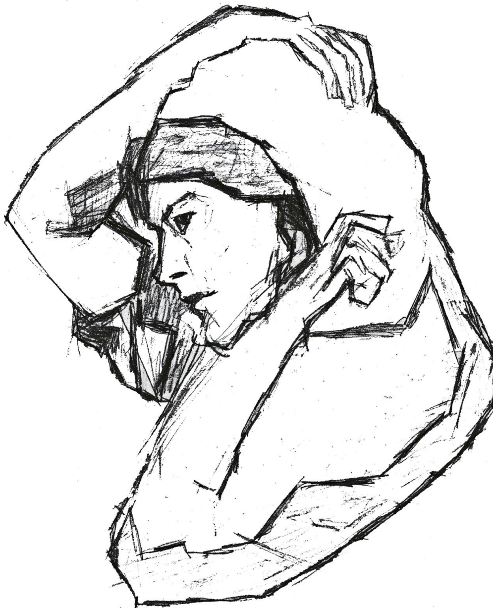
Slika 4.5. Digitalizirani crtež

Svrha digitalizacije je bila da se analogni crteži (crteži nastali grafitnom olovkom i ugljenom) prenesu u digitalni oblik, i da se putem grafičkog programa Adobe Photoshop naprave željene korekcije na crtežima. U procesu obrade na crtežima se povećao kontrast crne i bijele boje- sjena kako bi se stvorio umjetnički dojam, te željeni krajnji rezultat. Na pojedinim crtežima u procesu obrade promijenjen je format crteža, koji je u krajnjem procesu otiska na majicu vizualno nadopunjavao crtež.