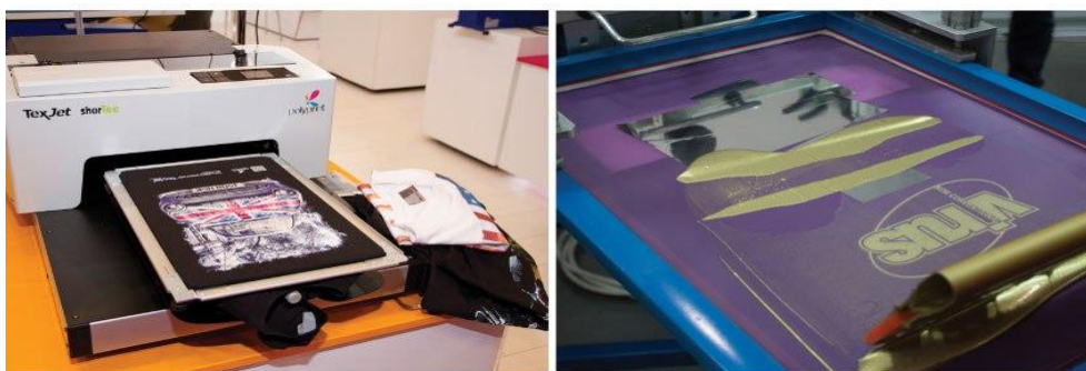
Slika 1.2. Dtg i Sitotisak