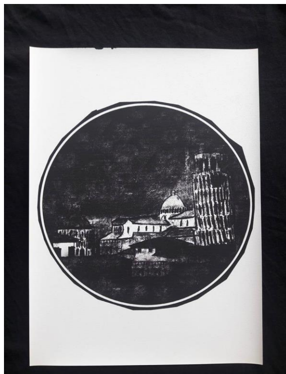
Slika 4.9. Ispis crteža na termo-papir za crne majice

Nakon digitalizacije i obrade, crteži su otisnuti na termo-papiru Paper Jet za crni i tamniji tekstil, te na termo-papiru Avery Zweckform za bijeli i svjetliji tekstil pomoću Inkjet pisača Hp 1515. Osim termo-papira za Inkjet pisače na tržištu postoje termo-papiri i za laserske pisače.