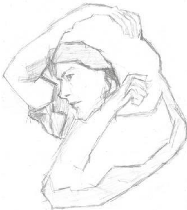
Slika 4.1. Analogni crtež

Općenito se pod pojmom grafike podrazumijeva sve ono što je napisano, nacrtano ili urezano. Nastali crteži nacrtani su na papir promatranjem i zamišljanjem, kroz izradu crteža željelo se postići kontrast crne i bijele boje kroz plohe koje tvore cjelinu u crtežu. Svaki materijal bilo da je to drvo, bakar, papir ili boja, ima svoju dušu i narav i traži drugačiji pristup, taktiku ili intuiciju, da bi se iz njega izmamila upravo njemu svojstvena kvaliteta, njegova bit. [15]. Može se sa sigurnošću konstatirati da je papir jedan od zahvalnijih materijala za crtanje jer se svaka pogreška može s lakoćom ispraviti , što u usporedbi s npr. linorezom nije moguće.