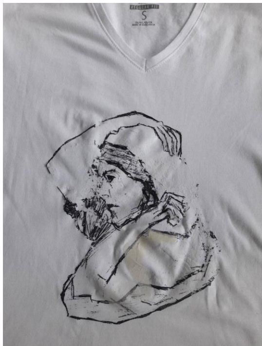
Slika 5.2. Greška prilikom otiskivanja