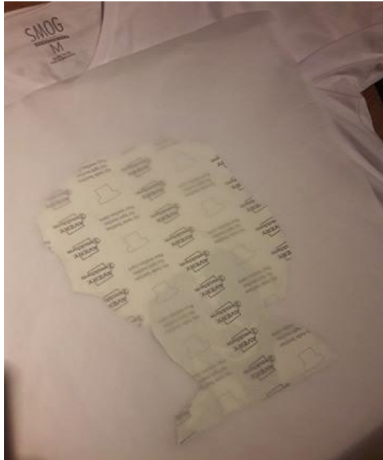
Slika 4.10. Priprema za otisak

Dijelovi koji nisu bili dio crteža su izrezani kako se ti dijelovi nebi otisnuli na majice. Prilikom otiskivanja crteža na bijele majice, crtež se otisnuo u zrcalnom načinu te se termo-papir zajedno sa otiskom bez ikakvih predradnji otisnuo termo prešom (peglom) na majicu, te se nakon otiska odvojila folija od crteža dok se na termo-papir namijenjen za crne majice crtež otisnuo bez zrcaljenja, ali je prije otiskivanja na majicu potrebno odvojiti foliju na kojoj se nalazi crtež od nosača (papir).