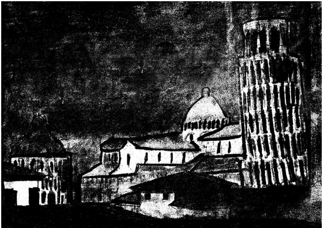
Slika 4.8. Digitalizirani crtež