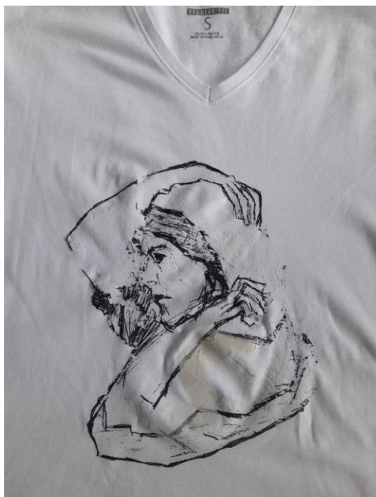
Slika 5.2. Greška prilikom otiskivanja