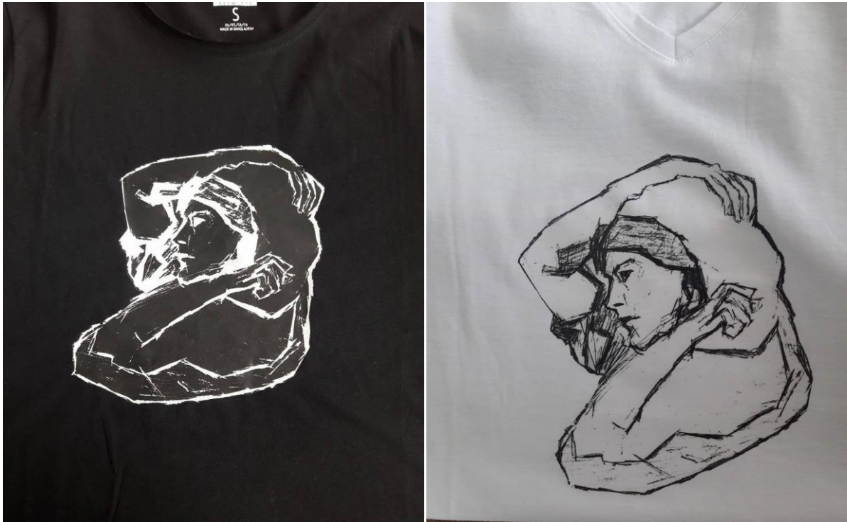
Slika 5.4. Otisak na crnu i bijelu majicu

otiska na majice rezultirale su vrlo kvalitetnom oštrinom. S obzirom na različitost u procesu otiskivanja na majice crne i bijele boje, otisak na bijelu majicu daje bolji vizualni i mehanički-opipljivi dojam, jer se sama boja kvalitetnije otisnula u tkaninu majice. Otisak na crnu majicu daje dojam plastičnosti, te sam otisak nije dovoljno utisnut u majicu. U usporedbi sa drugim tehnikama tiska, termotisak je vrlo pristupačna tehnika koja ne zahtijeva previše radnji kod pripreme za otisak. Termotisak je direktna tehnika tiska i sama priprema vrši se putem računala, nakon koje se željena aplikacija ispiše sa laserskim ili ink-jet pisačem na termo-papir.