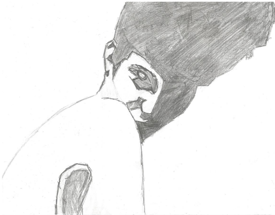
Slika 4.2. Analogni crtež