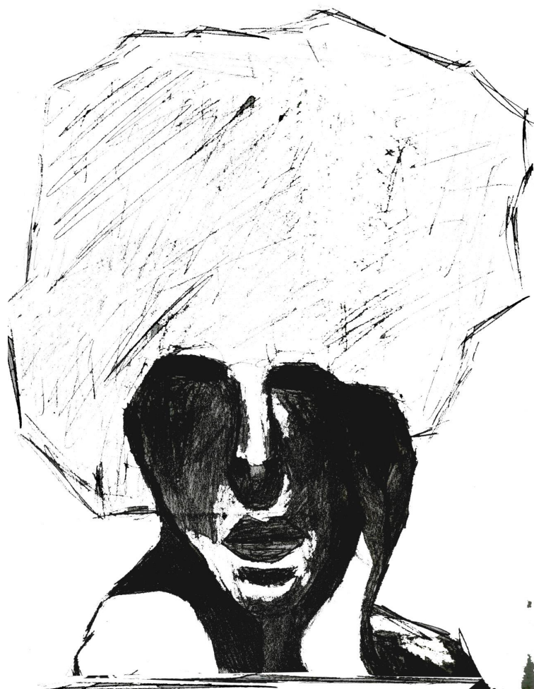
Slika 4.7. Digitalizirani crtež