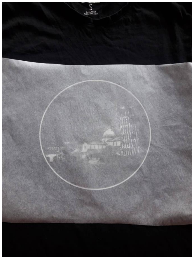
Slika 5.3. Upotreba slim papira