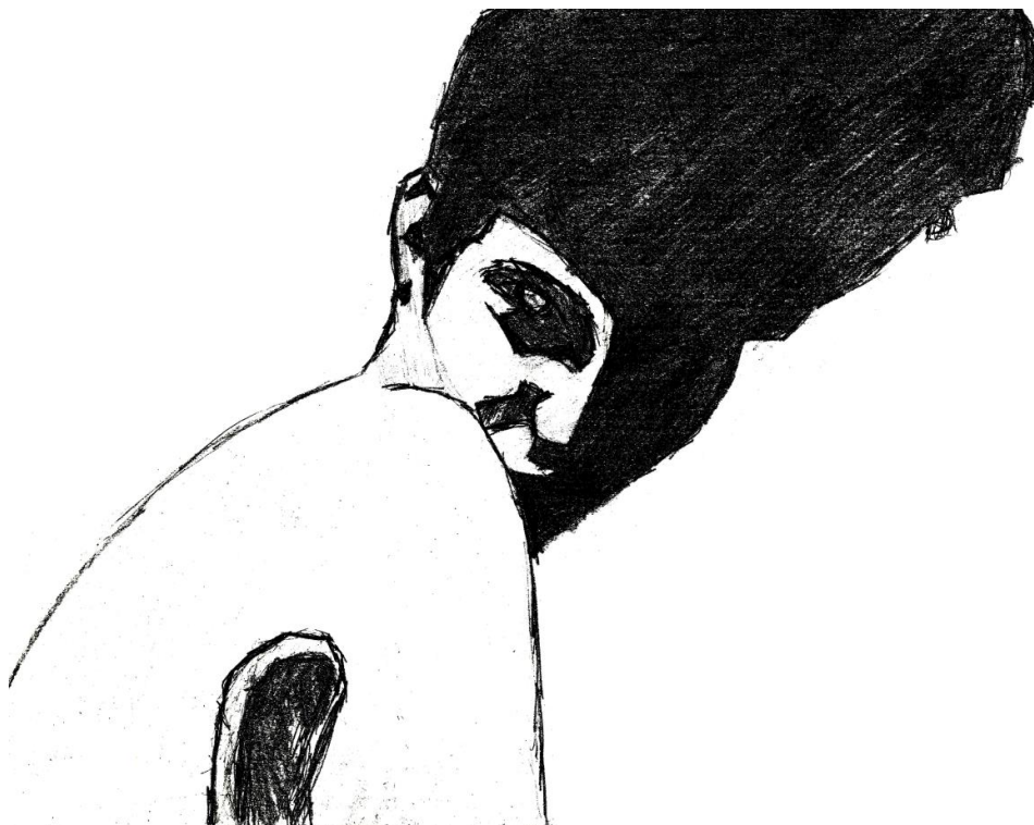
Slika 4.6. Digitalizirani crtež