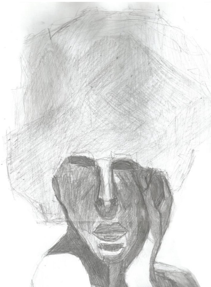
Slika 4.3. Analogni crtež