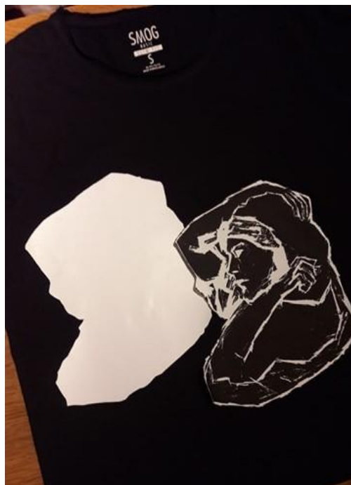
Slika 4.11. Priprema za otisak