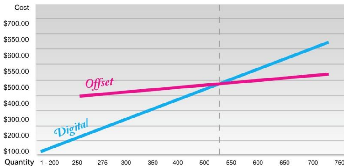
Slika 2.1. Usporedba offsetnog i digitalnog tiska

Već se generacijama digitalni tisak lagano širi s novim tehnologijama koje su pokrenule integrirane proizvodne procese i personalizaciju proizvoda. Rane inovacije su često bile skupe i nisu imale prihvatljivu kvalitetu i cijenu za krajnje korisnike. Jedna od vodećih tehnologija u digitalnom industrijskom tisku je inkjet ispis. Već dugi niz godina, tehnologije inkjet ispisa kao što su “kapljica na zahtjev” (drop-on-demand) i kontinuirani inkjet se bore za prihvaćanje zbog visokih troškova, pouzdanosti i ograničenog raspona dostupnih materijala (boja i podloga). Ti čimbenici otežavali su raspon aplikacija koje bi se mogle proizvesti. Tijekom protekla dva desetljeća tehnološki razvoj boja i ispisnih glava su doveli do aplikacija koje učinkovito mijenjaju dinamiku industrijskog tiska u korist digitalnih tehnologija ispisa. Inkjet tehnologija omogućuje proizvođačima da proizvode kvalitetne proizvode uz prihvatljiv trošak, a istovremeno imaju koristi od masovne prilagodbe ispisa – masovne personalizacije (Mass Customization).[6]