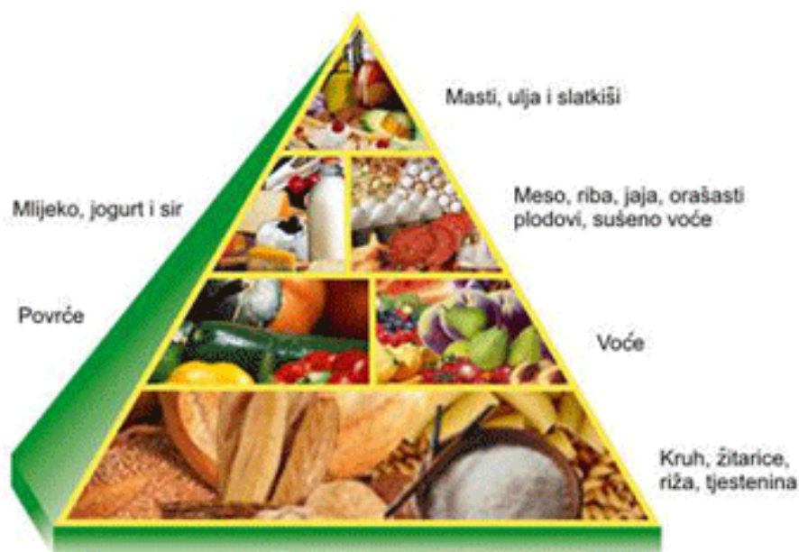
Slika 3.1.1. Piramida pravilne prehrane

Piramida korisne mediteranske prehrane (Slika 3.1.1) prikazuje opće proporcije i frekvenciju obroka, koja zbog različitih životnih stilova i potreba namjerno nije strogo definirana.