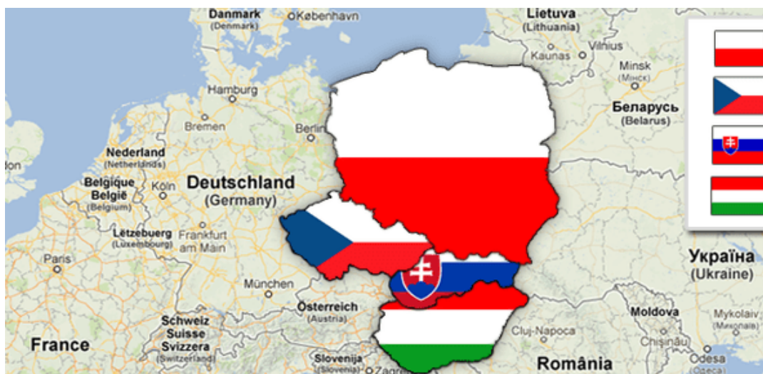
Slika 3 : Zemlje Višegradske skupine