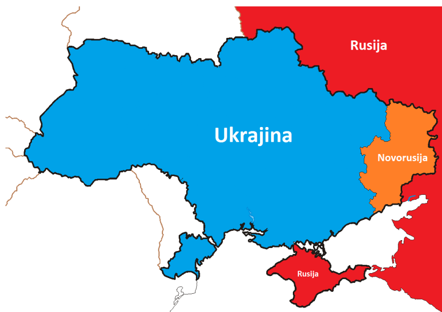
Slika 4: Teritorij Ukrajine – aneksija Krima i nastanak Novorusije

se nalazi na pomolu podijele zemlje i na početku građanskog rata za njezin suverenitet.