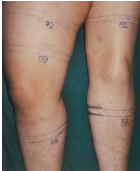
Slika 2.5.1. Duboka venska tromboza

Kod zahvaćene donje šuplje vene otok je obostran, a kod zahvaćenih renalnih vena javlja se i nefrotski sindrom. Kod okluzije gornje šuplje vene izražen je otok, nabreklost vena i kongestija kože i sluznice glave i vrata, ramena i ruku. Masivna, unilateralna ili bilateralna tromboza ileofemoralnih vena i njihovih ogranaka obično počinje naglo jakim otokom i bljedoćom ili cijanozom kože, u početku periferno mrljastog rasporeda, a kasnije se, zbog sve manjeg arterijskog dotoka, proširi i proksimalno. Arterijski dotok onemogućen je kompresijom u preponi i prepunjenošću venskog bazena te na stopalu i prstima nastaje ishemična gangrena. Ovako teška klinička slika naziva se phlegmasiaalba ili ceruleadolens. Bolest vrlo često završava letalno [5].