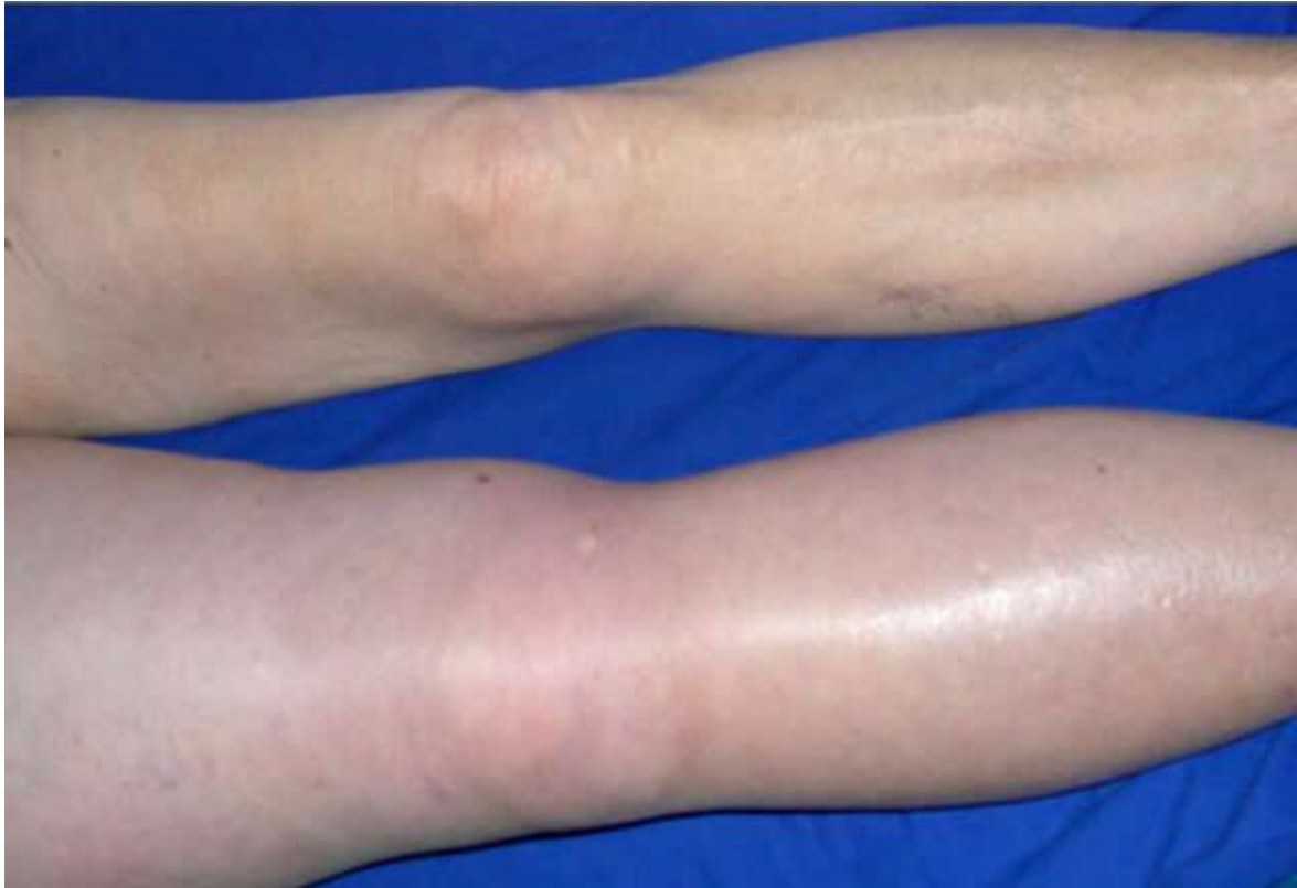
Slika 2.2.1. Duboka venska tromboza