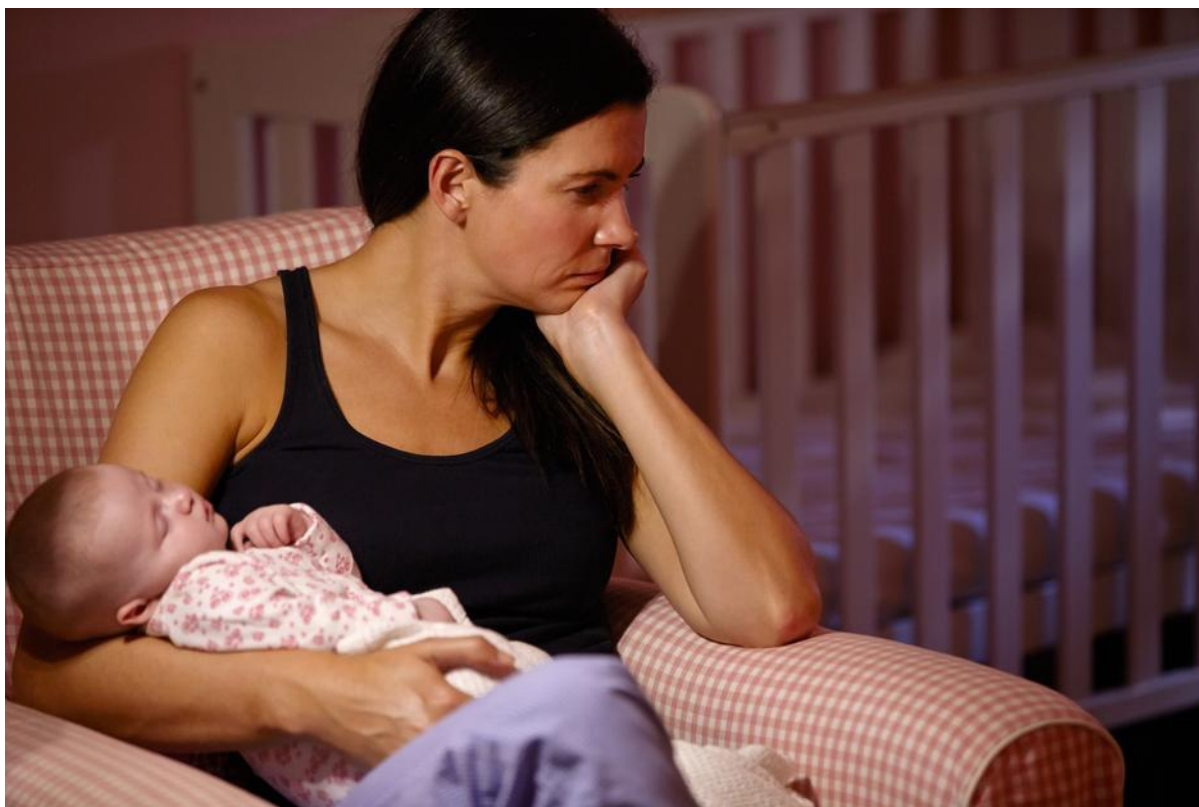
Slika 3.2.1. Postpartalna depresija