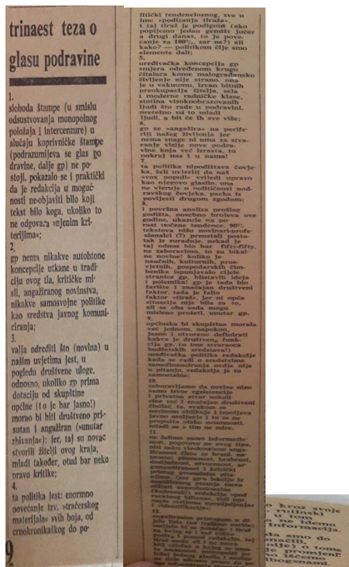
Slika 2.1. „Trinaest teza o Glasu Podravine“

Primjer izravne kritike novinarstva kakvo je bilo karakteristično za lokalni tisak pod kontrolom lokalnih političkih struktura bio je i članak „Trinaest teza o Glasu Podravine“