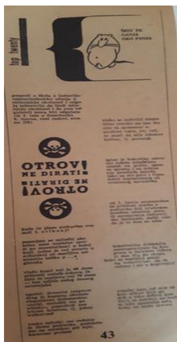
3.7. Slika „Top twenty“

Zanimljiva rubrika koja se nalazi na kraju časopisa zasićena dosjetkama i humorom, ali prikazana kroz aktualne lokalne događaje. Radi se o posebnom pristupu u kojem je baš društvena situacija sirovina za završni humoristični tekstualni proizvod. Ono što je važno za razumijevanje istoga jest upoznavanje s kompletnim listom kako bi se čitatelju približio način na koji su osmišljavali takve dosjetke, a ono što je malo teže dosegnuti jesu ljudi onog vremena o kojima se pričalo ili konkretne situacije za koje netko danas ne zna pa u takvoj situaciji možda ne može razumjeti o čemu su pisali i čemu su se smijali.