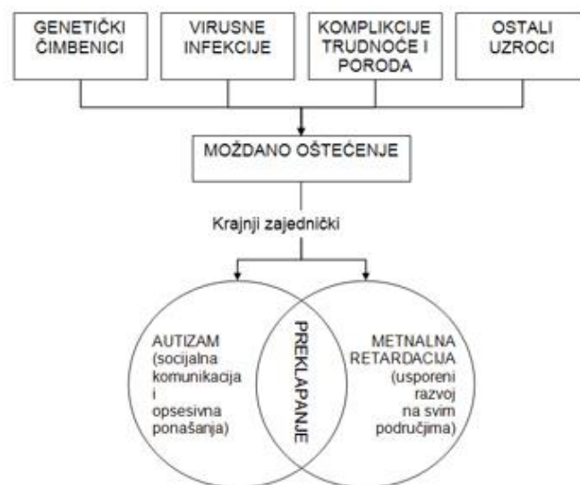
Slika 2.3.1. Prikaz zajedničkog djelovanja mogućih različitih uzročnika na nastanak PSA (prema S. Baron-Cohen i P. Boltonu, 1993.)

Provedeno je istraživanje organskih uzroka autističnog poremećaja na uzorku od šezdesetero djece s Odjela za autizam Psihijatrijske bolnice Jankomir u Zagrebu koje je pokazalo da 63,3% djece ima organsko oštećenje SŽS-a (epileptične napadaje 17,5%, patološki promjene EEG nalaz 45%, patološki nalaz CT-a mozga 12,5%), pozitivni anamnestički podaci nalaze se u 42,5 % djece (rizična trudnoća, težak porod, reanimacija, asfiksij pri porodu), a pozitivan hereditet u čak 27,5%. [1,7]