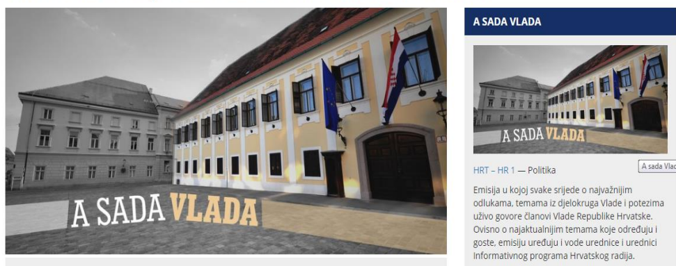
Slika 5.2. Emisija: A sada Vlada