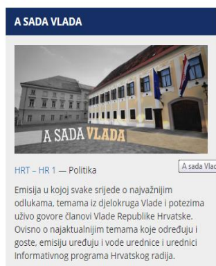
Slika 5.2. Emisija: A sada Vlada