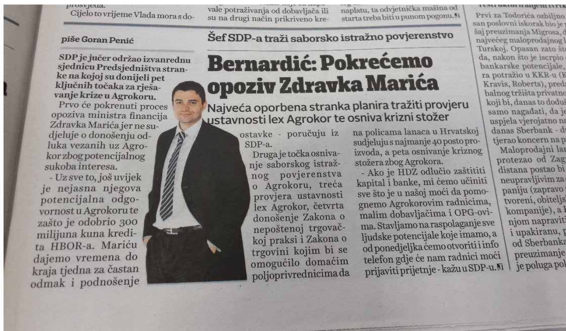
Slika 3.5. Presnimka teksta u Večernjem listu