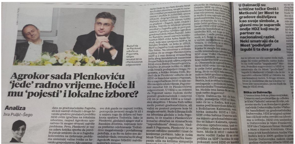
Ilustracija 3.4. Presnimka kolumne Ive Puljić-Šego u Večernjem listu