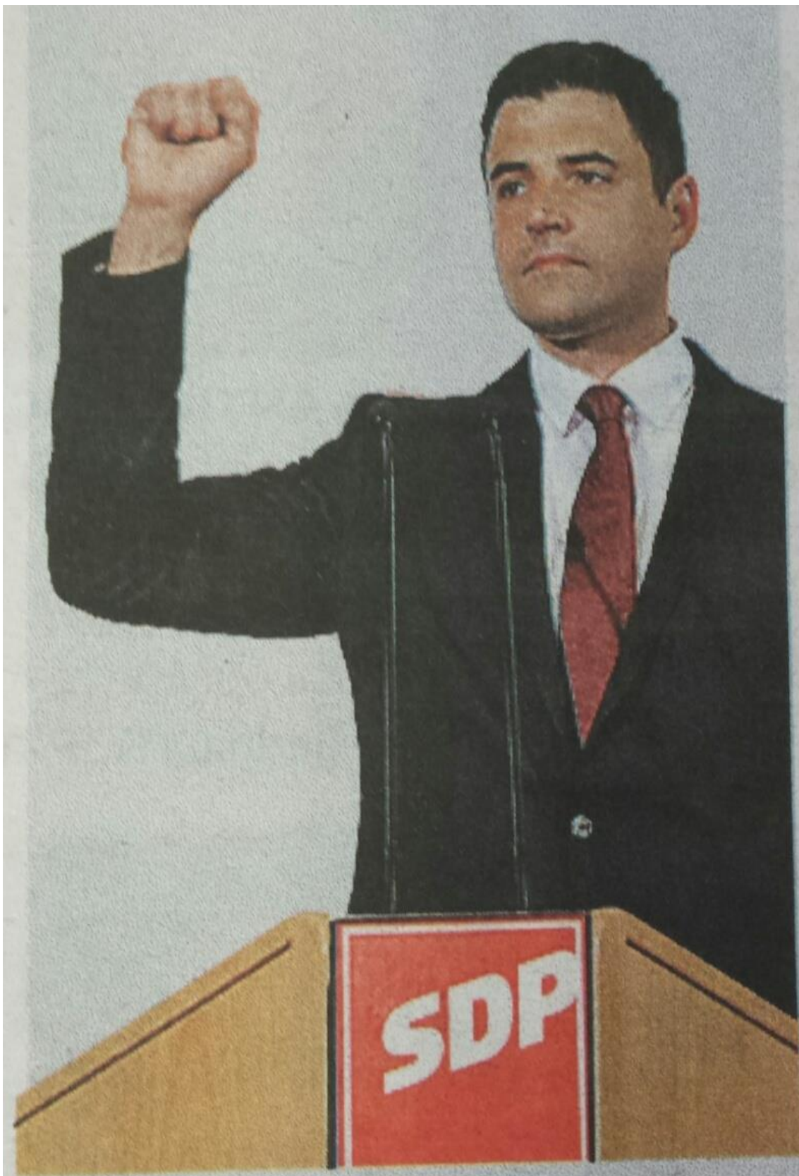
Presnimka 3.7. Bernardičeva fotografija iz Jutarnjeg lista koja se najčešće ponavlja