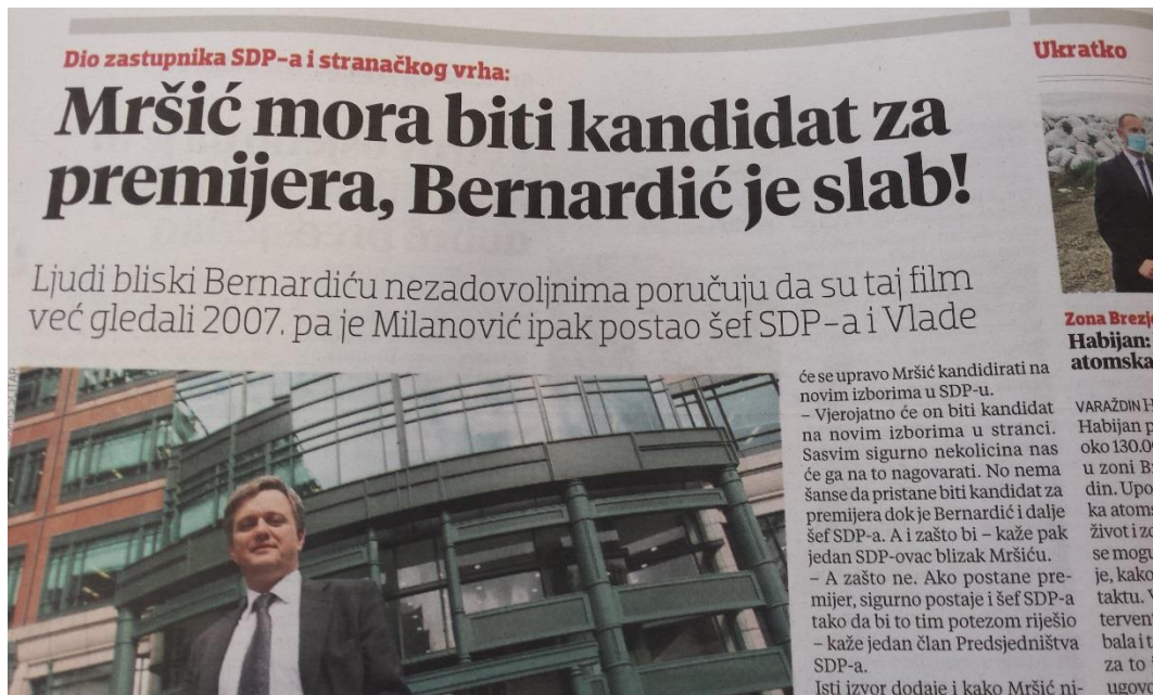
Ilustracija 3.5. Presnimka teksta u Jutarnjem listu