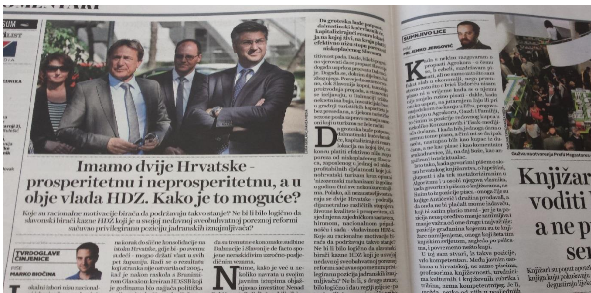
Ilustracija 3.4. Presnimka kolumne Marka Biočine u Jutarnjem listu

Prema istraživanju u svibnju iste godine 9 , u posljednja četiri mjeseca prednost HDZ-a u odnosu na SDP gotovo se prepolovila (u veljači je iznosila gotovo 12 posto, dok je tada bila 6,7 posto), opet zbog „afere Agrokor” te Plenkovićeva podržavanja ministara Barišića i Marića. Također, svibanjsko istraživanje 2017. pokazalo je kako vrh ljestvice negativnog doživljaja hrvatskih političara drži upravo premijer Plenković, za koga je glasalo 18,5 posto anketiranih građana. Ukratko, negativno raspoloženje prema Plenkoviću osjetno je poraslo od početka godine. Na kraju godine, točnije u studenome 2017., istraživanje CRO Demoskop 10 potvrdilo je kako se upravo premijer našao na vrhu ljestvice negativnog doživljavanja hrvatskih političara. Tomu je zasigurno pridonio slučaj Tomašević, odnosno mlako reagiranje vrha HDZ-a na nasilje u obitelji svoga župana, o kojem su Jutarnji i Večernji list gotovo podjednako pisali, te je sveukupno o toj temi objavljeno sedam članaka. Pri samom kraju, u prosincu 2017. godine, najviše se pisalo o arbitraži sa Slovenijom, o čemu je objavljeno 37 tekstova.