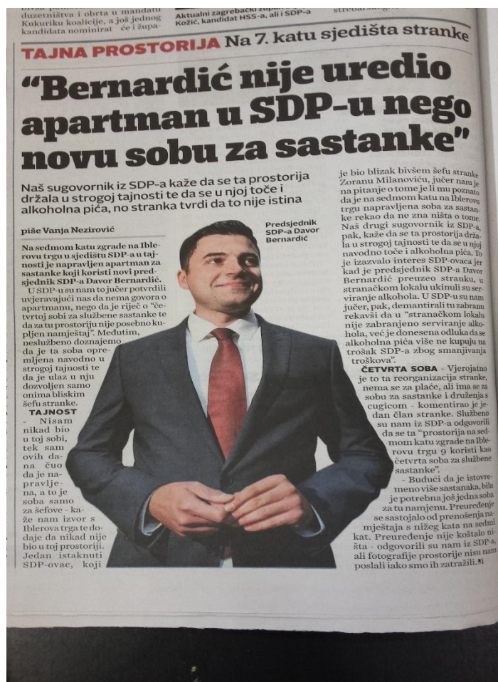
Ilustracija 3.5. Presnimka teksta u Jutarnjem listu

Na temelju svega navedenog može se zaključiti kako je Večernji list objavljivao više tekstova o Bernardiću nego Jutarnji list koji je često isticao njegovo prozivanje Vlade i upozoravanja na razne društvene probleme. U tekstovima se, ipak, najviše govorilo o lošem stanju u stranci i poziciji Davora Bernardića kao lidera stranke.