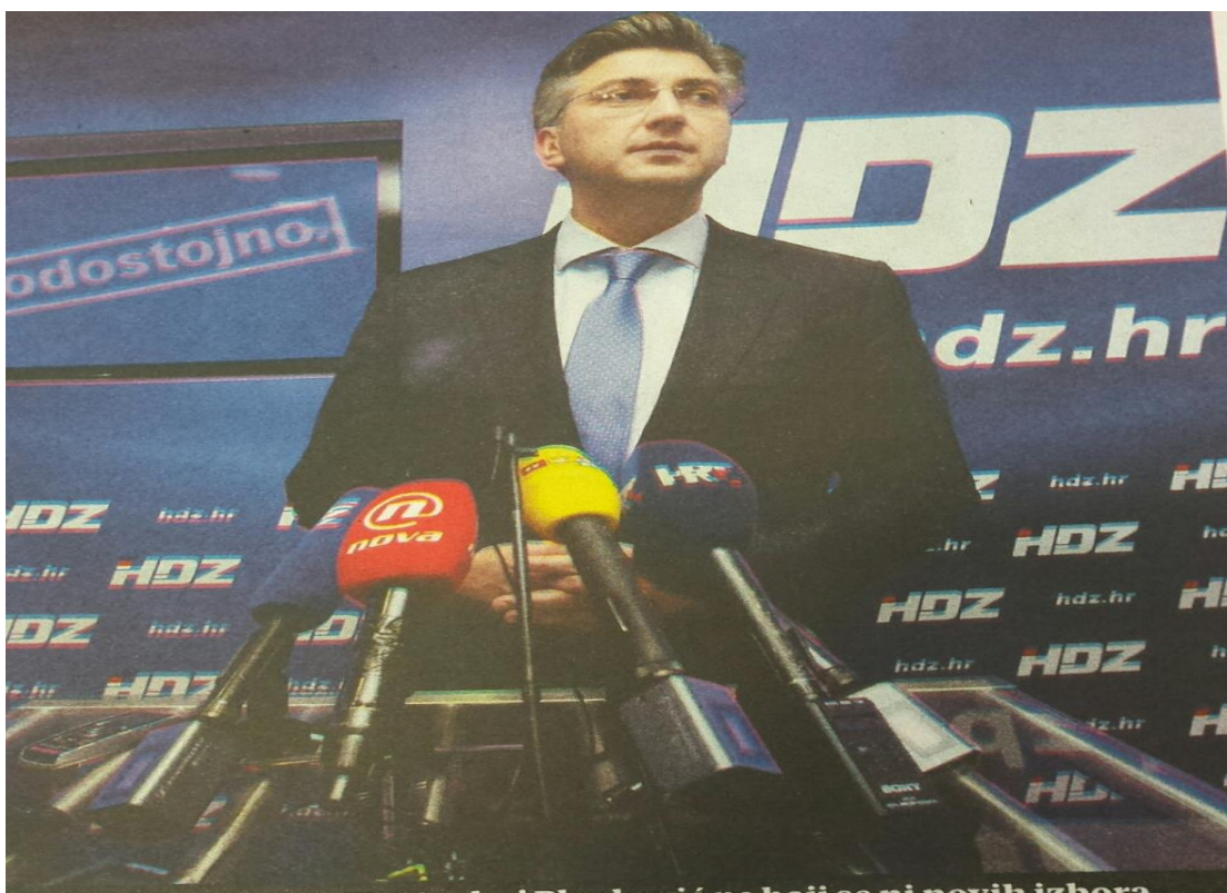
Slika 3.6. Tipična Plenkovićeva fotografija u Večernjem listu