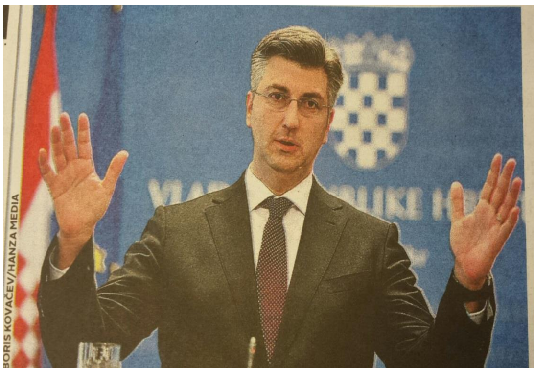
Ilustracija 3.6. Tipični Plenkovićev portret u Jutarnjem listu

Večernjakov je pristup, dakle, dokumentaristički bogatiji i dosljedniji, uz osjetno manje vizualnih provokacija i svjesnih manipulacija u odnosu na Jutarnji list. U Jutarnjem listu može se na fotografijama u slučaju Plenković povremeno osjetiti negativno raspoloženje, iako je takvih prikaza tek desetak posto u odnosu na ukupni broj njegovih fotoportreta. Tu je premijer prikazan kako zasigurno nije želio ispasti, iskazujući ljutnju, nekontrolirani smijeh i tome slično. Kod Večernjeg lista su gotovo uvijek objavljivane fotografije u kojima nije namjera prikazati Plenkovića u negativnom kontekstu. U Večernjem se, za razliku od povremenih postupaka Jutarnjeg lista, vizualno ne komentiraju pojedini premijerovi potezi.