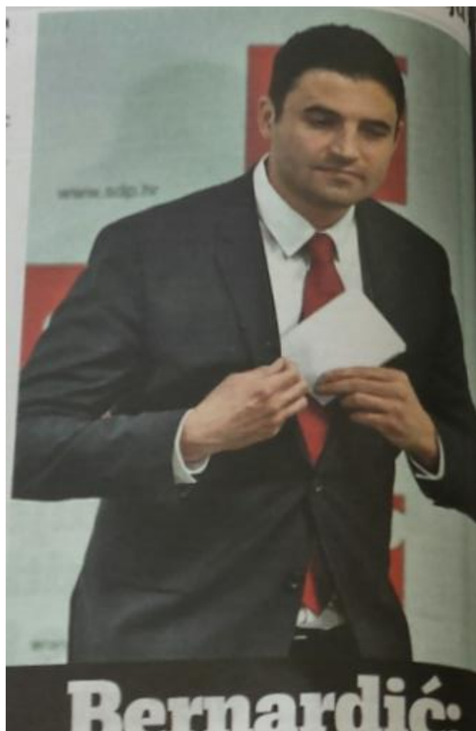
Presnimka 3.7. Sugeriranje Bernardićeve nesigurnosti na fotografijama u Jutarnjem listu