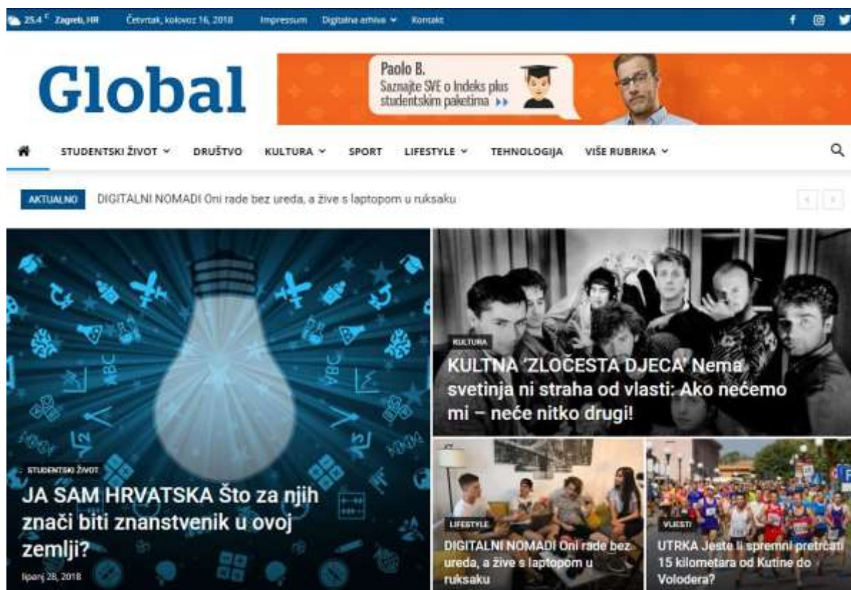
Slika 3. Naslovna stranica portala Global

Na stranici portala Global na samom vrhu nalaze se informacije o trenutnoj vremenskoj prognozi u Zagrebu te datum i godina. Zatim slijede poveznice na Impressum, digitalnu arhivu, kontakt i poveznice na društvene mreže: Facebook, Instagram i Twitter. Ispod se nalazi njihov logo i banner s oglasima. Zatim dolazimo do trake s rubrikama i podrubrikama, kućicom za povratak na početnu stranicu te tražilice. Portal Global ima sedam rubrika te 22 podrubrike. Prva rubrika je Studentski život s podrubrikama: Erasmus, HumansofUniZG, Što te muči, Prouči i Studensk@psiha. Druga je Društvo, zatim slijedi Kultura: Film, Glazba, Kazalište, Književnost i Vizualna umjetnost. Sljedeći je Sport te Lifestyle: Hrana, Moda, Putovanja, Zdravlje. Na posljertku se nalazi Tehnologija i dio označen Više rubrika koji sadrži podrubrike: Vijesti, Intervju, Svijet, Karijera, Novac, Srednja, Reportaža, Fotoreportaža, Komentari. Ispod trake s rubrikama nalaze se izmjenjujuće aktualnosti te posljednje objavljeni tekstovi. Kada se spuštate na stranici portala naslovna traka vas ne slijedi, ali se pojavljuje plava strelica koja omogućava povratak na početak. 36