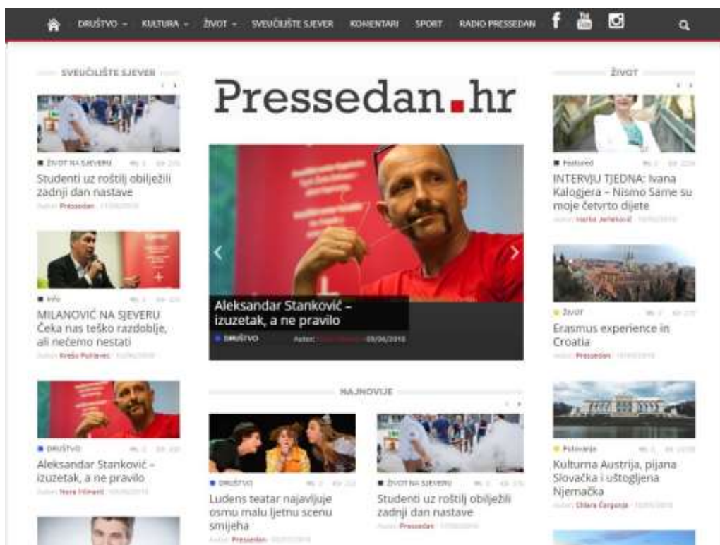
Slika 2. Naslovna stranica portala Pressedan

Na gornjem dijelu naslovnice portala Pressedan smještena je naslovna traka koja sadrži glavne rubrike, sa svojim podrubrikama te simbol kućice koji označava početnu stranicu. Pressedan ima šest rubrika na naslovnoj traci te 17 podrubrika. Rubrika društvo je prva po redu i sadrži podrubrike: Hrvatska, Svijet, Mediji, Znanost i obrazovanje, Politika i Gospodarstvo. Zatim slijedi Kultura: Film, Glazba, Kazalište, Književnost, Izložbe. Posljednja rubrika s podrubrikama je Život: Studentski, Putovanja, Zabava, Zdravlje, Moda, Tehnologija. Rubrike bez podrubrika su: Sveučilište Sjever, Komentari i Sport. S desne strane trake smještene su poveznice za Radio Pressedan i društvene mreže: Facebook, Youtube i Instagram te tražilica. Ispod naslovne trake smješteni su tekstovi iz rubrika Sveučilište Sjever s lijeve, život s desne, istaknuti sadržaj nalazi se u sredini te se automatski rotira, a ispod njega se pojavljuju najnovije objavljeni tekstovi. Neovisno o tome gdje se nalazili, dakle na stranici ili u kojoj rubrici, naslovna traka je uvijek dostupna. 35