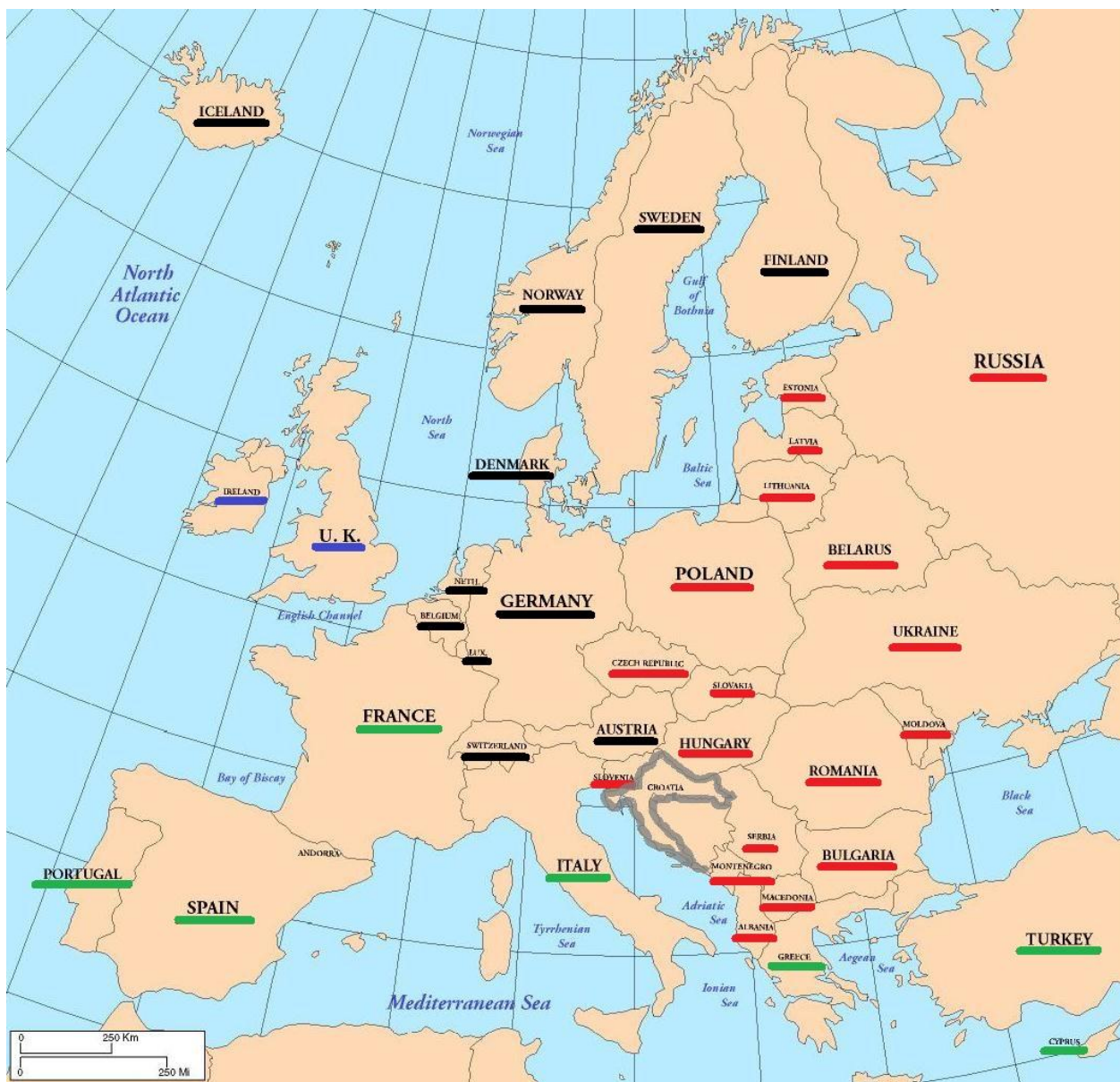
Slika 1. Karta Europe s naznačenom pripadnošću medijskim modelima

Nakon iznošenja osnovnih teorijskih spoznaja o masovnim medijima i online novinarstvu, pa o sportskom novinarstvu i u konačnici o etičnosti i profesionalnim standardima u novinarstvu, red je došao na problematiku koja se spominje u naslovu ovoga rada. Liberalni medijski model, ili sjevernoatlantski, jedan je od četiriju modela koji se javljaju na europskom prostoru, točnije, u europskom medijskom prostoru. Zajedno sa sjevernoeuropskim modelom, liberalni je primjer dobre prakse, a vidjevši iz imena, može se zaključiti kako Hrvatska ne pripada nijednom od dva spomenuta, no o slučaju Hrvatske više će riječi biti kasnije. Uz sjevernoatlantski ili liberalni i sjevernoeuropski ili demokratski korporativistički model, Europom se još prožimaju i mediteranski i istočnoeuropski medijski model. (Terzis 2008: 1)