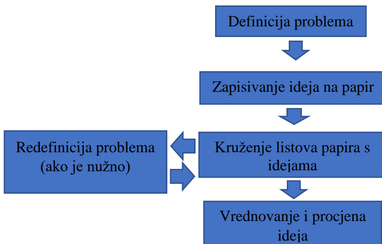
Prikaz 2. Faze metode „brainwriting“

Izvor: Srića, V. (2003.) Kako postati pun ideja: Menadžeri i kreativnost. 2. izd. Zagreb. M.E.P. CONSULT., 103.str.