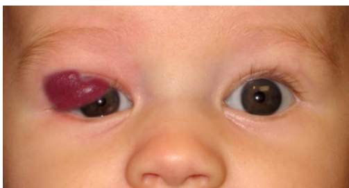
Slika 2. Hemangiom na oku