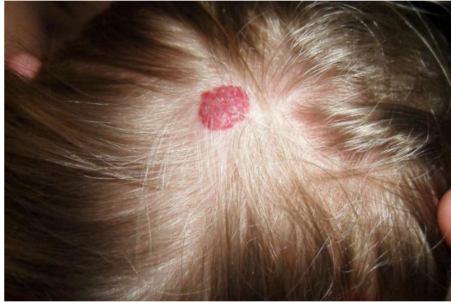
Slika 5. Hemangiom na vlasištu