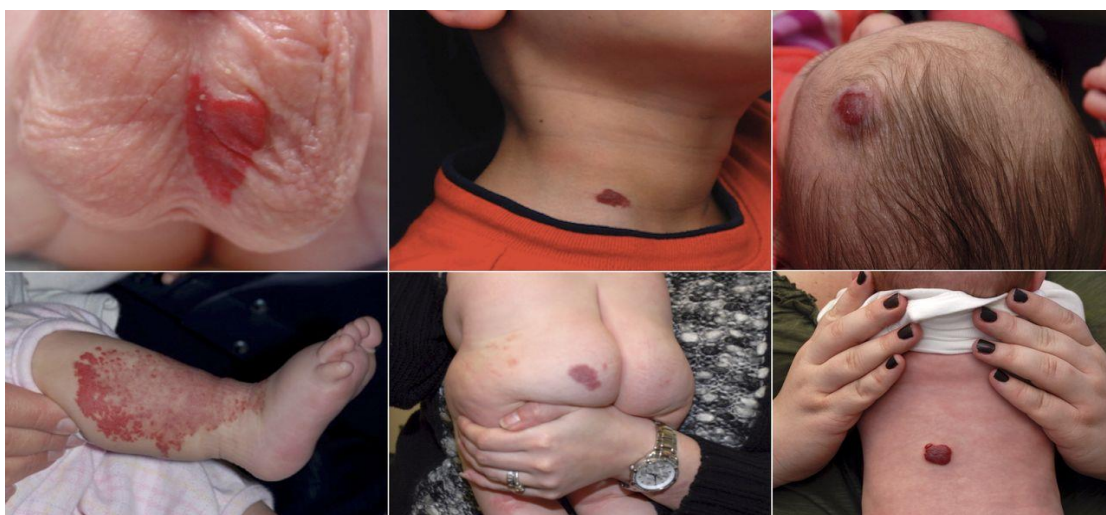
Slika 1. Lokalizacija Hemangioma

Hemangiomi su dobroćudne tvorevine građene od umnoženih stanica malih krvnih žilica. Nepoznatog su uzroka, a javljaju se u oko 2,5% novorođenčadi, tj. 5 – 10% dojenčadi. U 60% slučajeva javljaju se na glavi i vratu, u 25 % na trupu, a oko 15% na ekstremitetima. Obično su izolirani i dobro ograničeni (70%), rjeđe mogu zahvaćati veća područja ili biti multipli. Ako su multipli, tj. ima ih više od 5 na koži, veća je šansa da se mogu pojaviti i na unutrašnjim organima, najčešće jetri ili grlu. Hemangiom nastaje kada se male krvne žile počnu razmnožavati nenormalnom brzinom i tvore masu ili kvržicu. Moguće je imati više hemangioma [5].