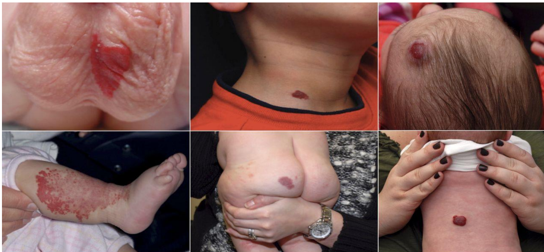
Slika 1. Lokalizacija Hemangioma

Hemangiomi su dobroćudne tvorevine građene od umnoženih stanica malih krvnih žilica. Nepoznatog su uzroka, a javljaju se u oko 2,5% novorođenčadi, tj. 5 – 10% dojenčadi. U 60% slučajeva javljaju se na glavi i vratu, u 25 % na trupu, a oko 15% na ekstremitetima. Obično su izolirani i dobro ograničeni (70%), rjeđe mogu zahvaćati veća područja ili biti multipli. Ako su multipli, tj. ima ih više od 5 na koži, veća je šansa da se mogu pojaviti i na unutrašnjim organima, najčešće jetri ili grlu. Hemangiom nastaje kada se male krvne žile počnu razmnožavati nenormalnom brzinom i tvore masu ili kvržicu. Moguće je imati više hemangioma [5].