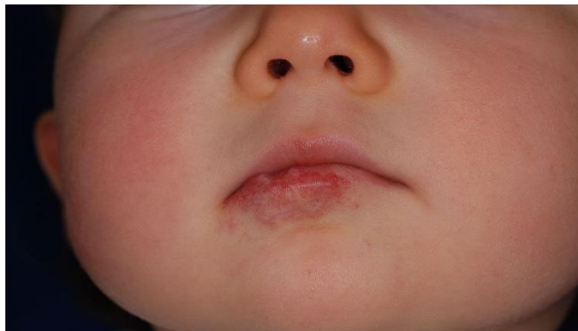
Slika 4. Hemangiom na usni

Hemangiom se može pojaviti oko usana, na gornjoj usni, na donjoj usni pa čak i u ustima. Čest je kod male djece, izgleda na usnici kao blastom veličine bobica. Iskrivljenost usana zbog hemangioma uobičajena, usne (a posebno donja usna) izložene su povećanom riziku od ulceracija, što rezultira boli i krvarenjem u kratkom roku te povećanim ožiljcima [27]. Jednom kada se pojavi ulceracija, neka će novorođenčad imati poteškoće kod dojenja. Nadalje, vršak usne je jedinstveno tkivo koje se ne može zamijeniti ako se trajno ošteti ulceracija, i rekonstrukcija normalnih kontura usana nakon ulceracije može biti izazovna. Proaktivno upravljanje usne, često sistemsko, je od vitalnog značaja ako se želi izbjeći ulceracija. Međutim, u donjoj usni nekih 30% lezija na kraju ulcerira. Jednom kada dođe do ulceracije, okluzijski preljevi nisu praktični, a terapije poput topikalnih anestetika i proizvoda na bazi nafte nose rizik od slučajnog oralnog gutanja. Povremeno djeca s hemangiomom na usni imaju koristi od laserskog liječenja. Pozornost je najbolje usmjeriti na sustavnu terapiju kako bi se smanjila vjerojatnost daljnjih ulceracija i pretjeranog produljenja usne [28].