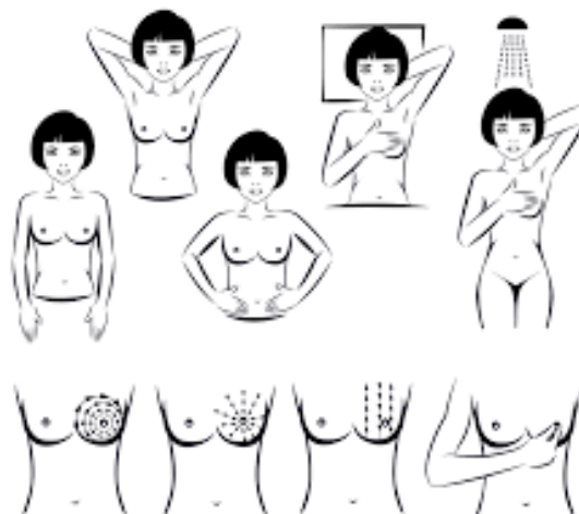
Slika 1.4.1.2. Samopregled dojke

podignu iznad glave te se gleda pomiču li se obje dojke simetrično. Nakon toga slijedi pregled opipavanjem. Prstima lijeve ruke pažljivo se opipa desna dojka, a desna ruka je podignuta. Prsti moraju biti vodoravno postavljeni na dojku i ispruženi. Započinje se u gornjoj vanjskoj strani dojke i kružnim pokretima se pregleda cijela dojka te se na isti način pregleda i desna pazušna jama. Isti postupak se ponovi i na lijevoj dojci. Također, samopregled se može vršiti i u ležećem položaju, a to se preporučuje jer se u ležećem položaju tkivo dojke ravnomjerno raspoređi po prsima. Žena legne na leđa, stavi jastuk ispod desne lopatice te podigne desnu ruku i kružnim pokretima pregleda cijelu dojku. Postupak se ponovi i na lijevoj dojci. Samopregled završava nježnim pritiskom palca i kažiprsta na obje bradavice kako bi se provjerilo ima li iscjetka [16].